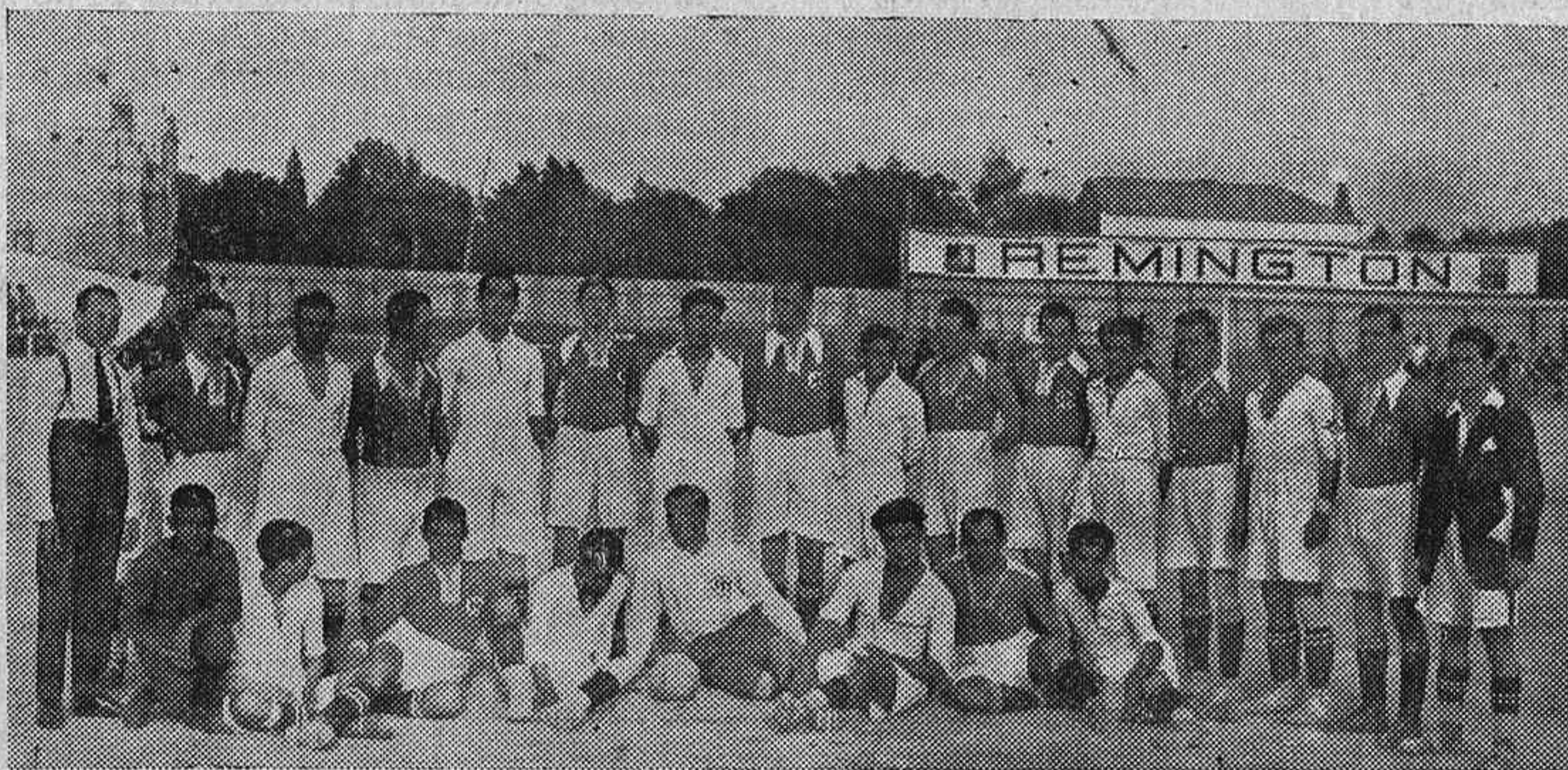
El equipo Aleman V. F. B. y el Real Córdoba Sporting momentos antes de empezar el encuentro

Y a esa alegre técnica, a ese juego floreado, opusieron los representantes del once alemán el más puro estilo inglés.