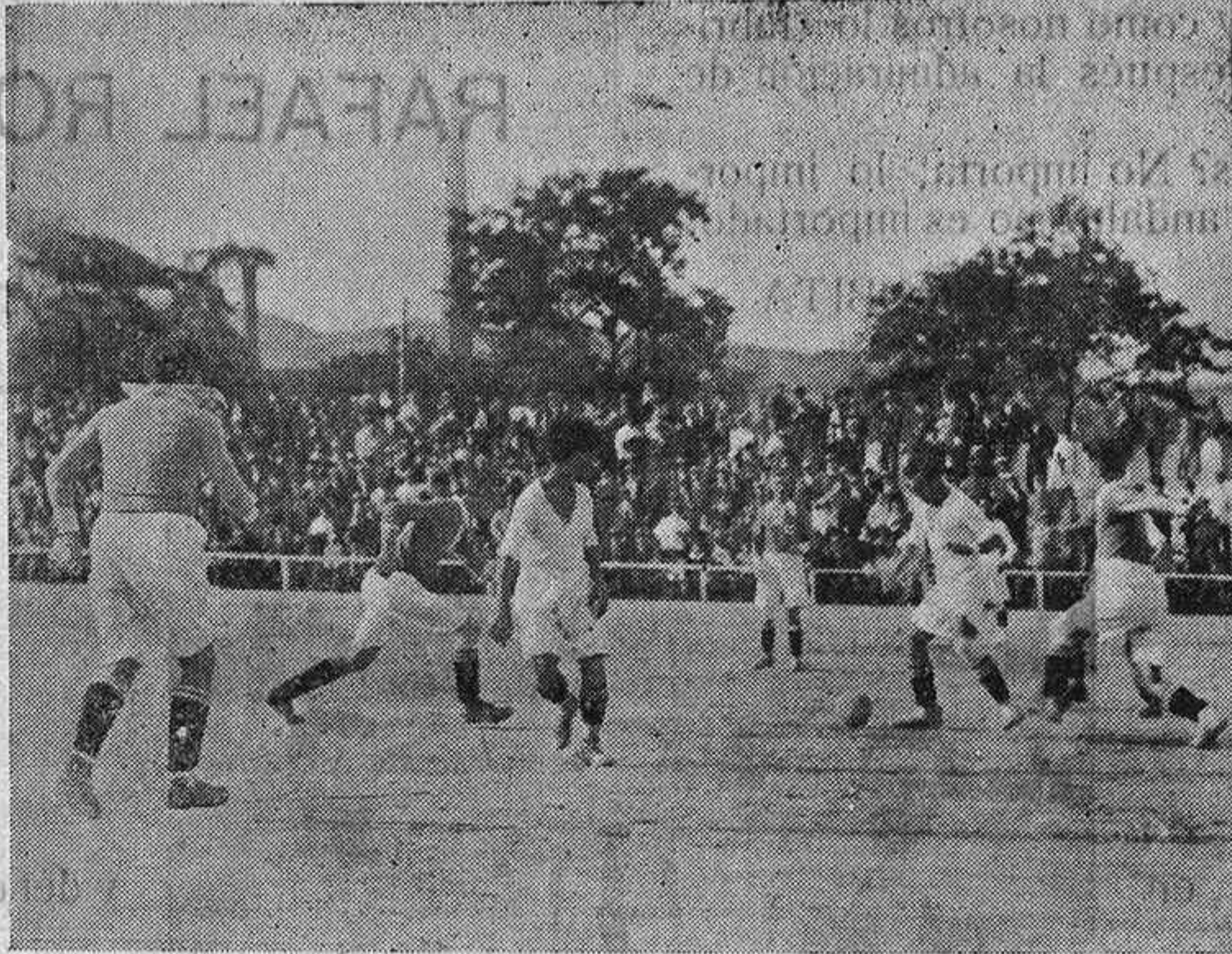
Un buen avance de los realistas, que la defensa alemana intercepta admirablemente.

Otro de los nuevos elementos, Rey, jugó ayer de delantero después de doce meses de