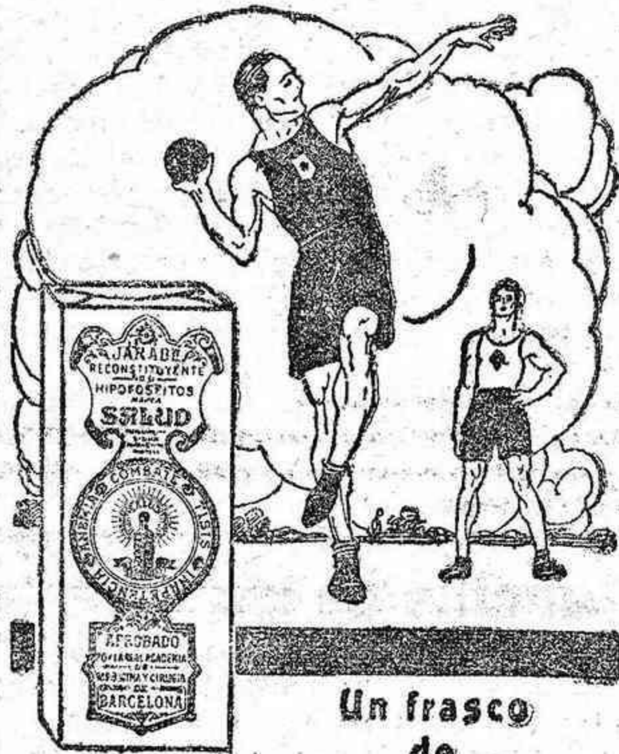
Un frasco de