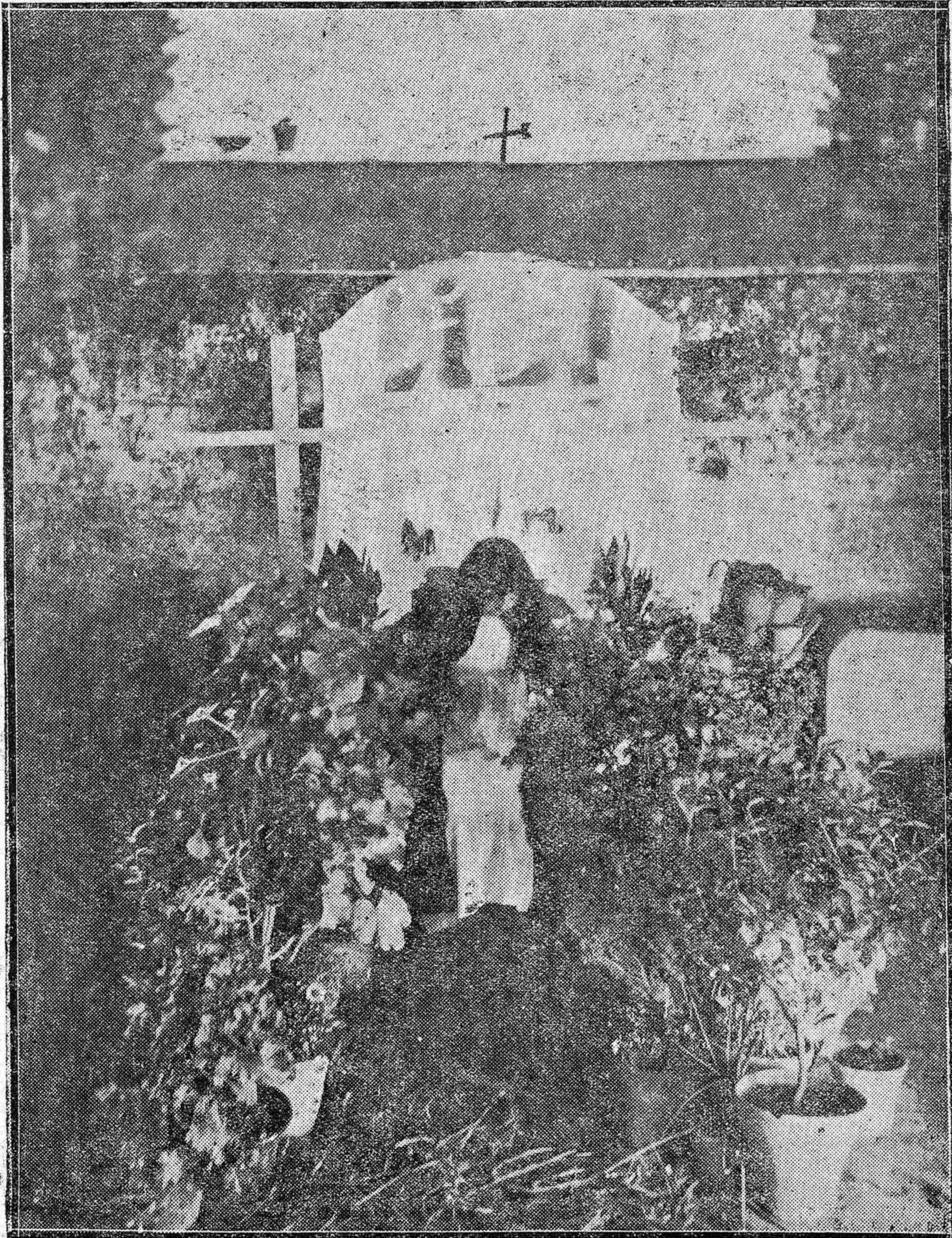
Artístico y modesto altar instalado en una pobrísima casa de la calle Navas de Tolosa, que mereció el premio extraordinario del Ayuntamiento.