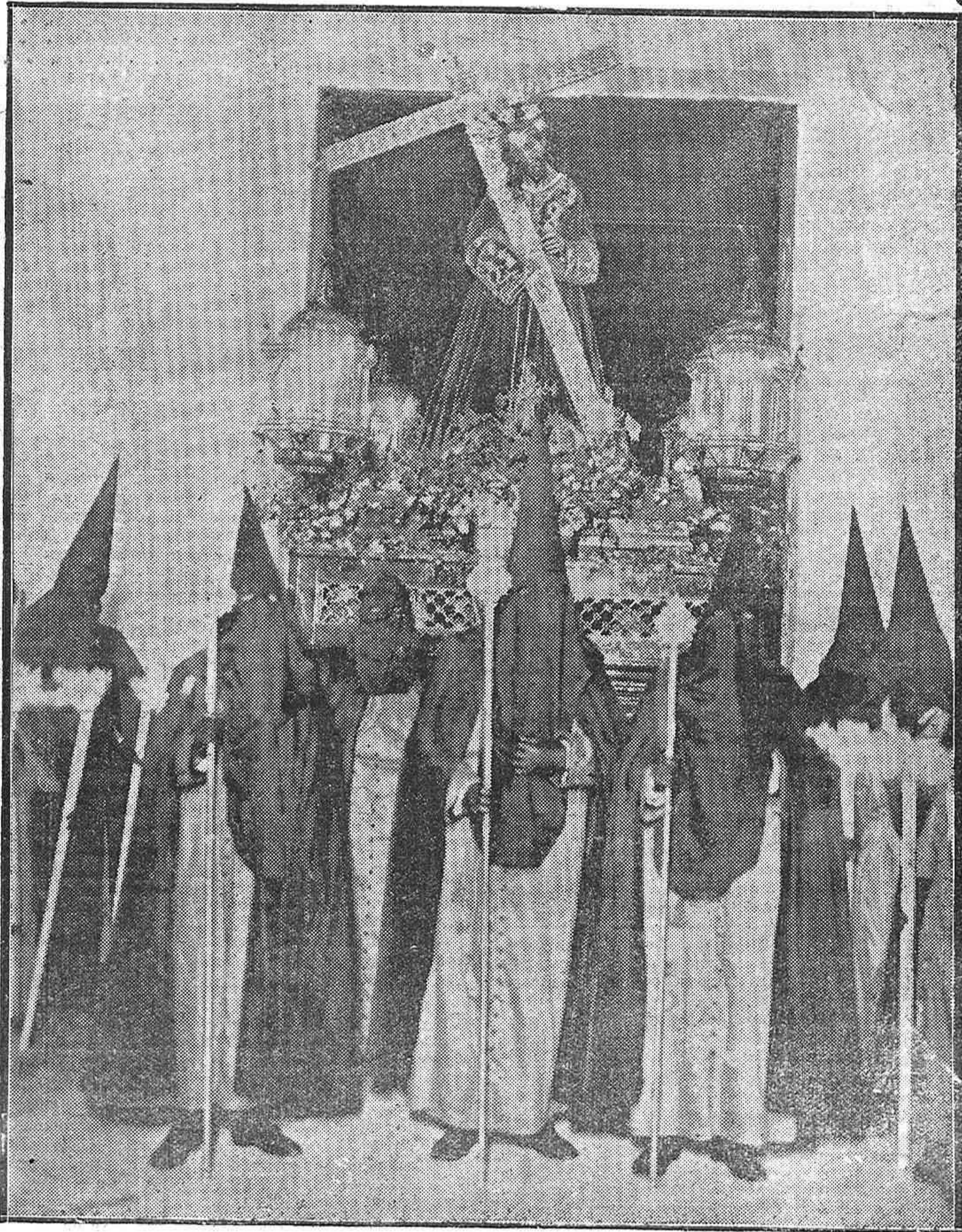
ECIJA.—El hermoso «paso» de Nuestro Padre Jesús Nazareno abrazado a la Cruz, perteneciente a la cofradía del Silencio, que este año por vez primera salió de la iglesia de Santa Cruz, en la noche del Jueves Santo.