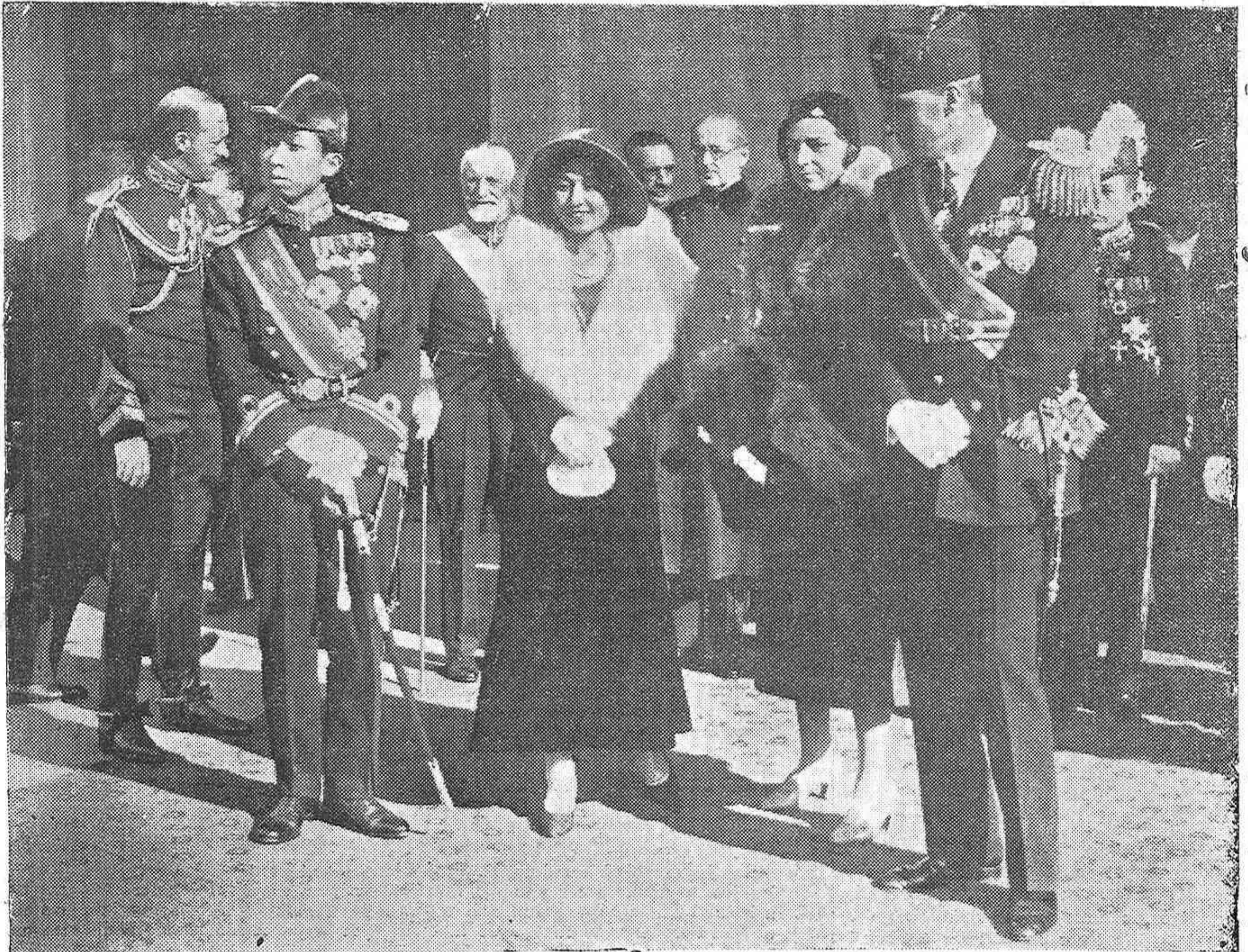
MADRID.—EN LA ESTACIÓN DEL NORTE.—LOS PRÍNCIPES DEL JAPÓN A SU LLEGADA A MADRID CON LOS INFANTES DOÑA BEATRIZ Y DON ALFONSO DE ORLEANS, PRESENCIANDO EL DESFILE DE LAS TROPAS QUE LES RINDIERON HONORES

Trincheras superiores con tres telas y una de ellas cauchutada, para caballero, desde 25 pesetas, y para niño desde 12 pesetas, en EL METRO y sus TRES SUCURSALES