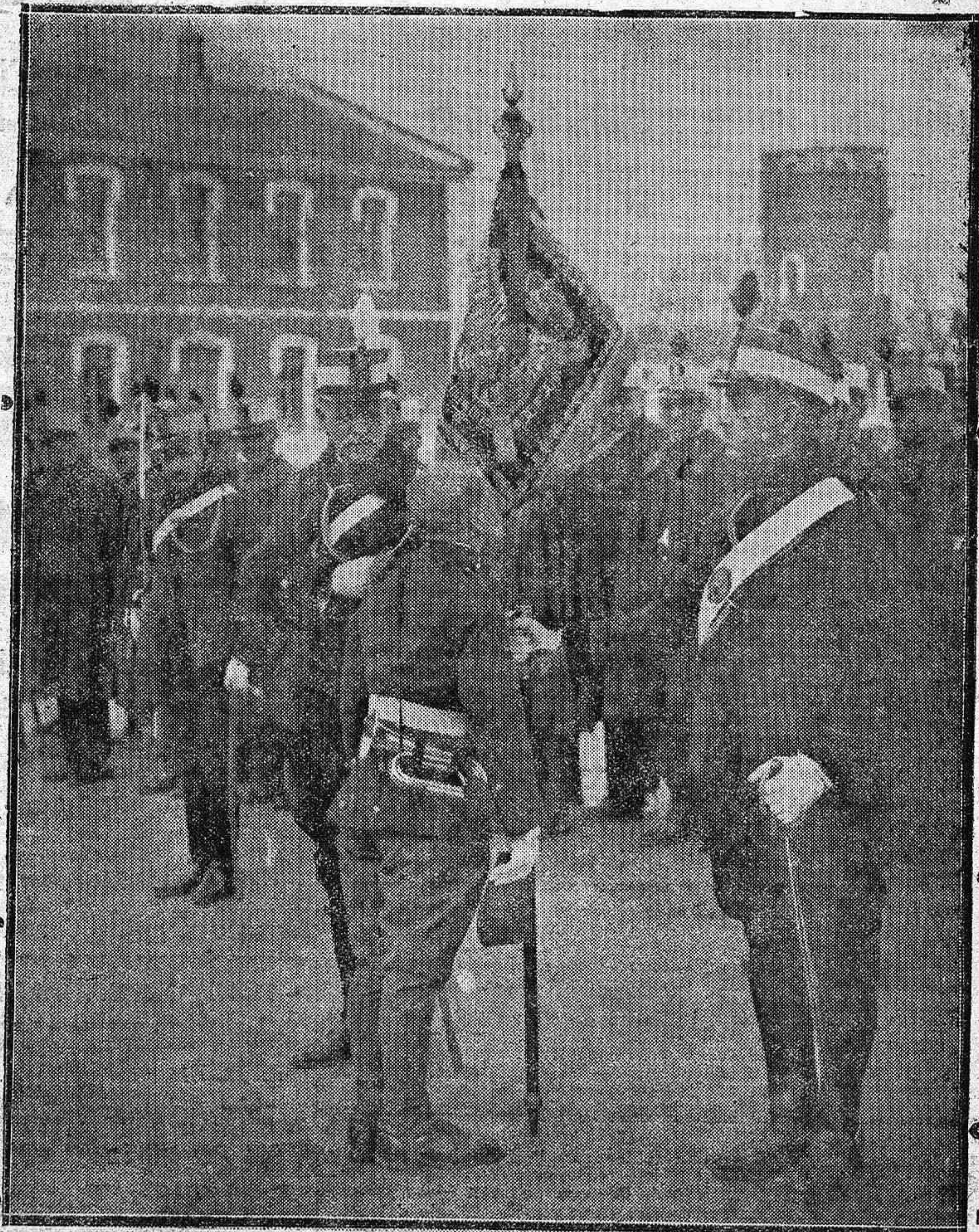
LA JURA DE LA BANDERA. — Un trompeta del 4.º pesado prestando juramento de fidelidad en el Cuartel de San Rafael.