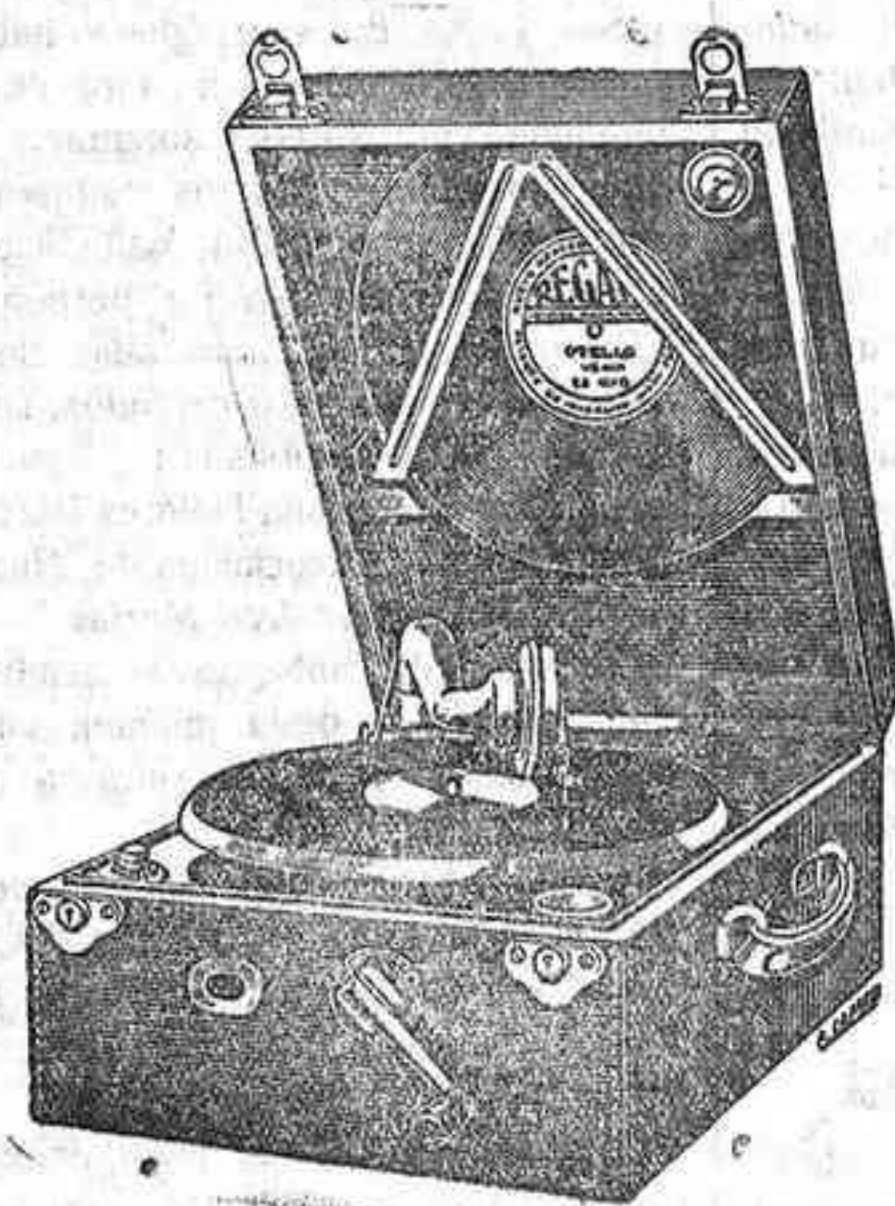
Claudio Marcelo, número 13. - CORDOBA

Gran Confitería, Pastelería y Café Teléfono, núms. 42 y 4 Sucursales: Café Gran Capitán, Salones de billar en todos los establecimientos.