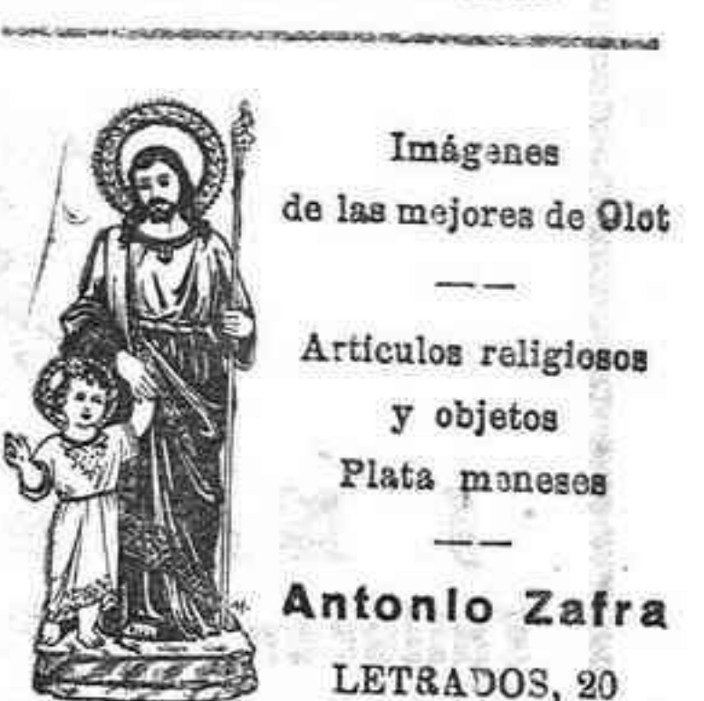
Imágenes de las mejores de Olot