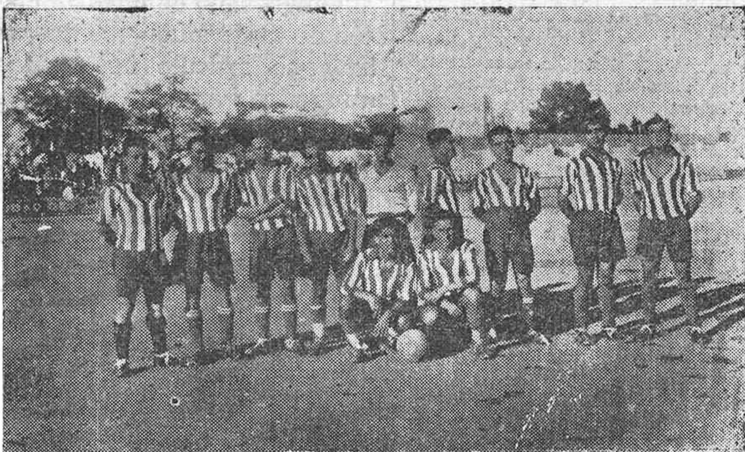
EL RACING CLUB QUE INAUGURÓ LA TEMPORADA DEPORTIVA EN EL STADIUM, GANANDO UNA COPA

GANGA: Sábanas de baño a 4 pesetas, albornoz a 17 pesetas, pijamas caballero a 9 pesetas, toallas afelpadas grandes jaretón a 0,85, en El Metro y sus tres Sucursales.