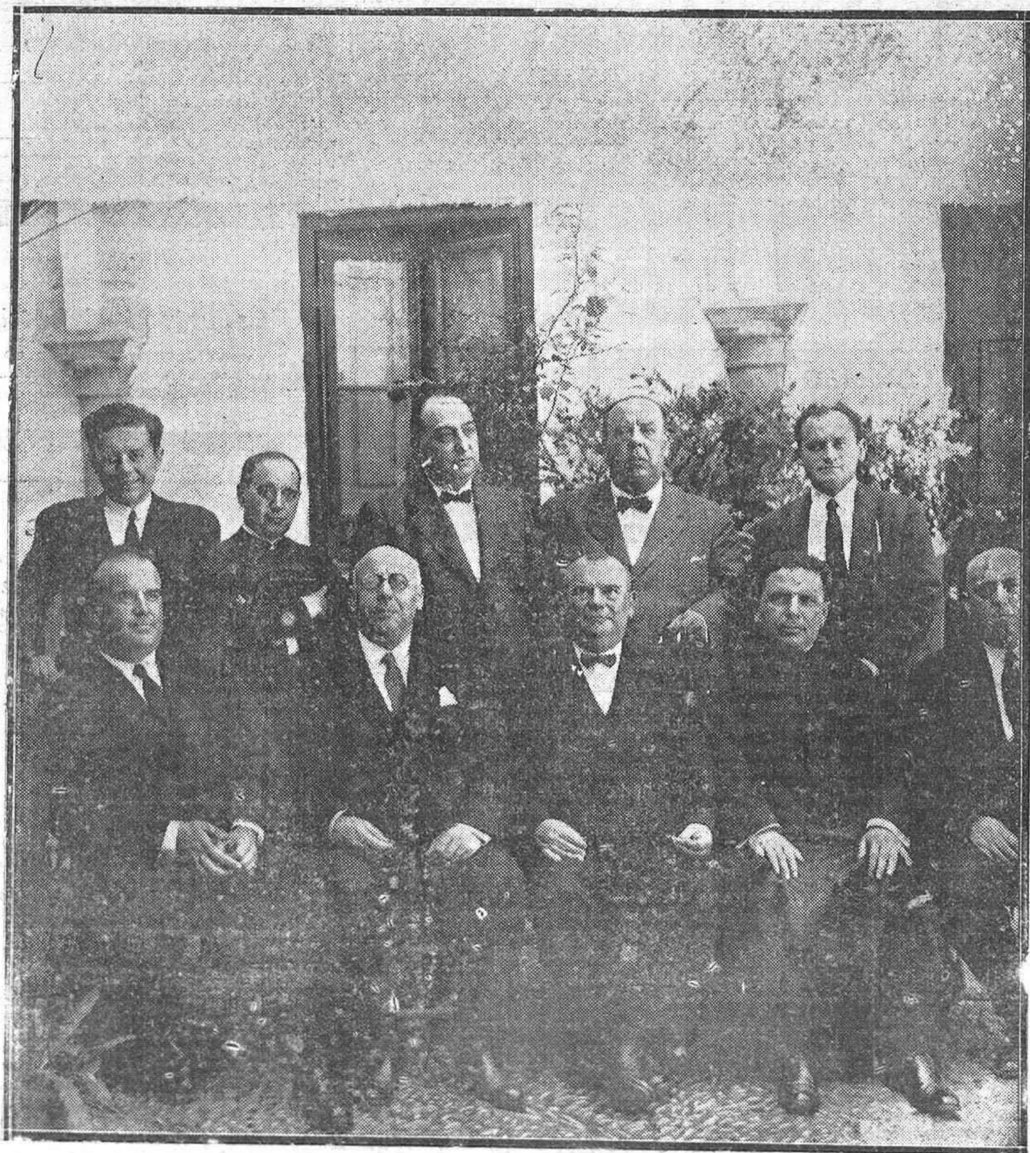
LA FIESTA DE LOS PROCURADORES.—EL ILUSTRE COLEGIO DE PROCURADORES AL TERMINAR LA SOLEMNE FIESTA RELIGIOSA QUE CELEBRARON EN HONOR DE SU PATRONA LA VIRGEN DE LOS DOLORES