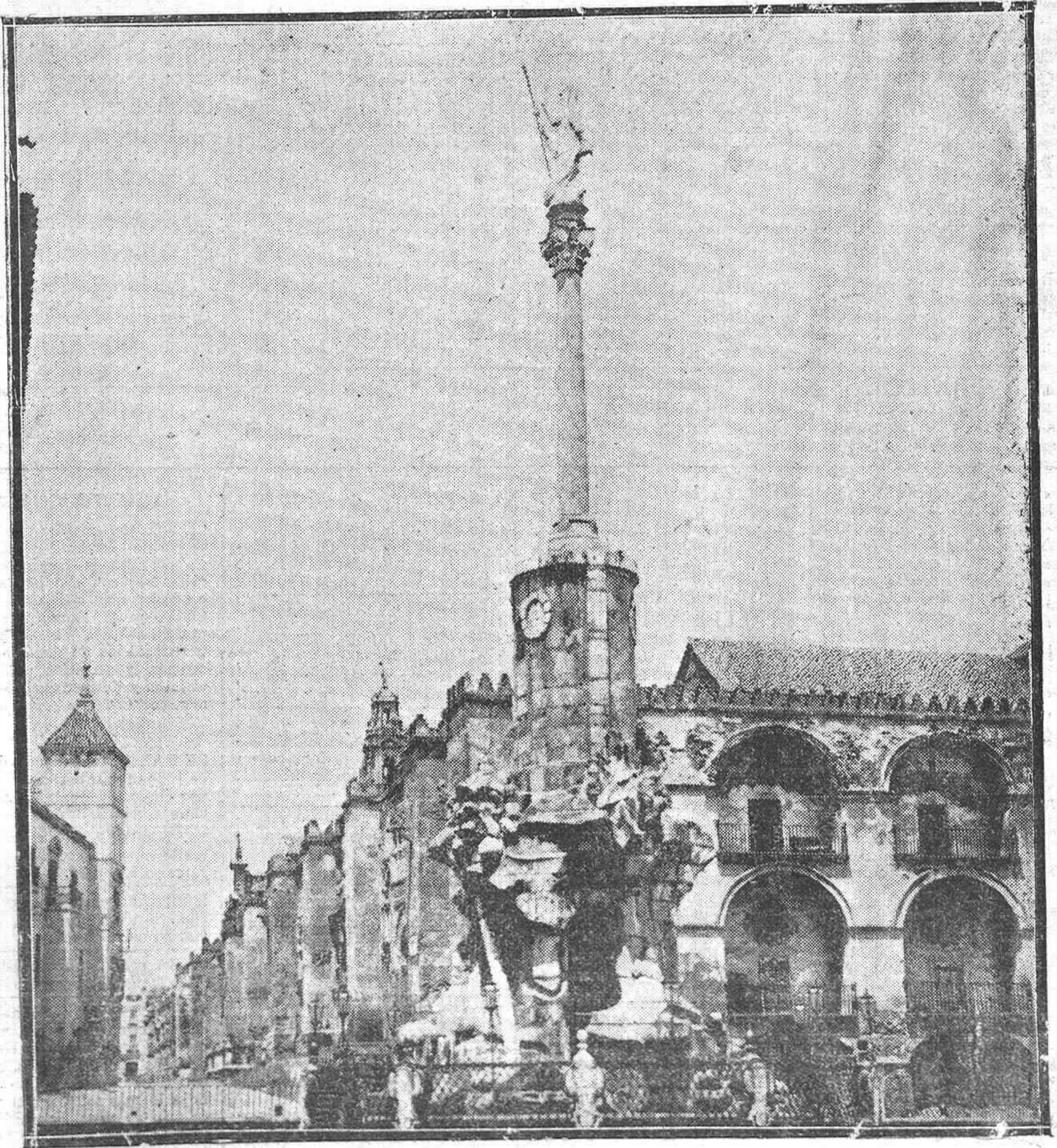
UNA INTERESANTE PERSPECTIVA DEL TRIUNFO DE SAN RAFAEL