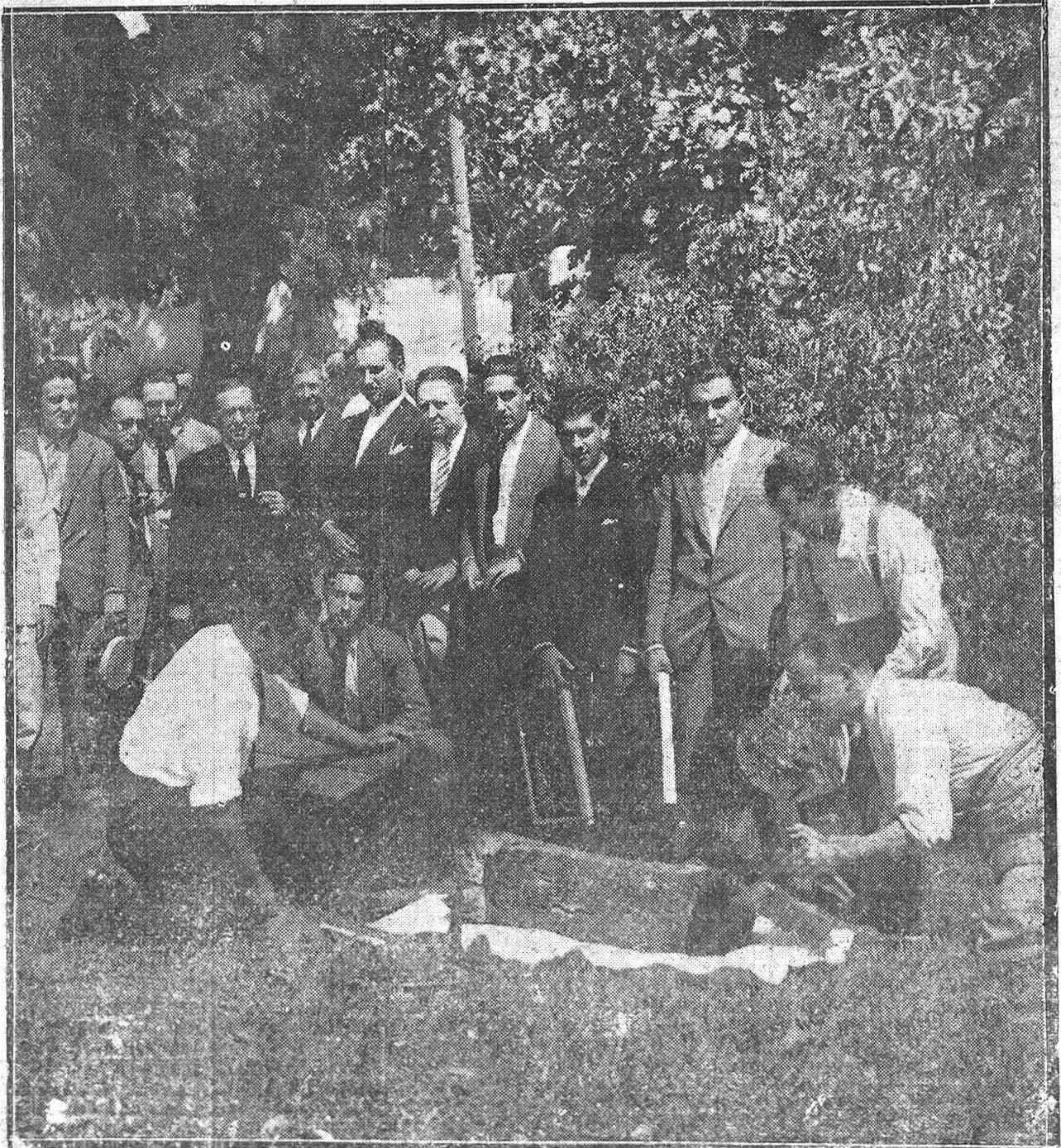
EL CURSILLO DE APICULTURA.—LOS PROFESORES APICOLAS DURANTE UNA DE LAS CLASES PRÁCTICAS DE LA ESPECIALIDAD