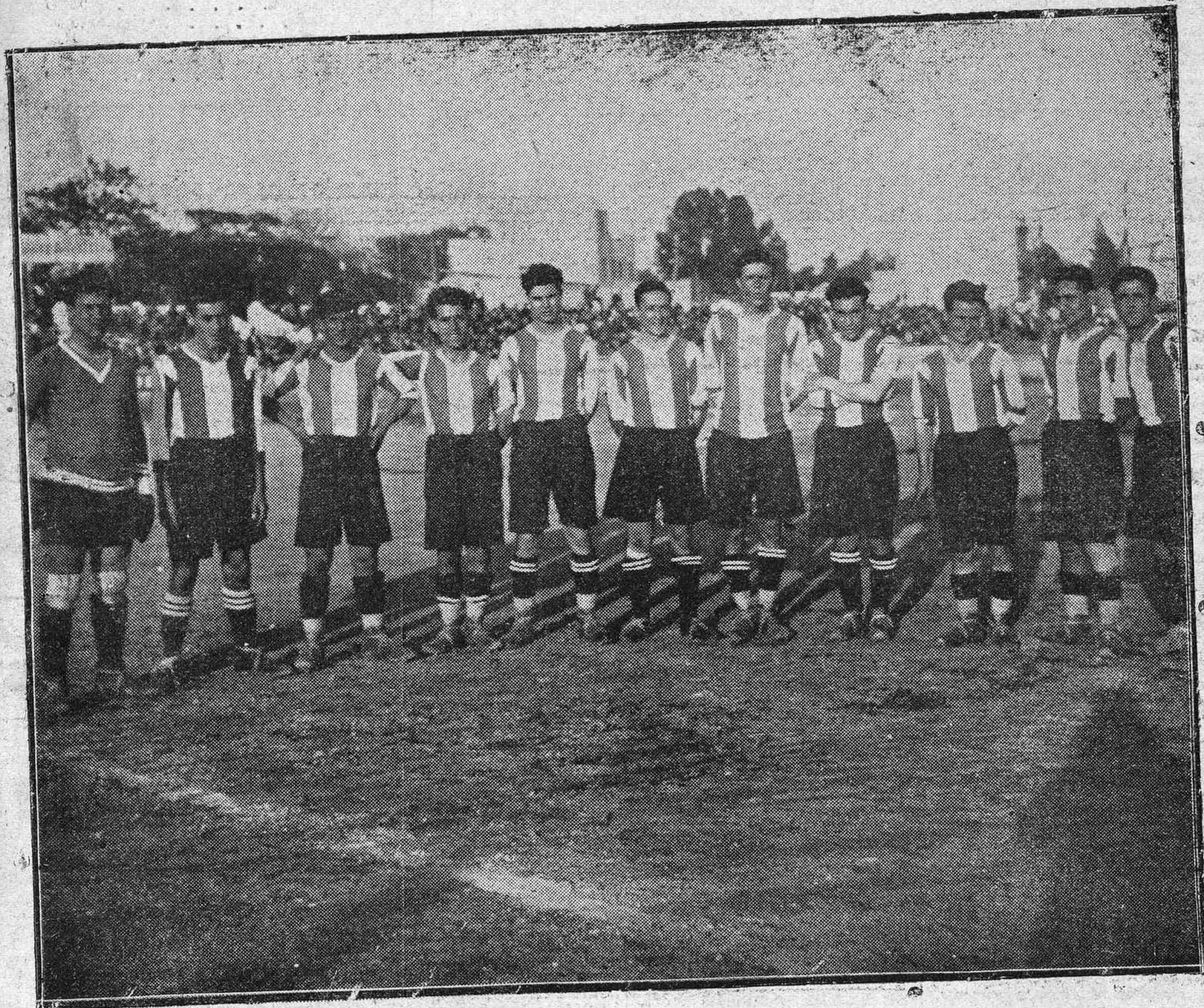
EL EQUIPO CÓRDOBA RACING CLUB, QUE HA RESULTADO TRIUNFANTE EN SU SECTOR, EN LAS PRUEBAS DE SEGUNDA CATEGORÍA PREFERENTE.