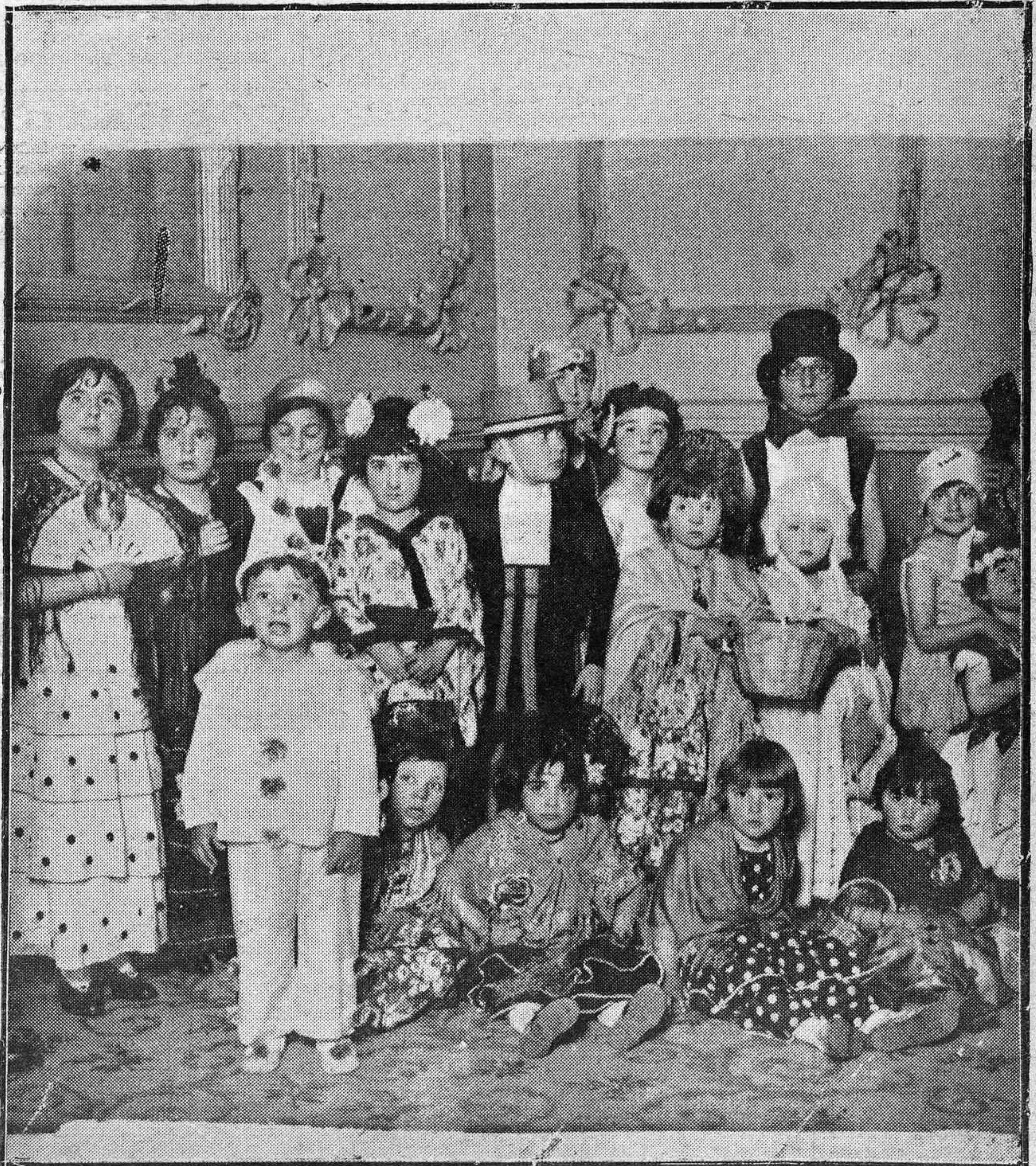
EL BAILE INFANTIL DE DISFRACES CELEBRADO EN EL CIRCULO DE LA AMISTAD.—PRECIOSOS NIÑOS QUE CONCURRIERON, SIENDO OBSEQUIADOS CON JUGUETES Y DULCES.