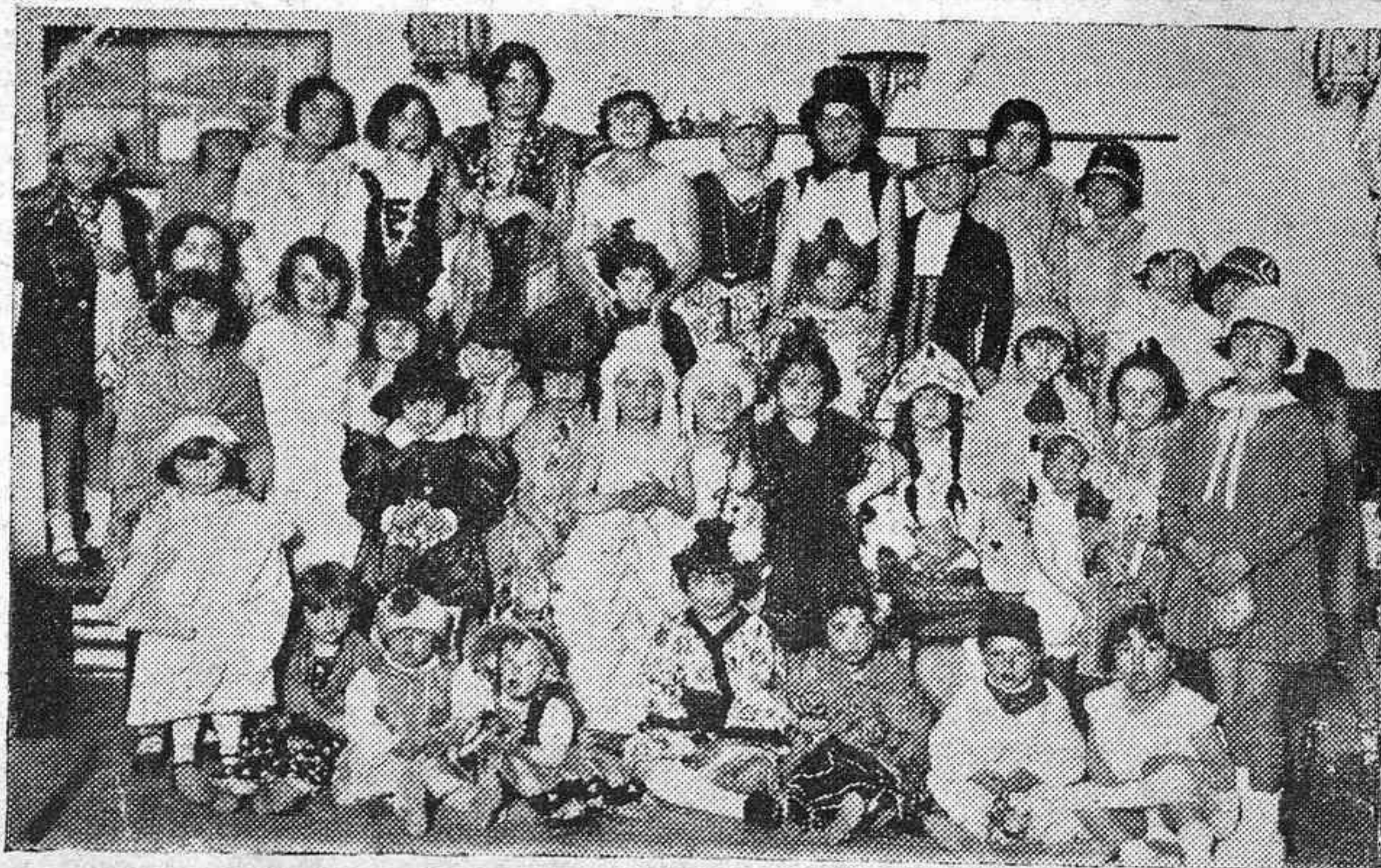
EN EL CIRCULO DE LA AMISTAD.—GRUPO DE LINDISIMAS MÁSCARAS QUE ASISTIERON AL BAILE INFANTIL DE ANOCHÉ.

ANÍS CHISPA SECO Y DULCE ANTONIO PADILLA RUTE