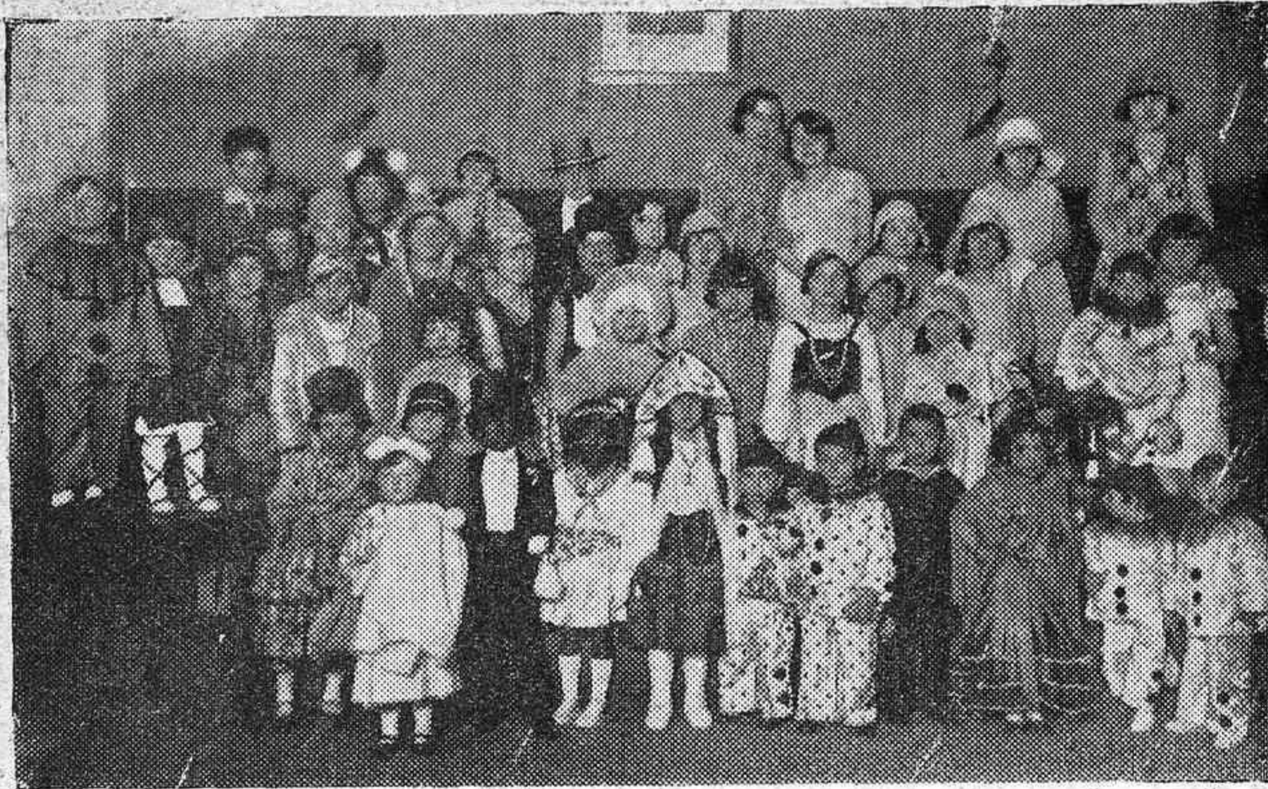
EN EL CIRCULO DE LA AMISTAD.—NIÑOS DISFRAZADOS, DURANTE EL FESTIVAL INFANTIL DE ANOCHÉ.

OPORTUNIDAD: en el piso primero de la casa Central de EL METRO, se liquidan todos los retales fin de pieza, con gran rebaja de precios.