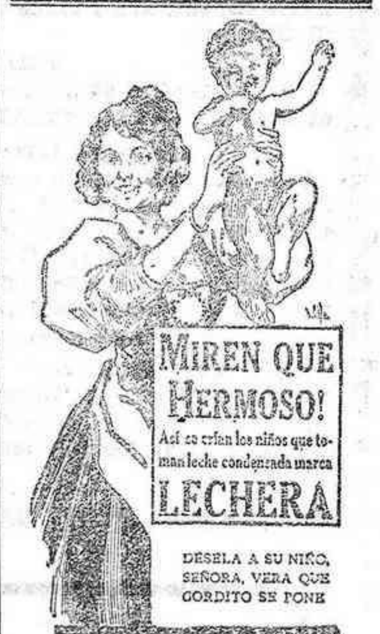
DESELA A SU NIÑO, SEÑORA, VERA QUE GORDITO SE PONE