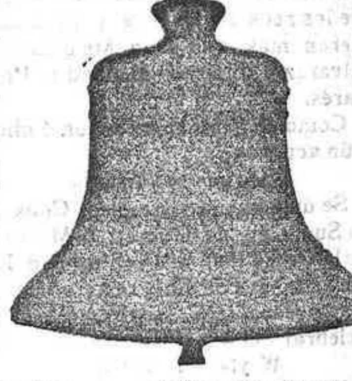
Carabanchel Bajo Madrid

Esta casa no tiene que ver nada con otras que dicen pertenecer á ella. Para todo diríjase á la casa constructora. Pídanse catálogo ó presupuesto á la casa LINARES de