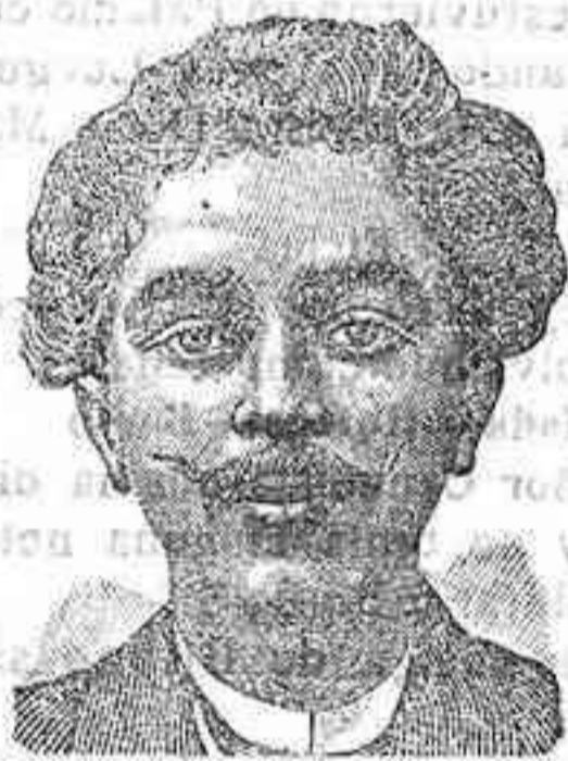
Después de 15 días de tratamiento