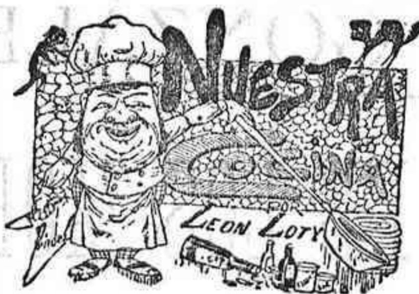
Comidas para el 22 de Febrero