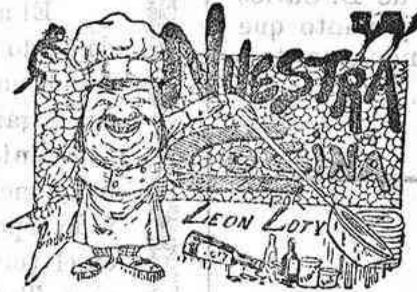
Comidas para el 16 de Enero