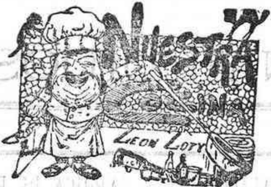
Comidas para el 13 de Octubre

Su viuda é hijos ruegan á sus amigos le encomienden á Dios Nuestro Señor.