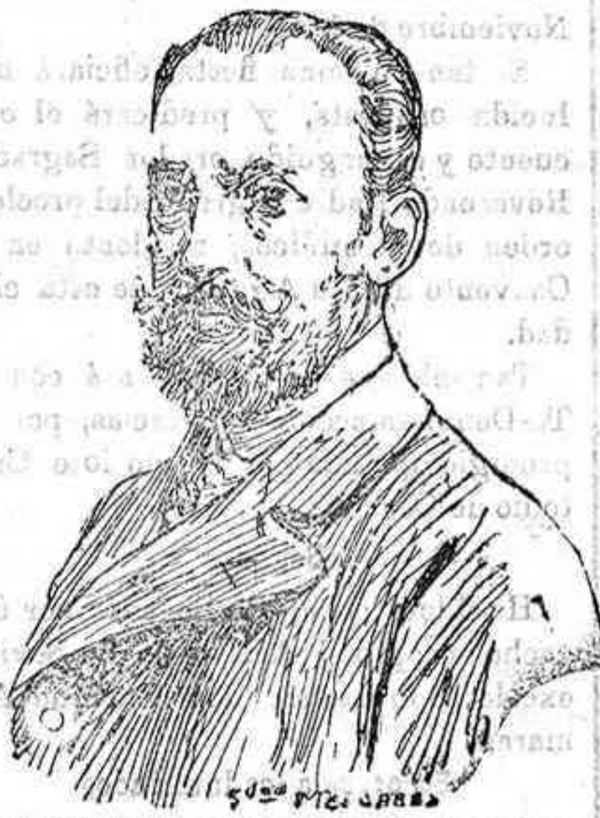
Señor conde de Peñalver