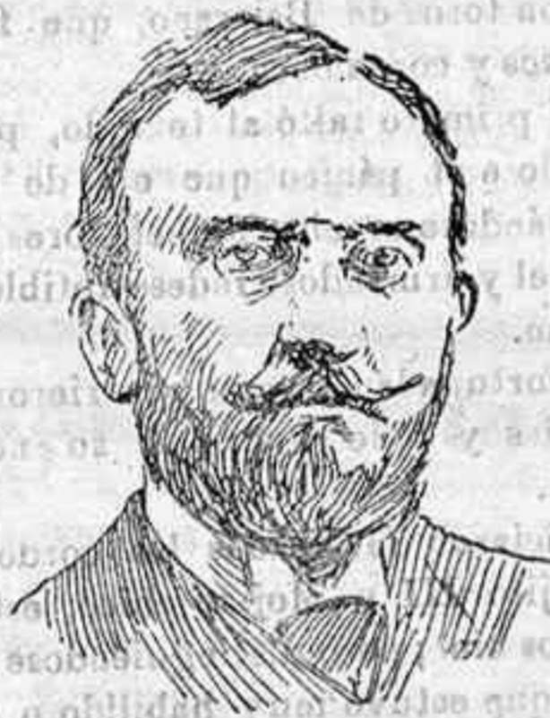
El marqués de Figueroa

Enalzó la grandeza de la justicia federal de los yanquis, obra maestra de su Constitución.