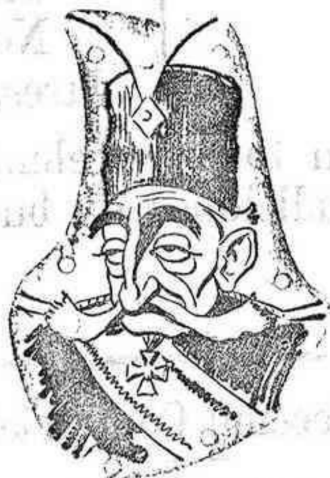
La del Rey de Persia