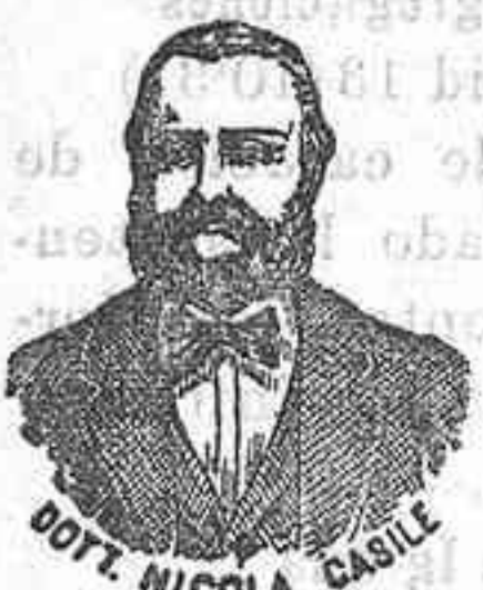
Inventor de los renombrados medicamentos CASILE Diputación, 435, Barma.