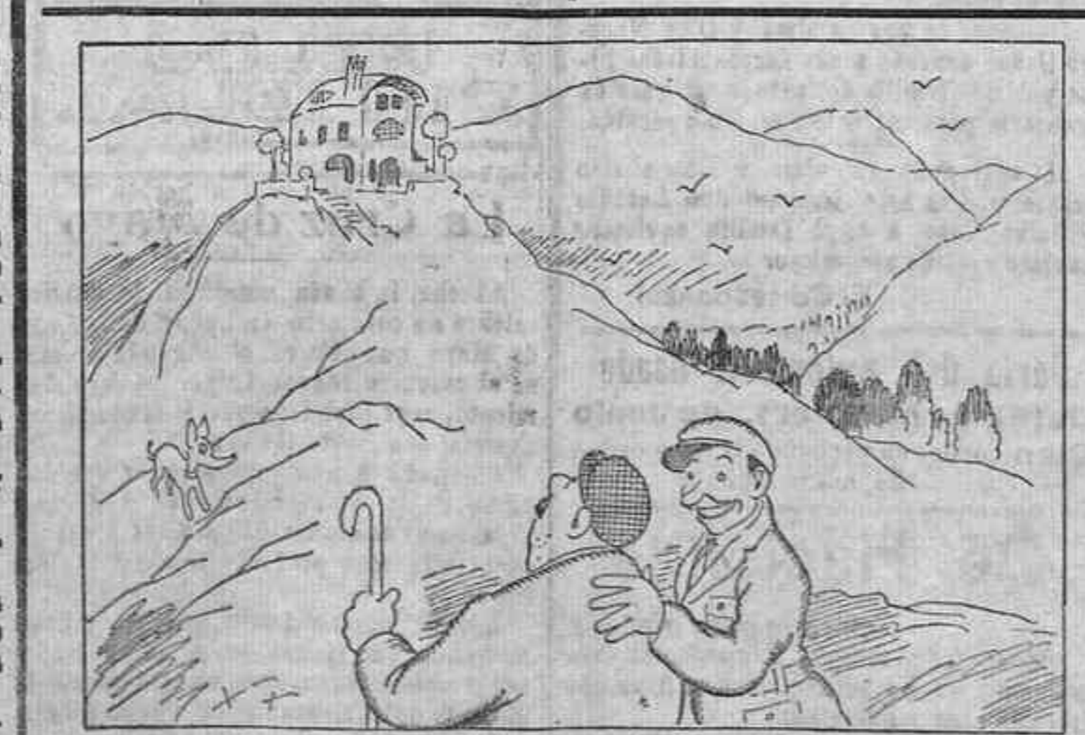
—Provéase Vd. de todo porque la finca está muy apartada. —No hay cuidado, ya me he provisionado, hasta de Aspirina Bayer.