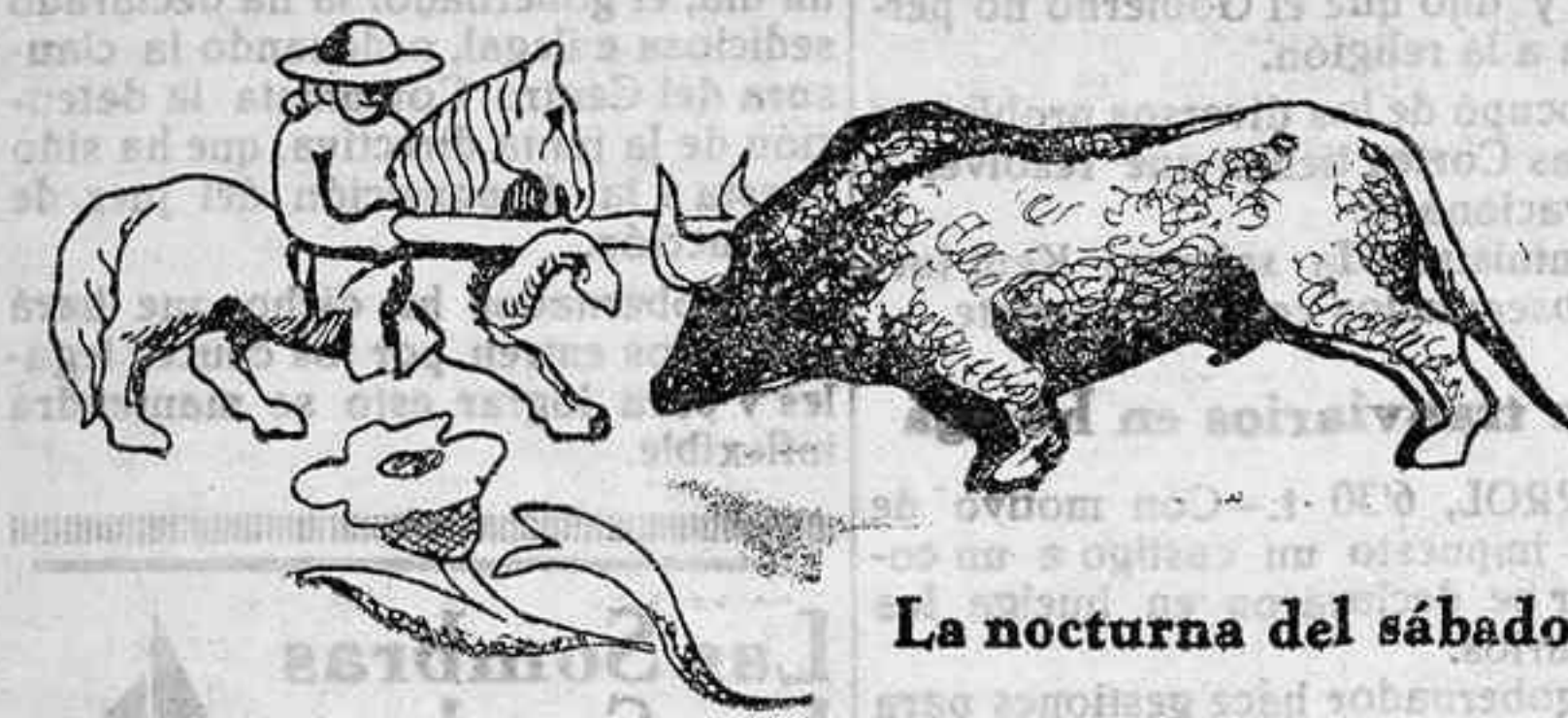
La nocturna del sábado

Pocas líneas para criticar la corrida de inauguración de la temporada nocturna y veraniega. Primero porque otras cuestiones reclaman la atención del periódico y segundo porque no merece otra cosa el desarrollo del programa taurino.