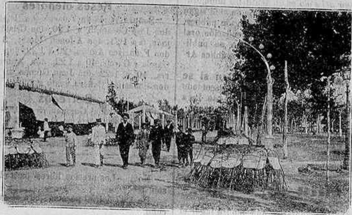
LA FERIA DE LA SALUD: EL PASEO DE LA VICTORIA.