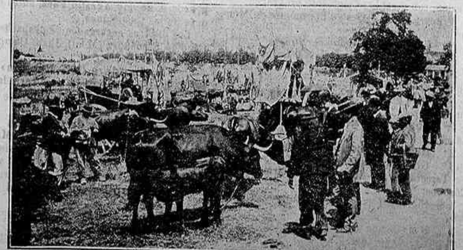
VISTA PARCIAL DEL MERCADO DE GANADOS