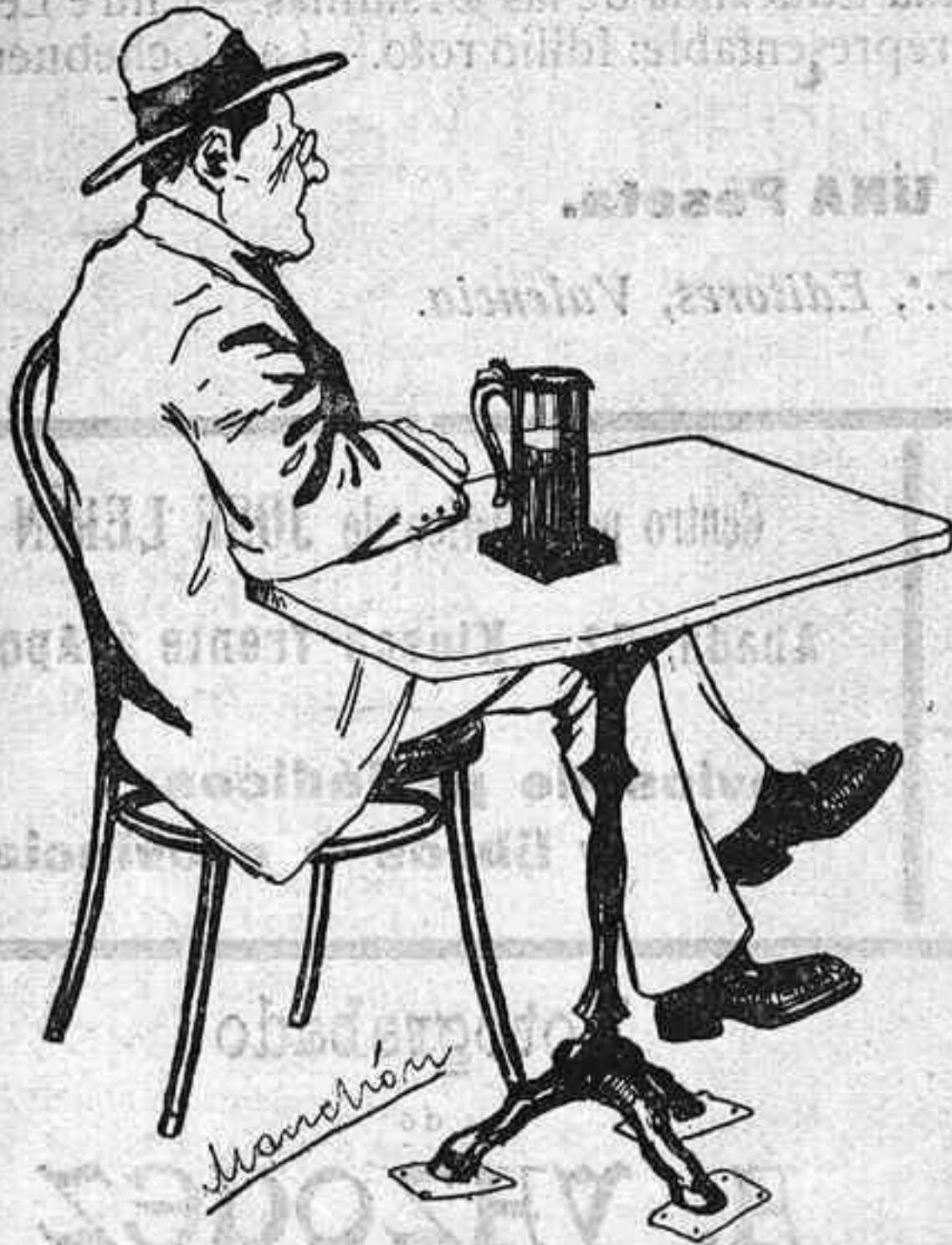
Un boc... balicón

Esta martingala no deja de tener gracia, pero es reprehensible. ¿Qué se diría de nos-