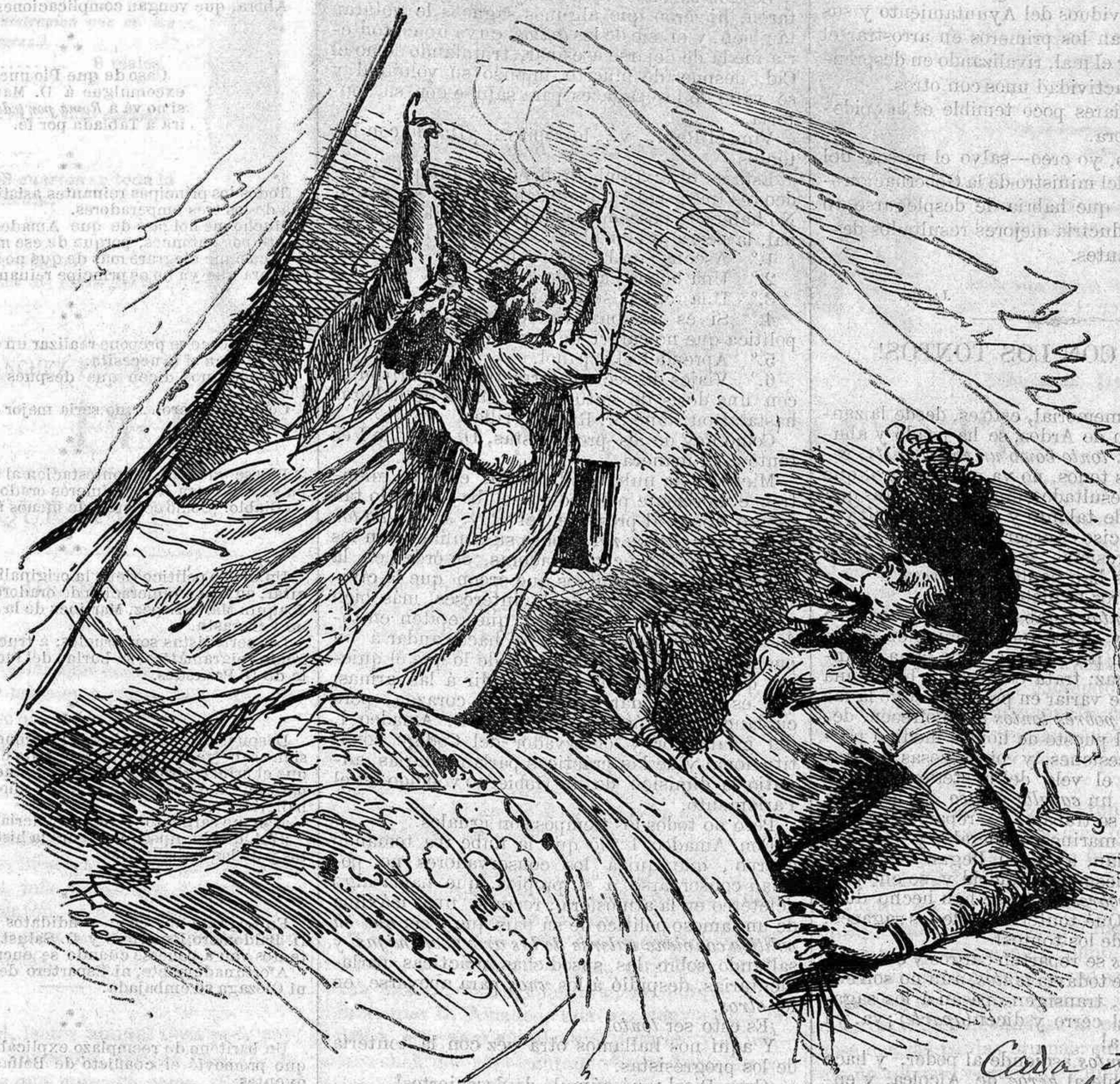
Don Mateo el emplazado. (¡Los dos apóstoles!)

Cada Apóstol, vale 50 mil duos. ¡El empuje en la gasta!