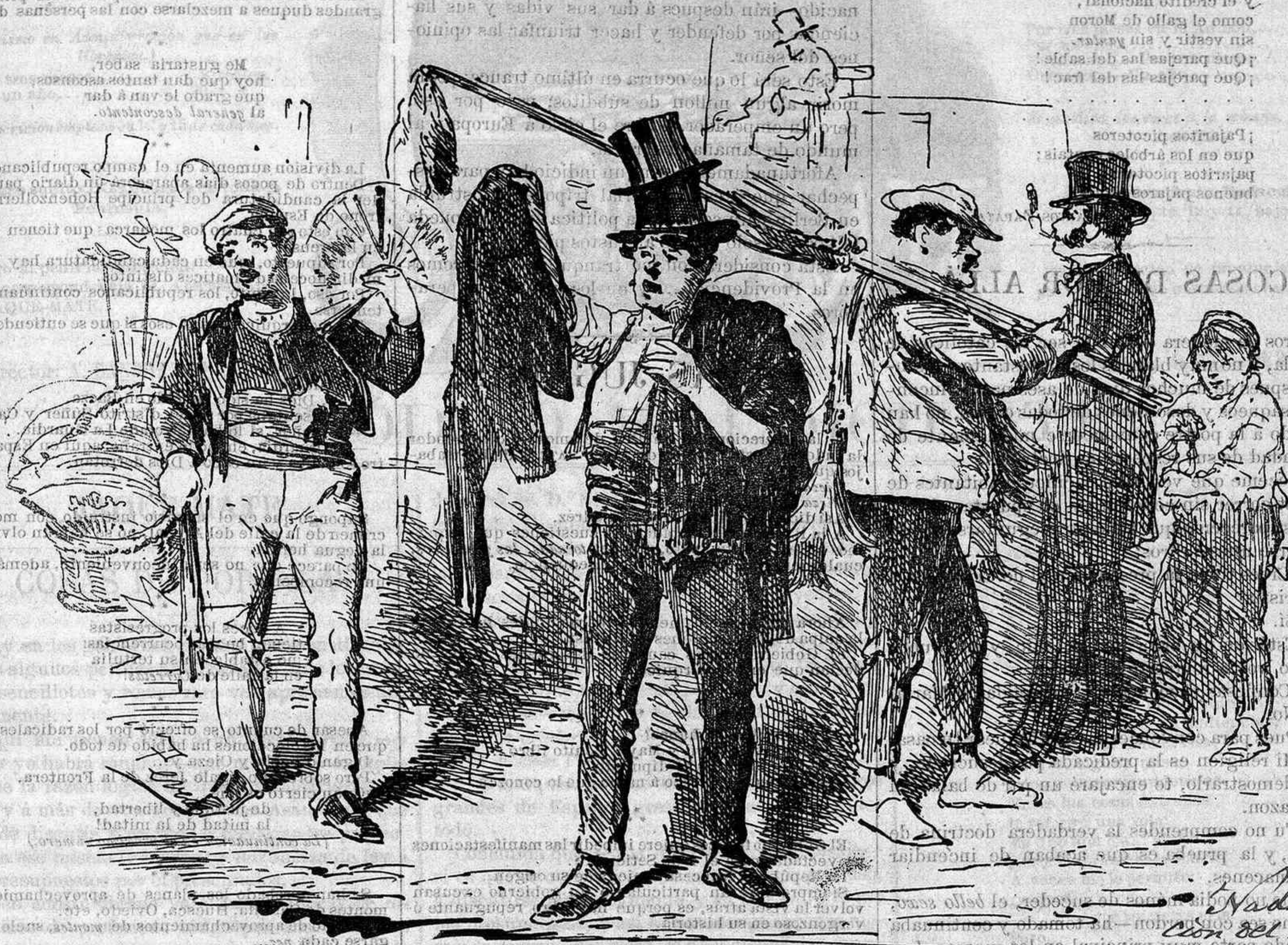
Personajes designados por el Gobierno para una de las próximas hornadas de Grandes de España.