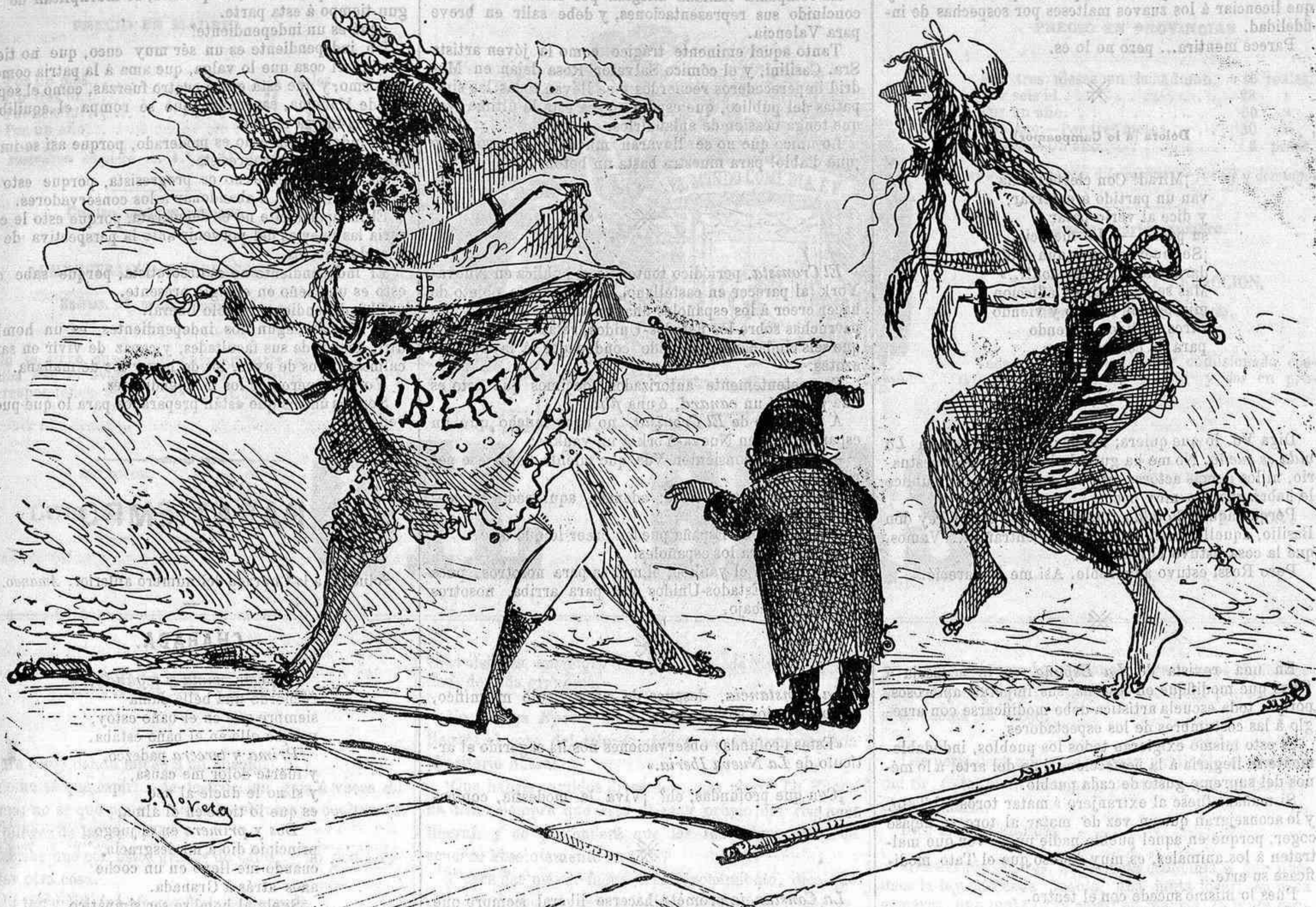
Solo de neo.

OYENTE.—Un desgraciado que ha venido al mundo para dar valor á todos los charlatanes. OPIO.—Todo programa político cuya tendencia es hacer dormir á los pueblos. ORO.—La voz de tenor que más conmueve á los espectadores. Cambiarlo por plata es trasportar el canto á la voz de bajo. OLVIDO.—No es como vulgarmente se cree el sudario que se echa sobre nuestras afecciones; al contrario, es el recuerdo placentero de lo que antes era recuerdo doloroso.—¿Piensa Vd en aquella ingrata y se desespera? Es que todavía la ama. ¿Piensa usted en ella y se sonrie? Es que ya la ha olvidado. OPILADA.—Estado en que suele hallarse una mujer antes de tomar... estado.