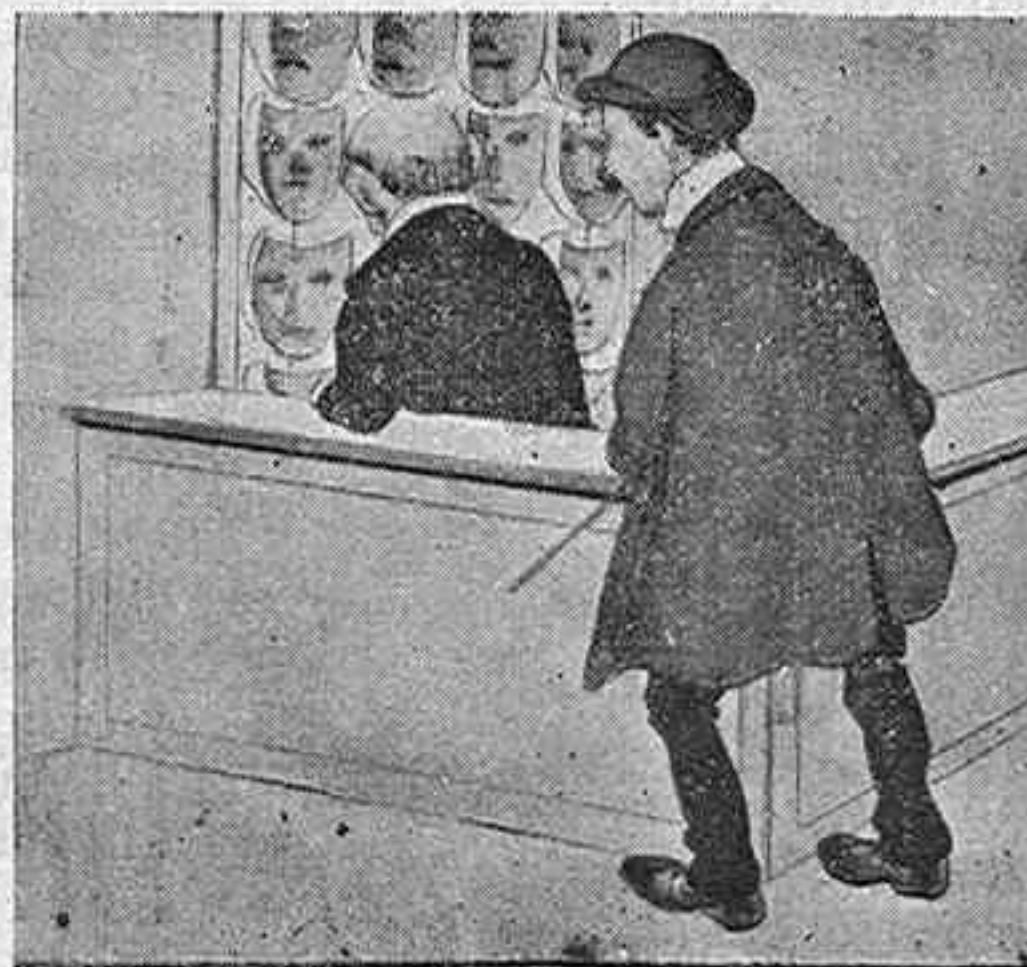
4.—¿Me hace usted el favor de decir el precio de esa careta tan fea del centro...