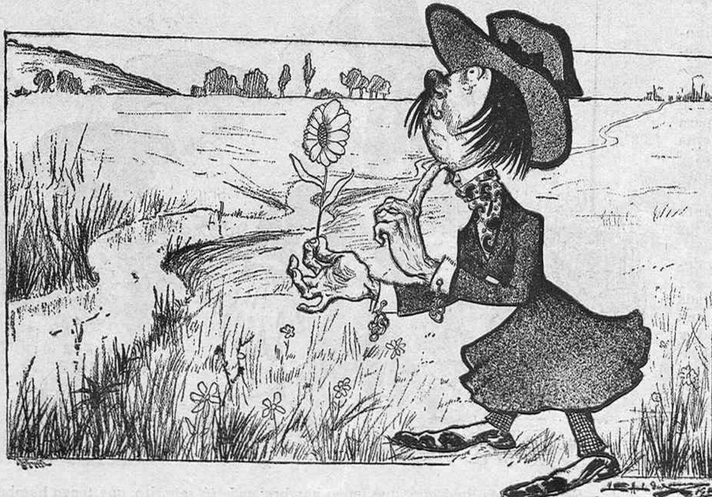
EL POETA MODERNO.—Tapiz para el Esteta-Club.

alejado de los focos de perdición que en la corte le habían tenido enfocado tanto tiempo y le habían hecho tanto daño.