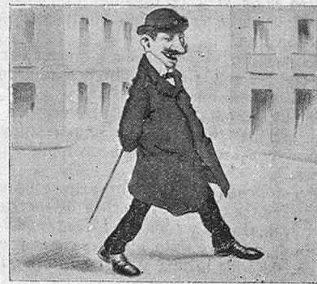
2.—Pero una careta muy fea, de esas que meten miedo.