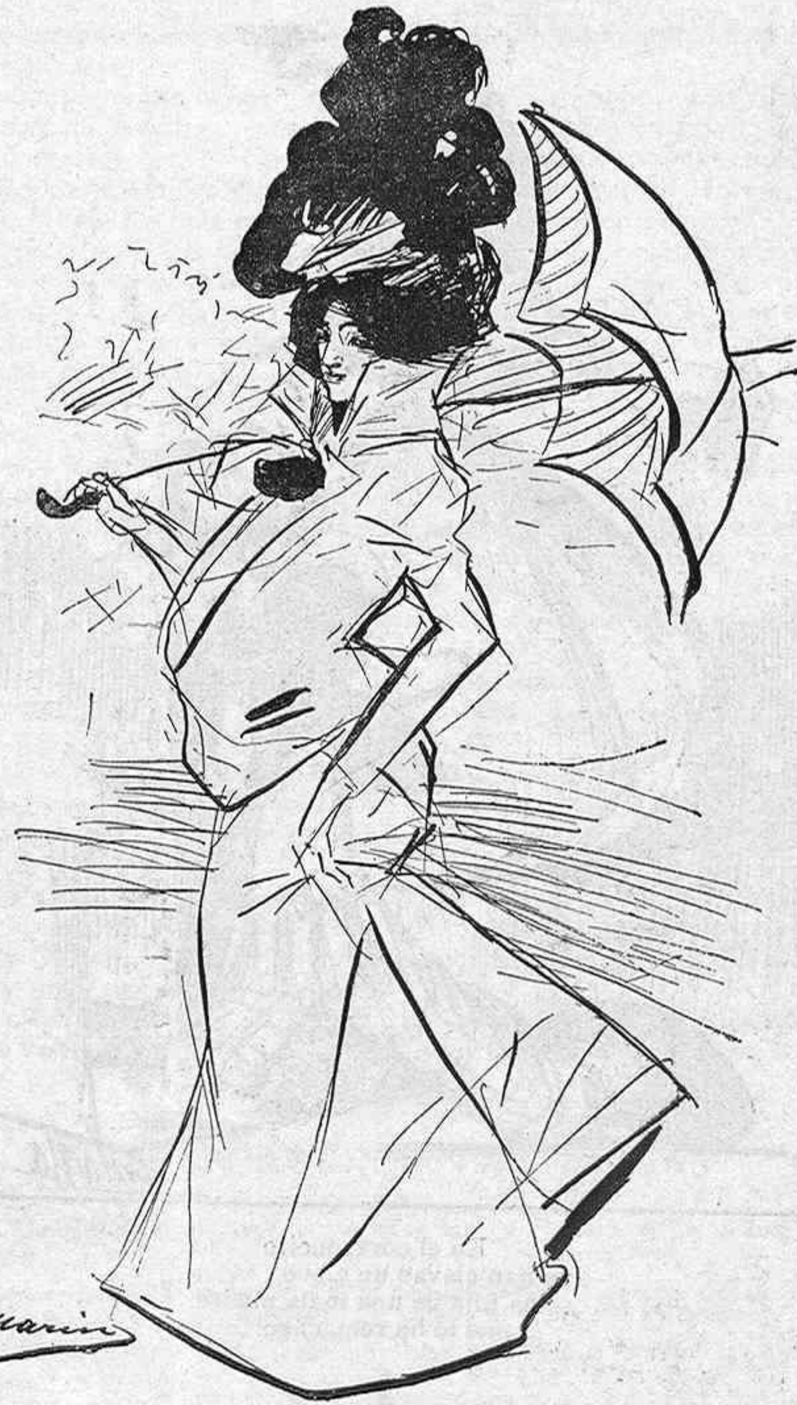
No mires á esta chiquilla que airosa cruza la calle; ¡porque estamos en Cuaresma y es pecado comer carne!