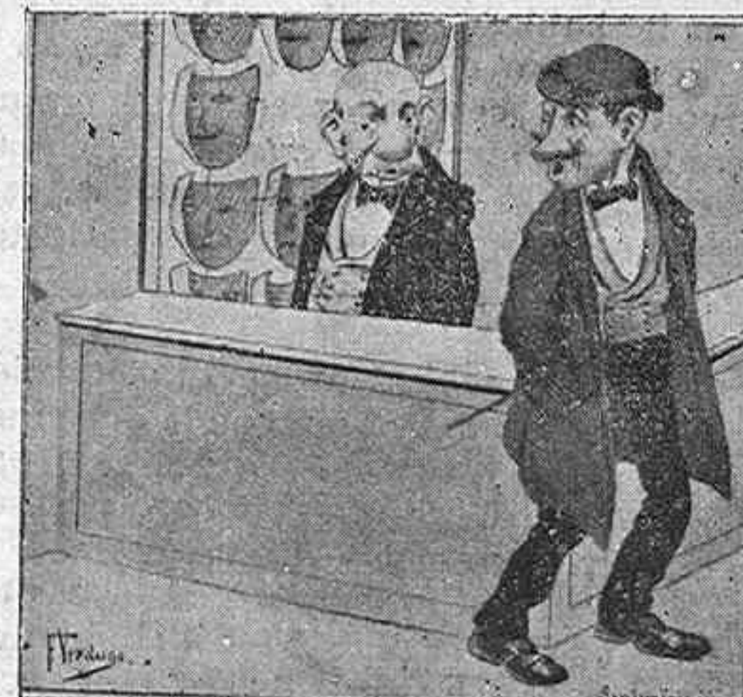
5.—¿Cuál? —¡¡ .....!!