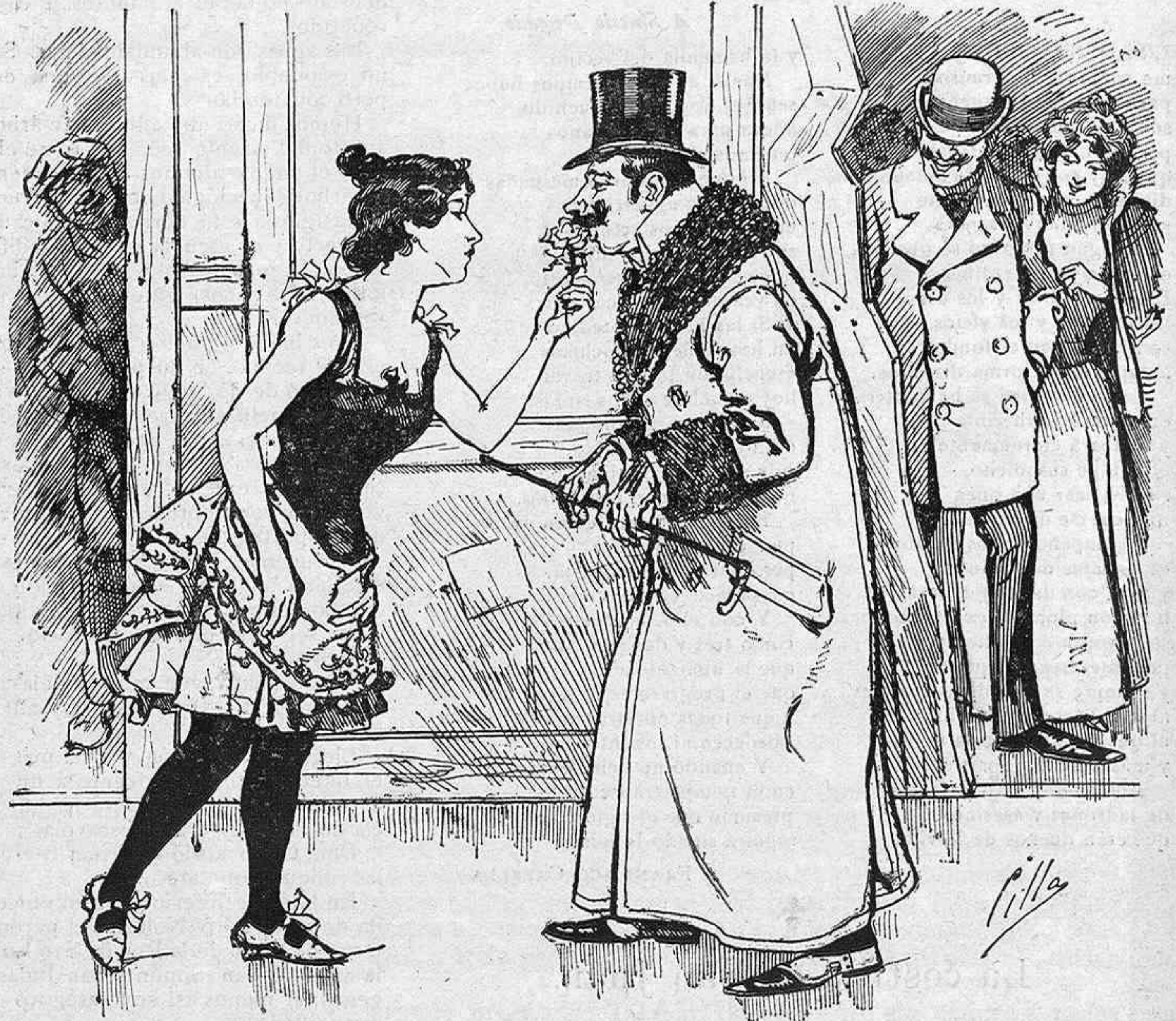
Un dúo de amores de tenor y dama, entre bastidores. (Fuera de programa.)

Mucho estimó Santiago la franqueza del respetable cura, y de tal modo se encariñó con él, que no dejó de cumplir ninguno de sus buenos consejos, incluso el de quedarse á vivir en Valdecarámbanos,