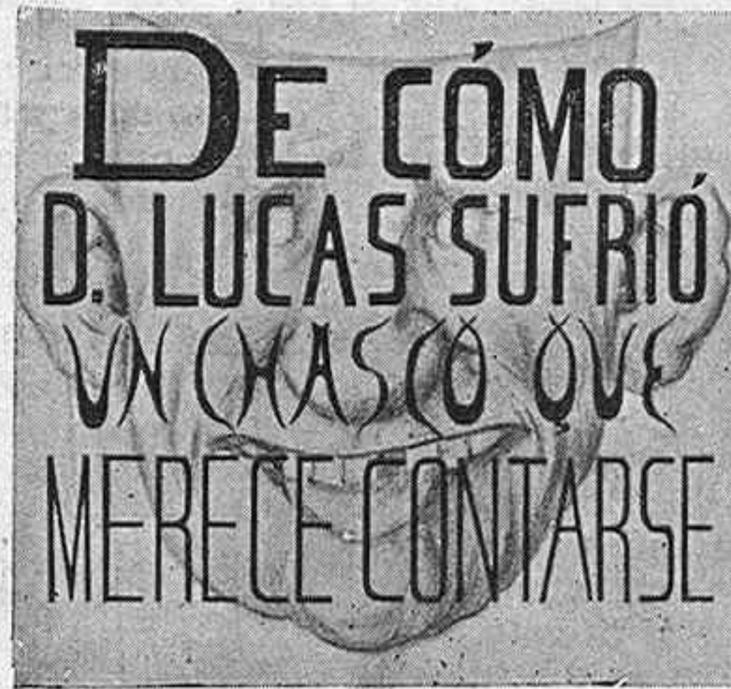
(Historieta por Verdugo Landi.)