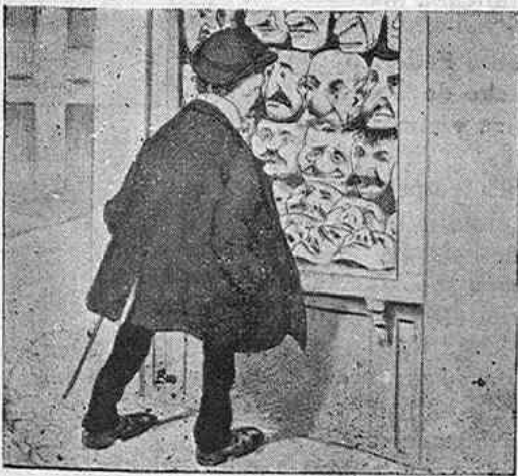
3.—Esa del centro, de la nariz gorda y los bigotes blancos, me parece bien.