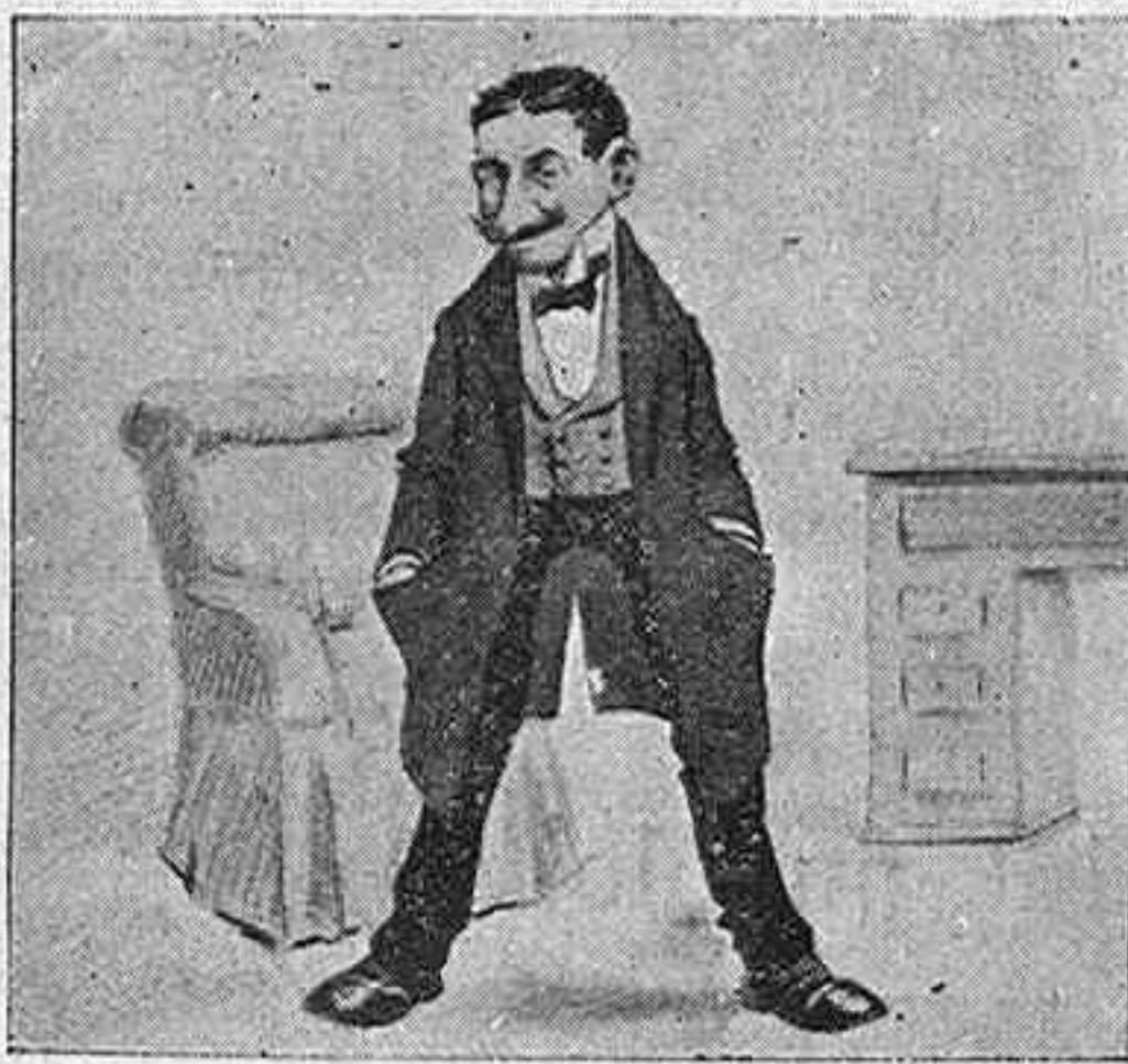
1.—Voy á comprarme una careta para dar una broma esta noche en el baile.