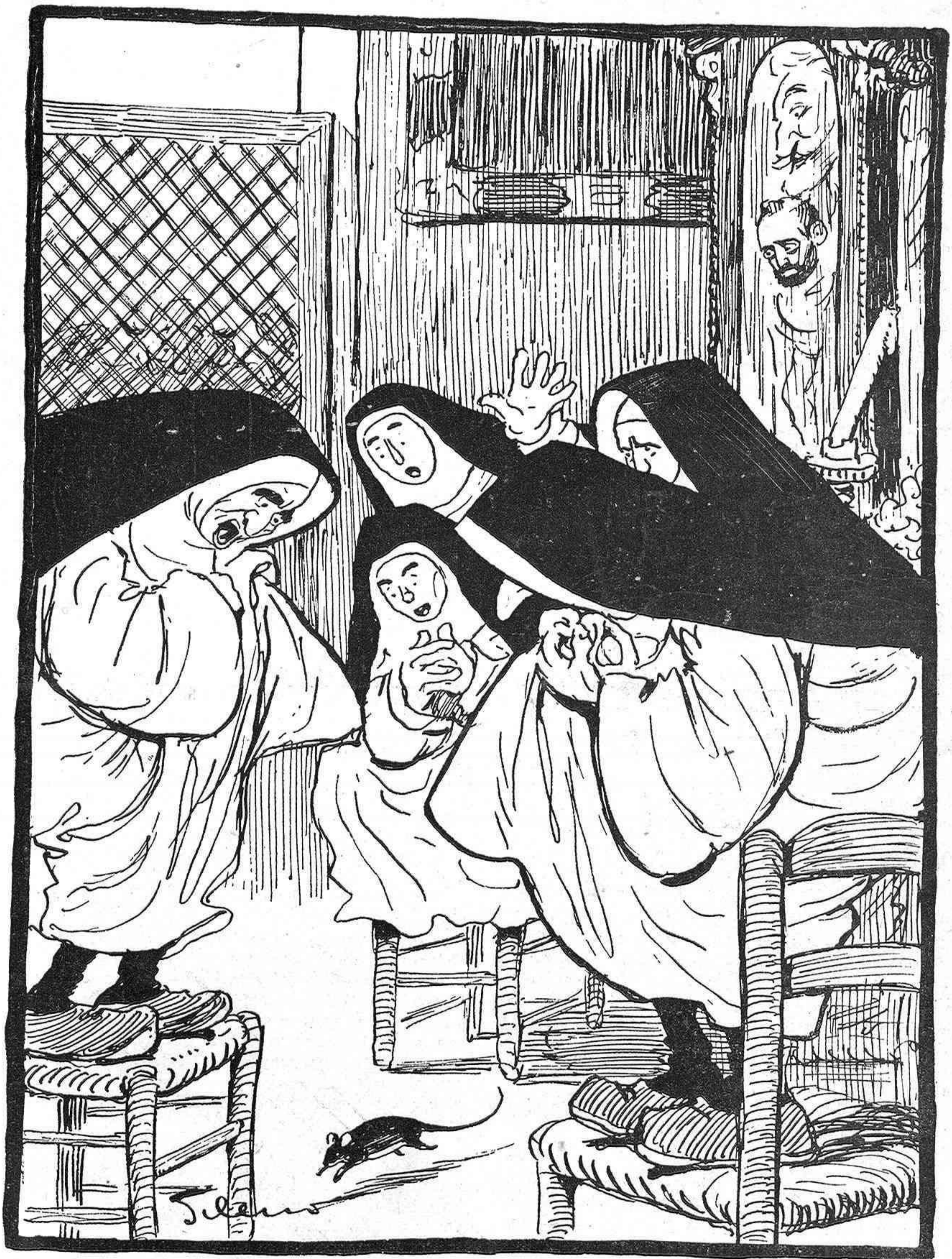
PÁNICO EN LAS ADORATRICES... DE MAURA ¡HUUUUUY! ¡SÁLVESE LA QUE PUEDA, QUE VIENE UN «RATÓN PELAO»!