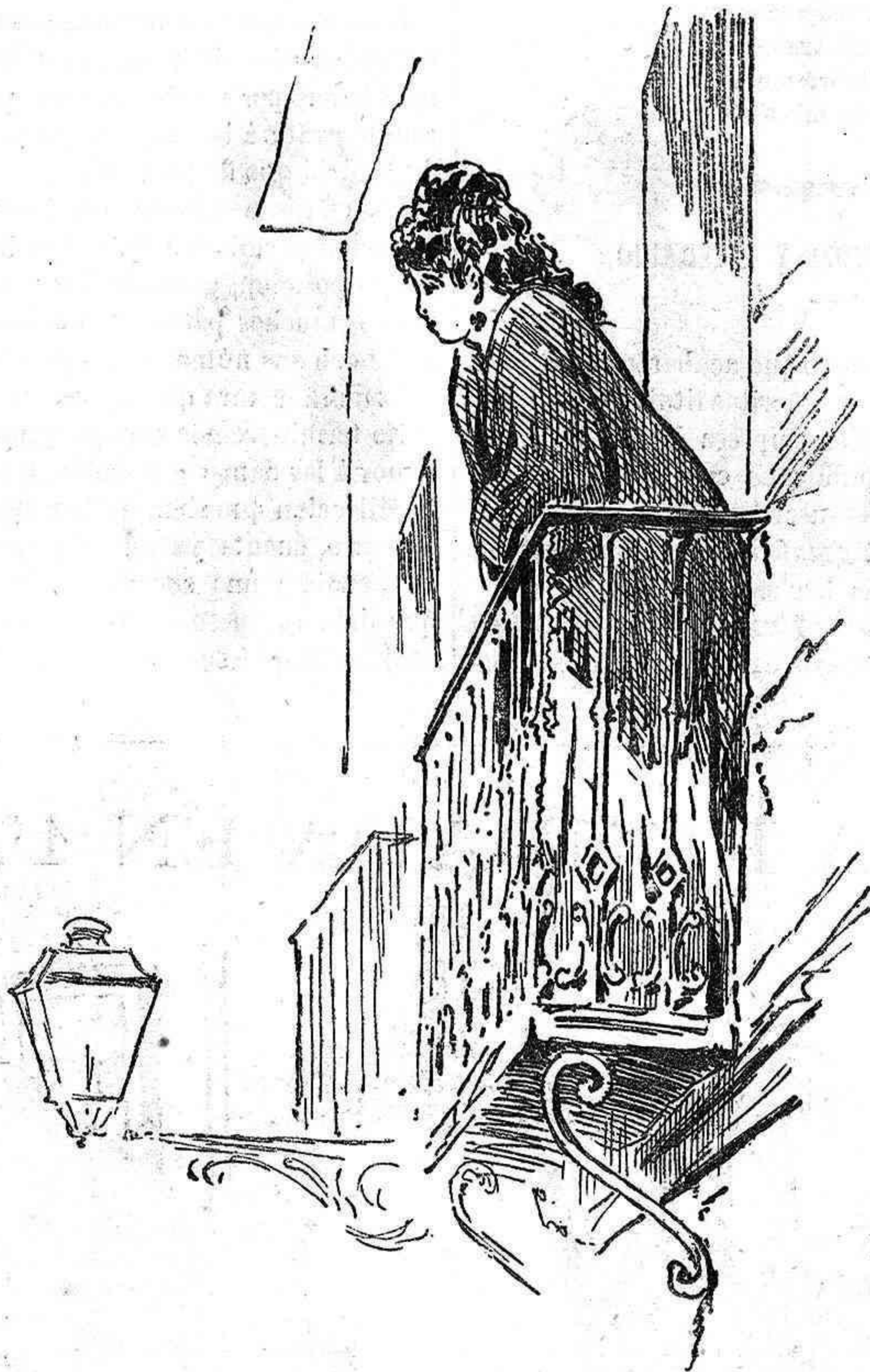
En varias calles y á todas horas.

—¡Ah! ¿Es Vd. el conde de.....? ¡Pues eso ya es diferente! Tome Vd. dos asientos.