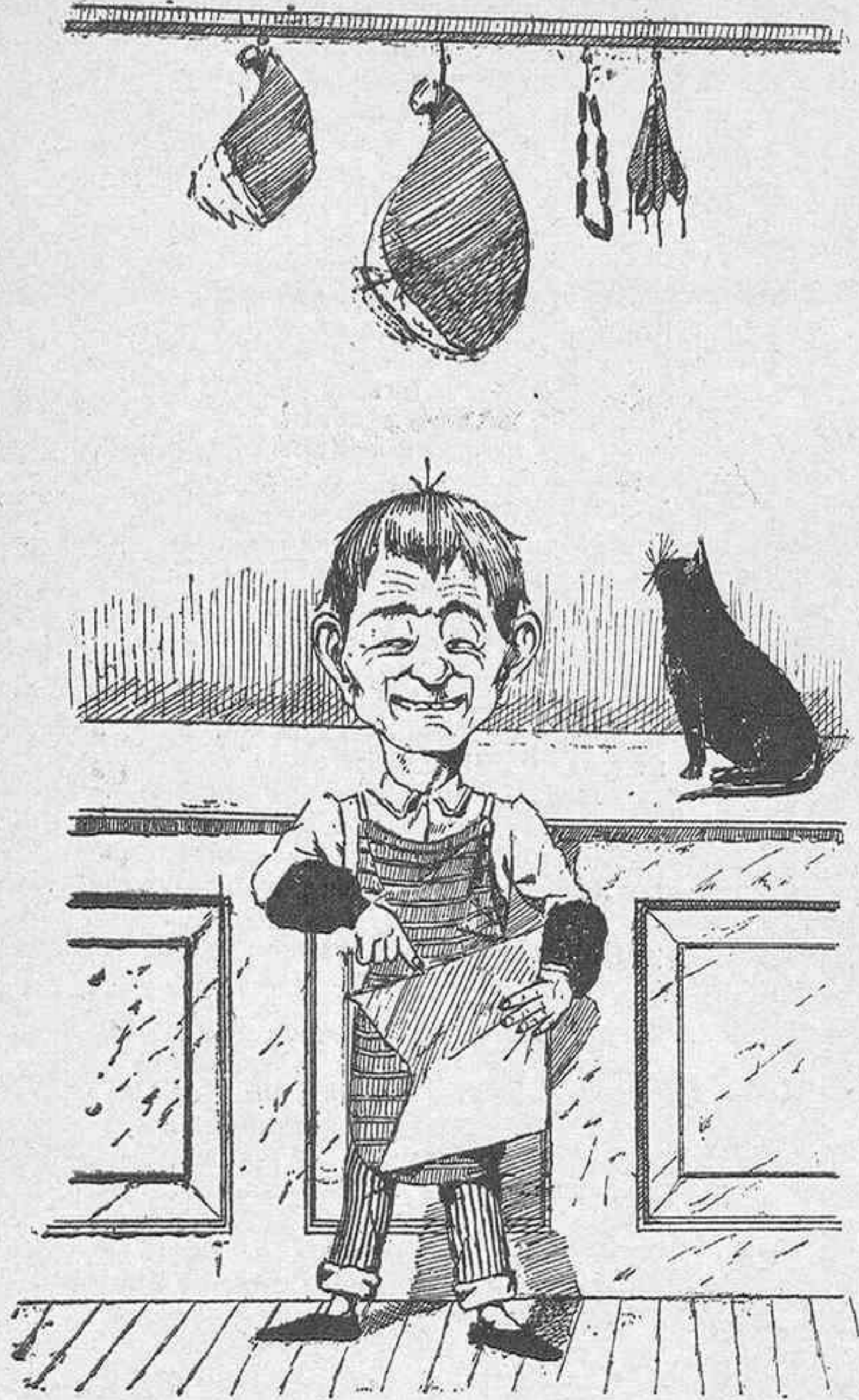
Hoy me ha debido caer.