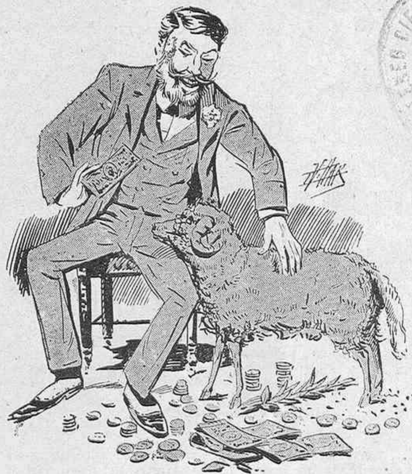
Después del estreno.