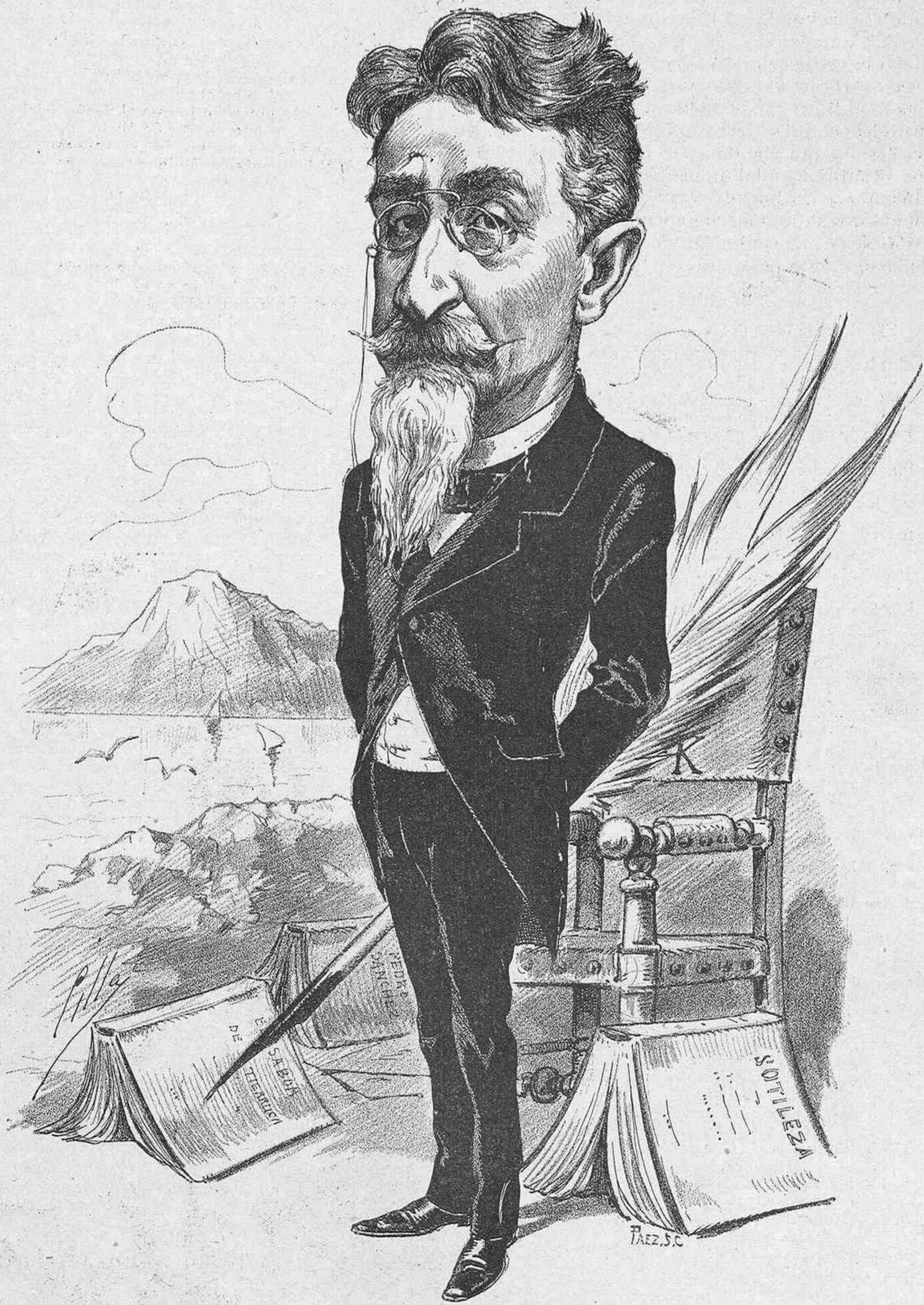
José María de Pereda.