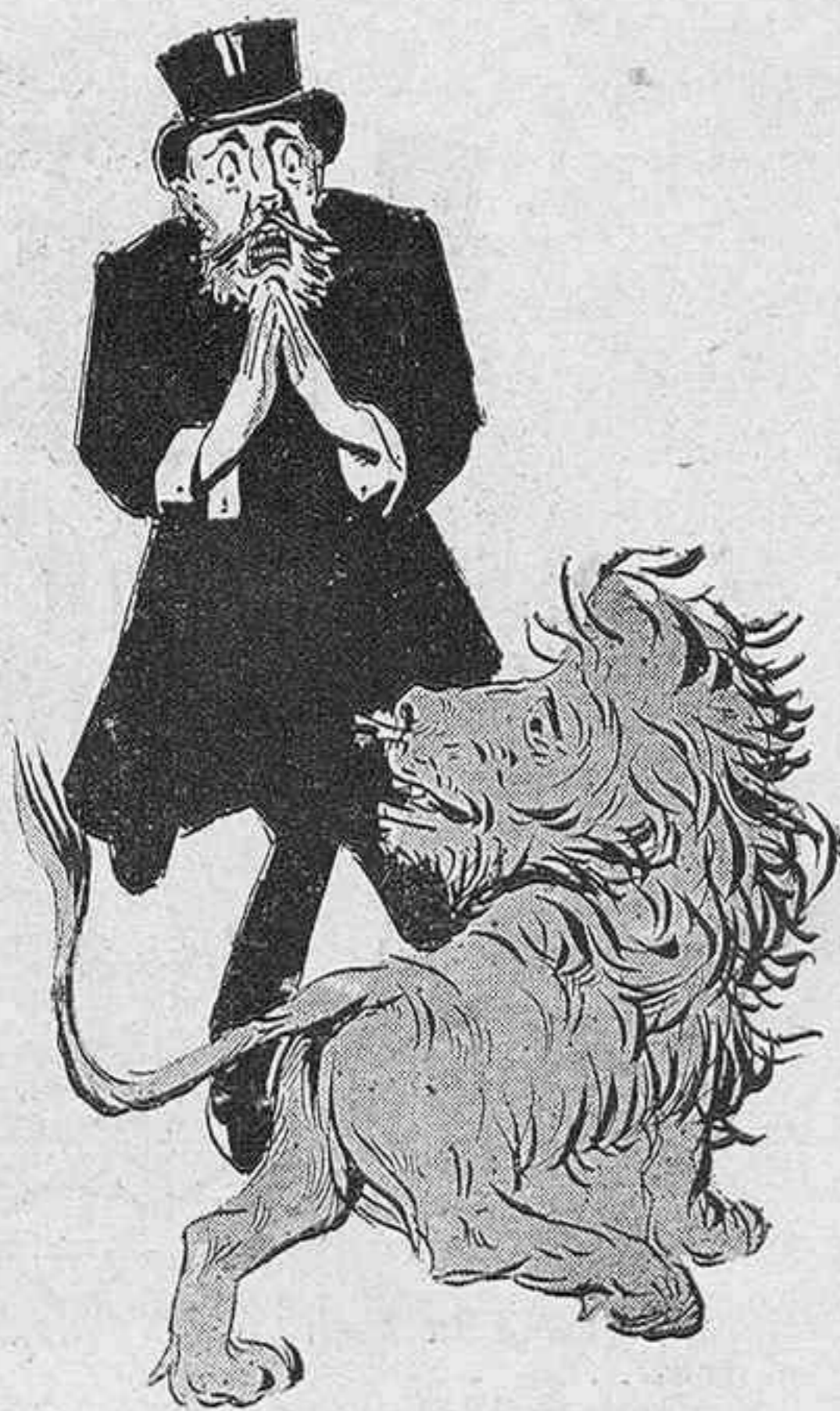
Durante el estreno.