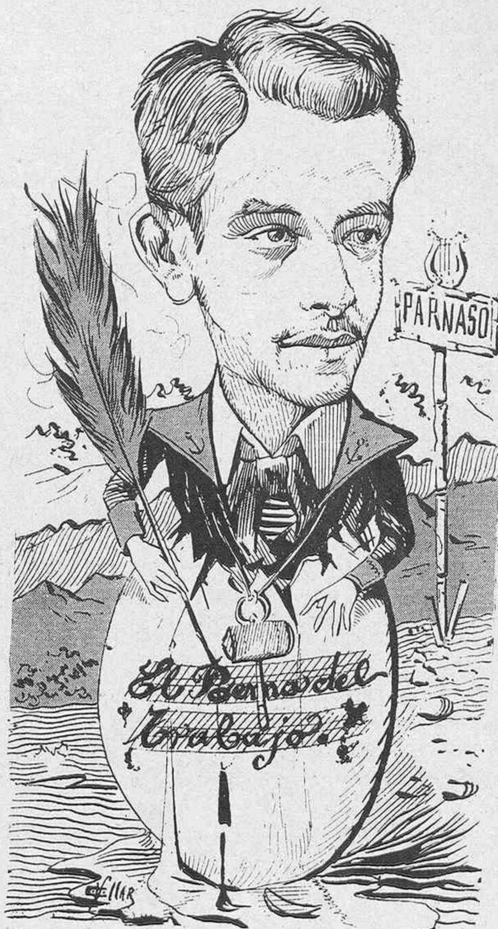
G. Martínez Sierra.