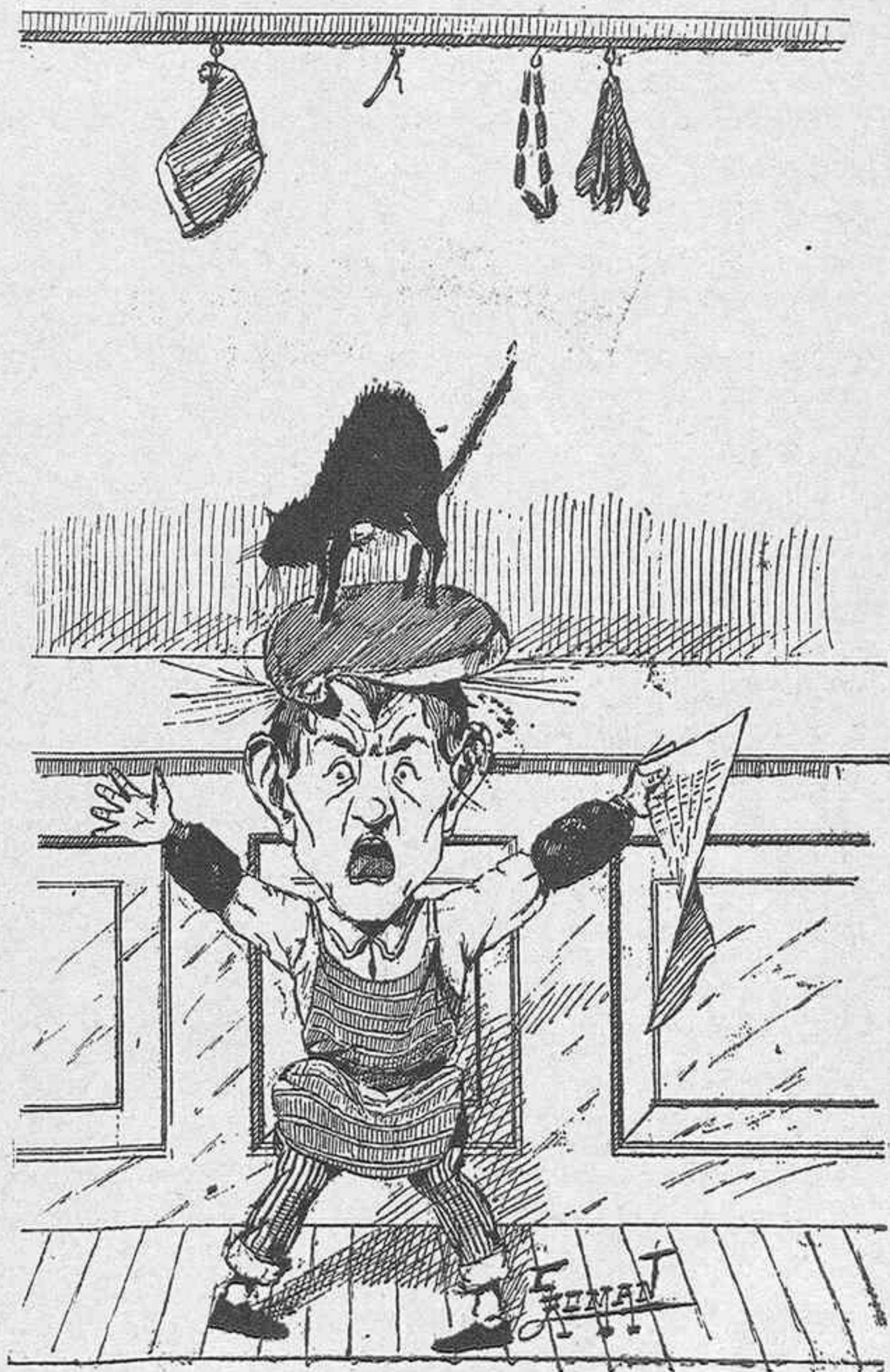
¡¡¡El gordo!!! ¡bien dije yo!