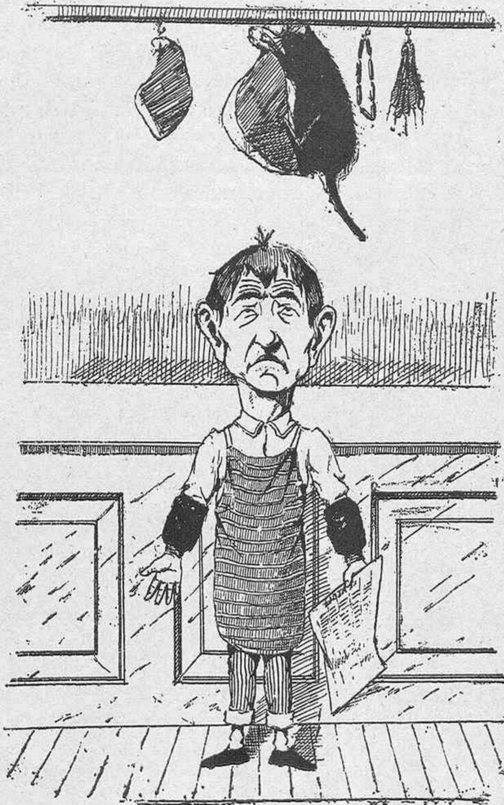
Ni el chico, ¡tocó perder!