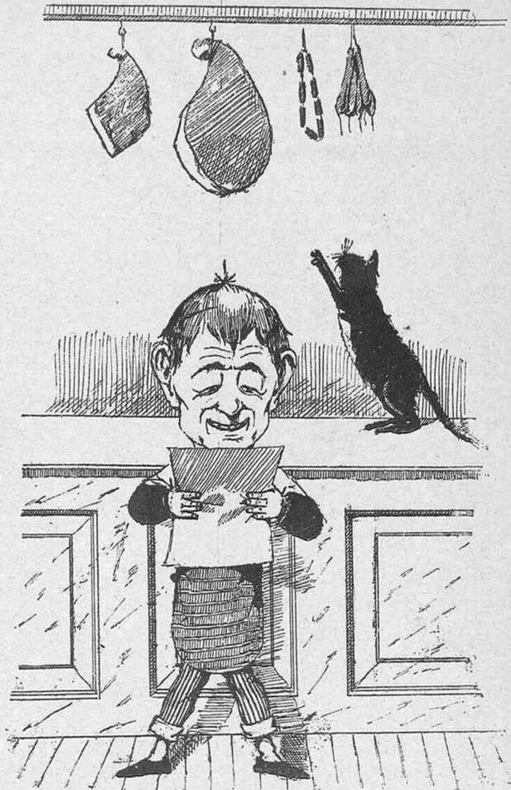
Nada pues el gordo nó.