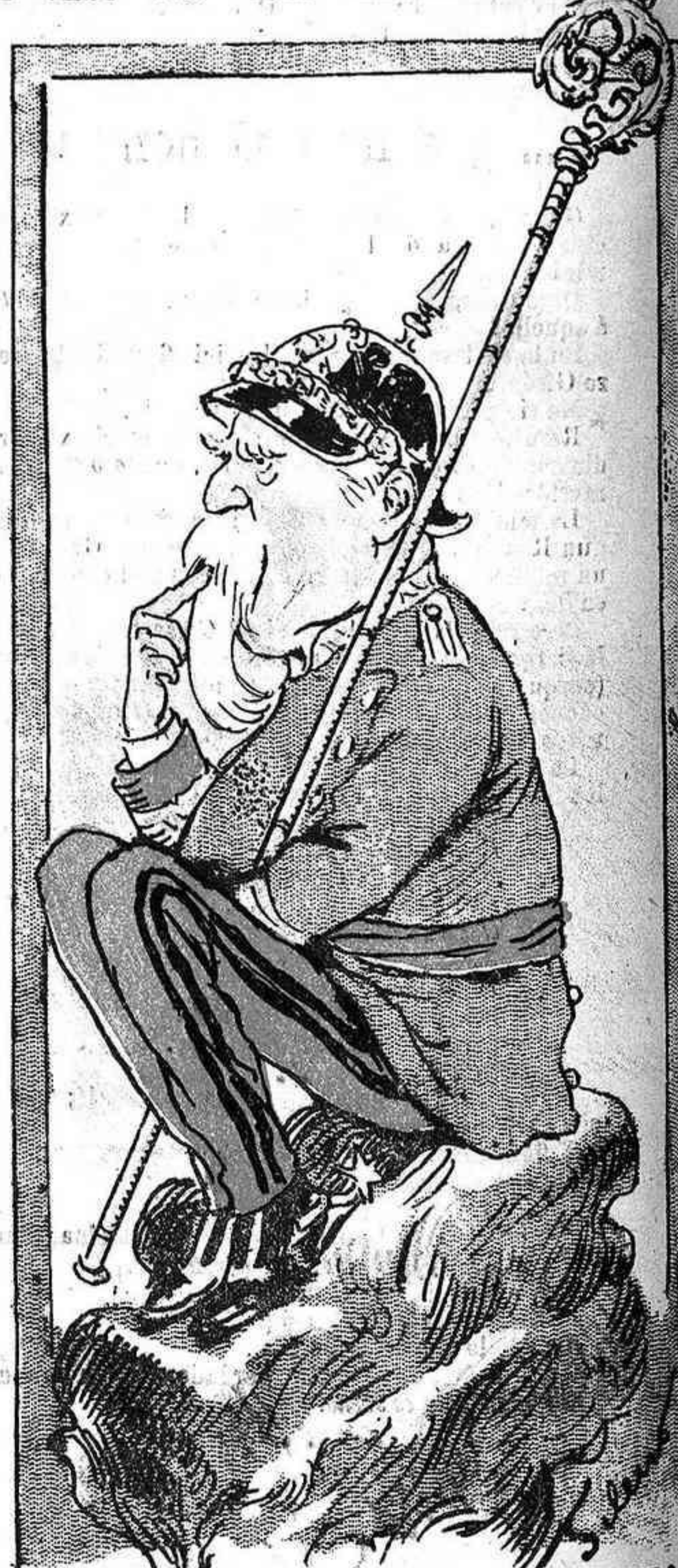
Y SU EMINENCIA NO SE HA MOVIDO DEL LIMBO