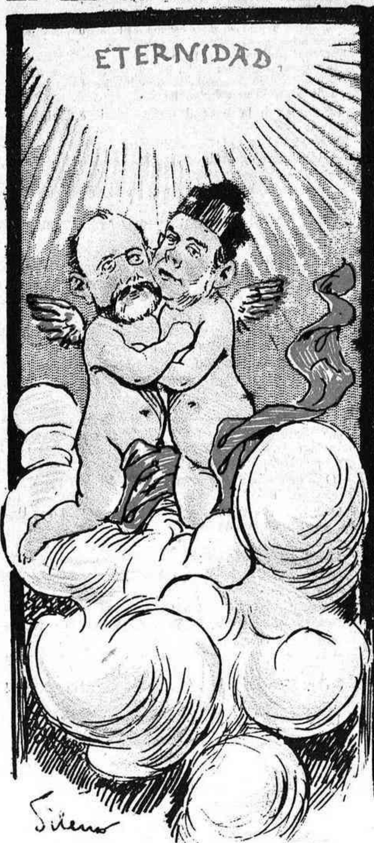
ANGELITOS AL CIELO