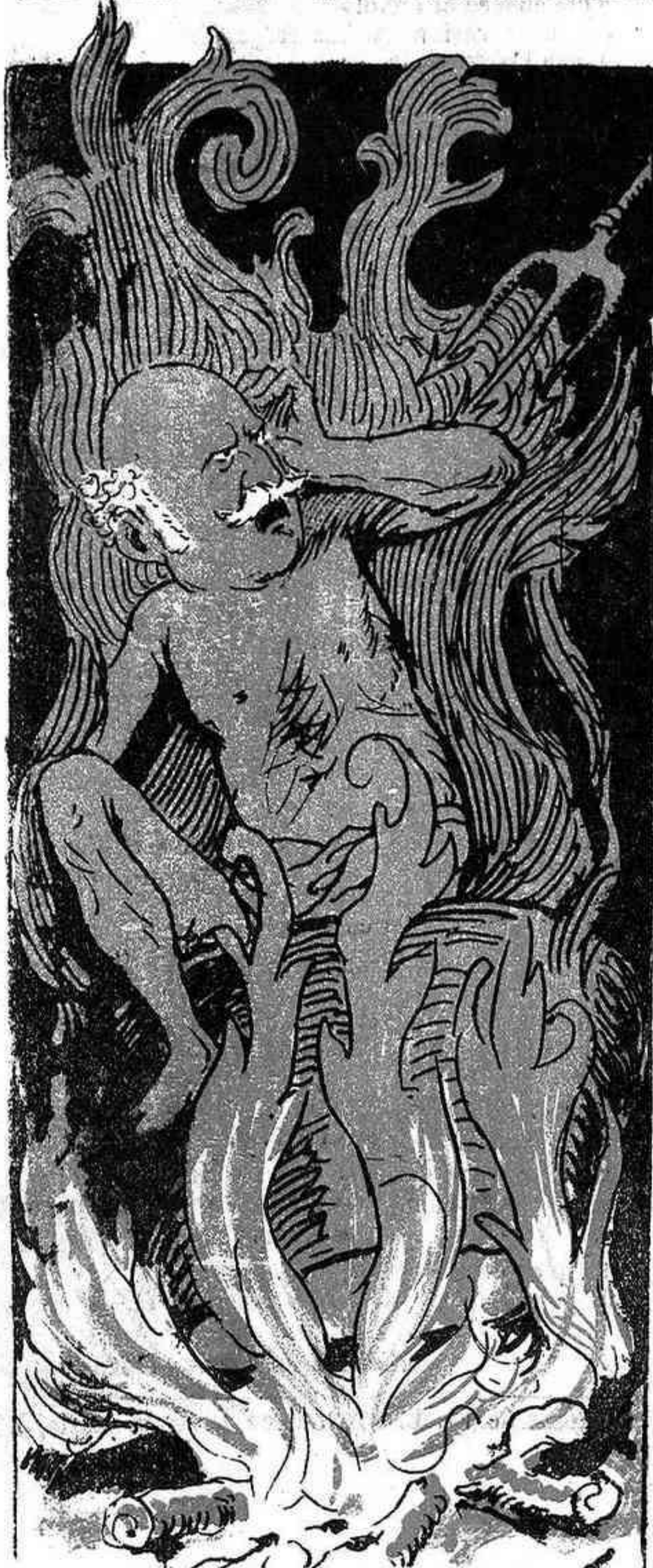
REPROBOS AL INFIERNO