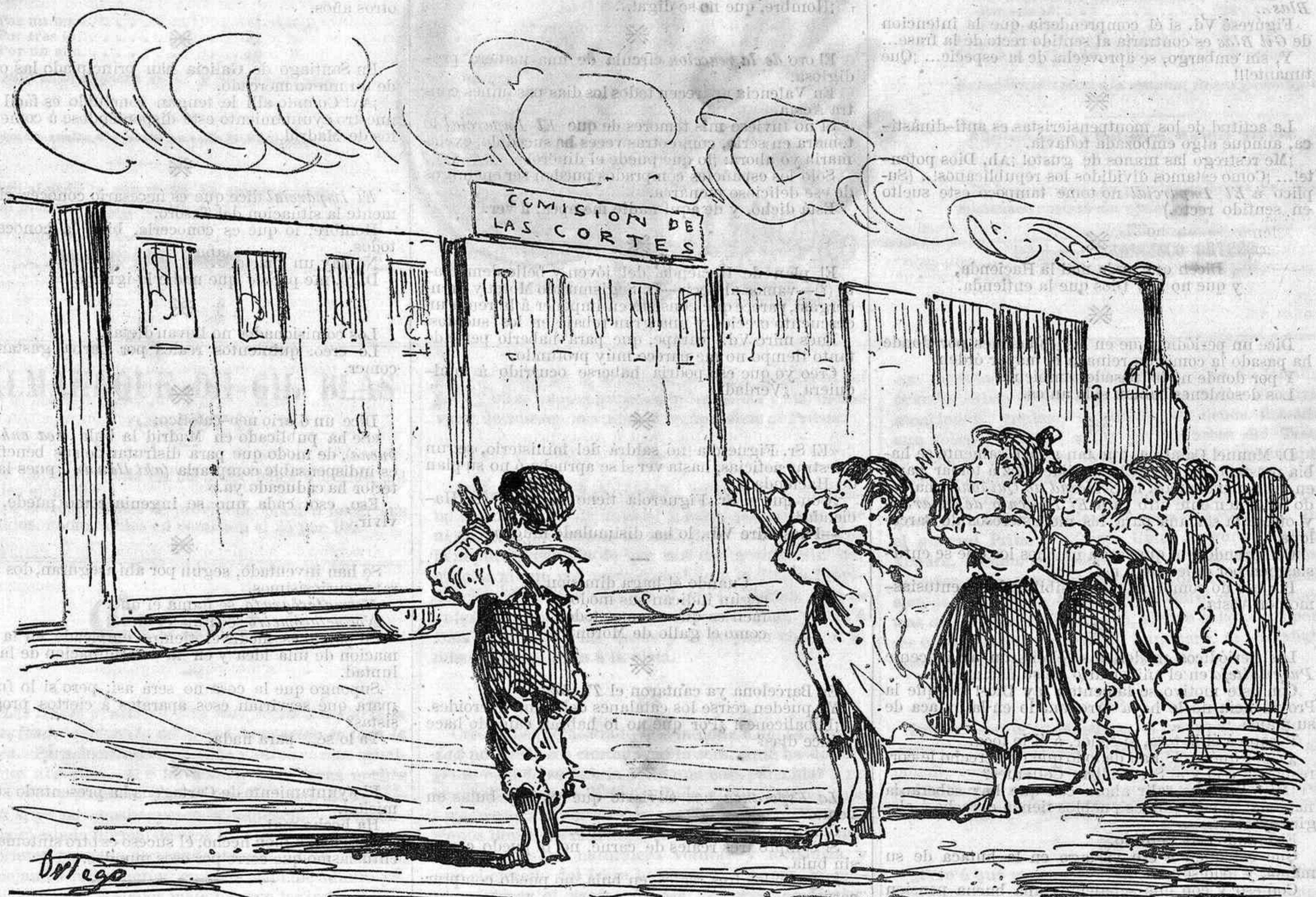
Demostraciones de júbilo y entusiasmo en los pueblos del tránsito.

Y se desengañarán los ilusos y cobrarán las clases pasivas, que sin rey no encontrarán medio de que se les devuelva su dinero.