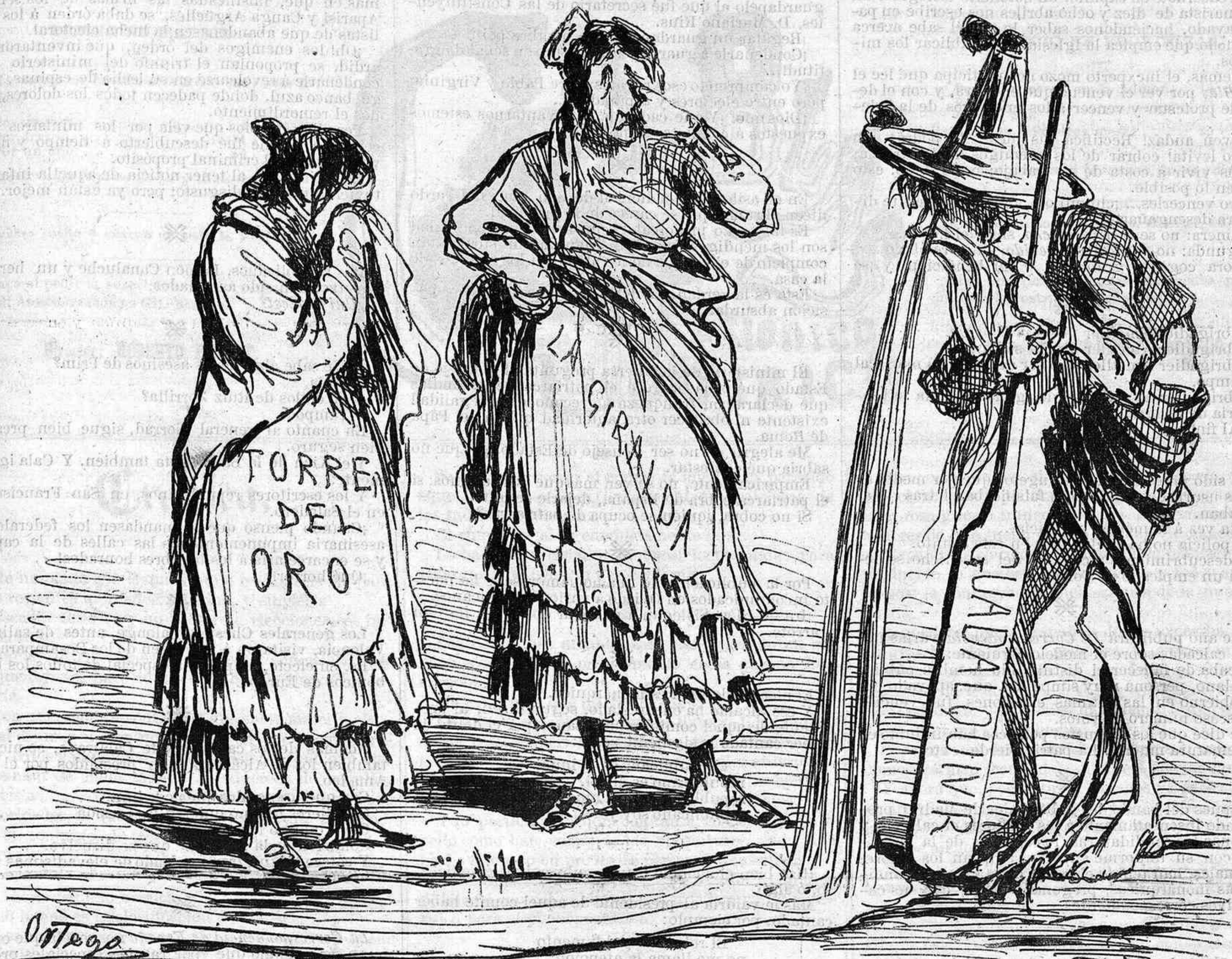
Los tres personajes más principales de Sevilla que tomaron parte en el sentimiento general demostrado por TODOS los partidos.