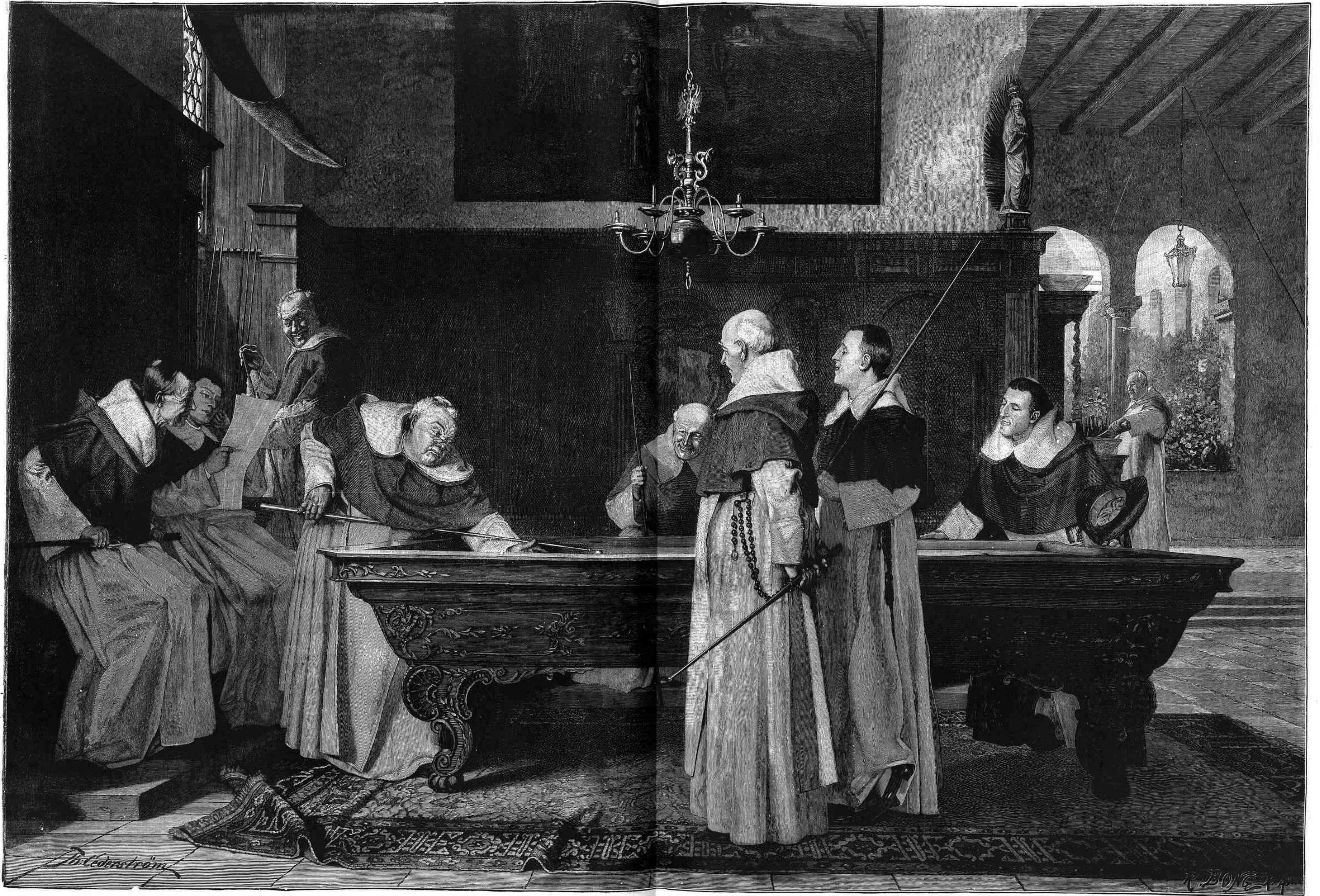
¡ANIMO, COMPAÑERO! CUADRO DE TH. CEDERSTROM