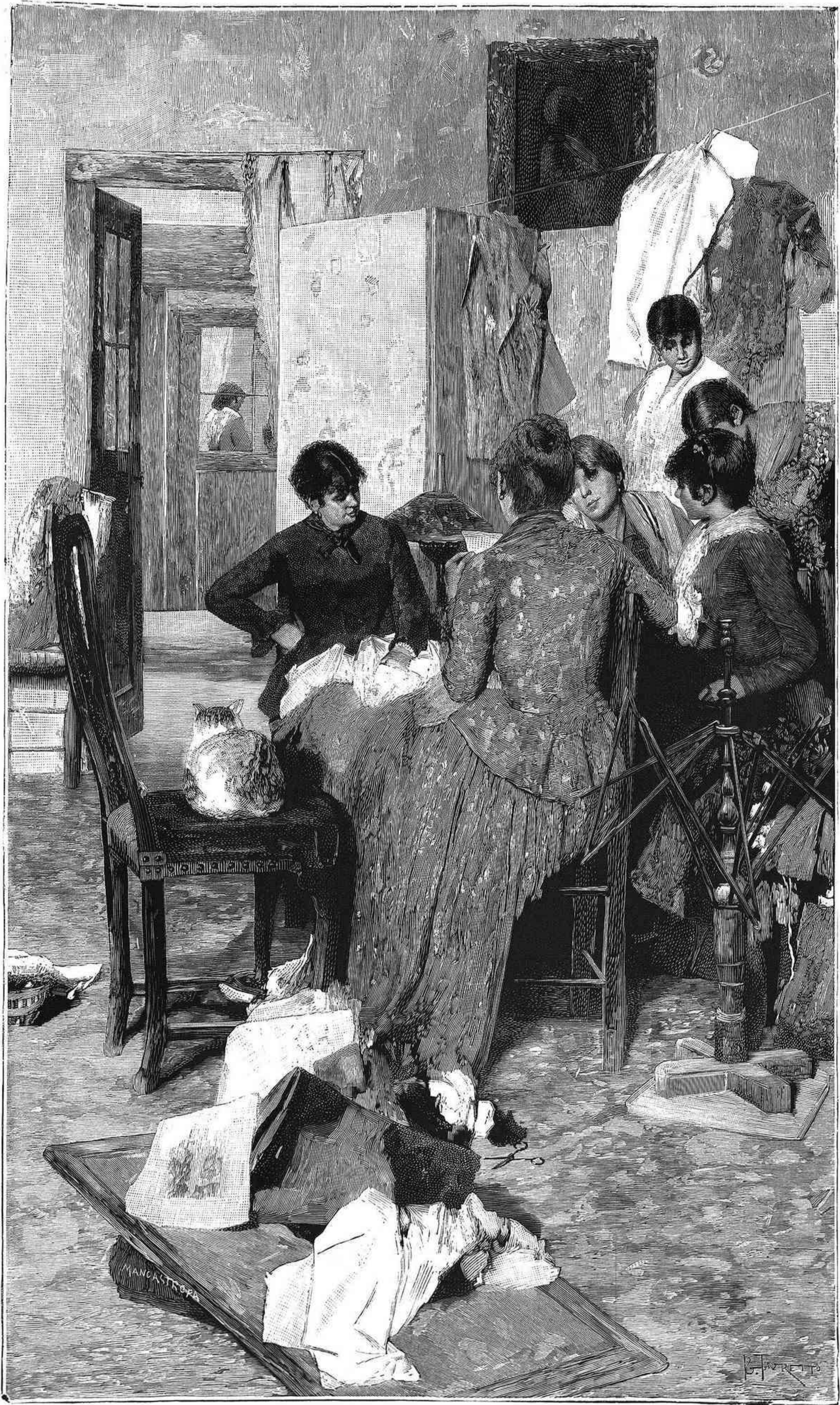
EMPIEZA ASÍ: AMOR MÍO... cuadro de J. Favretto