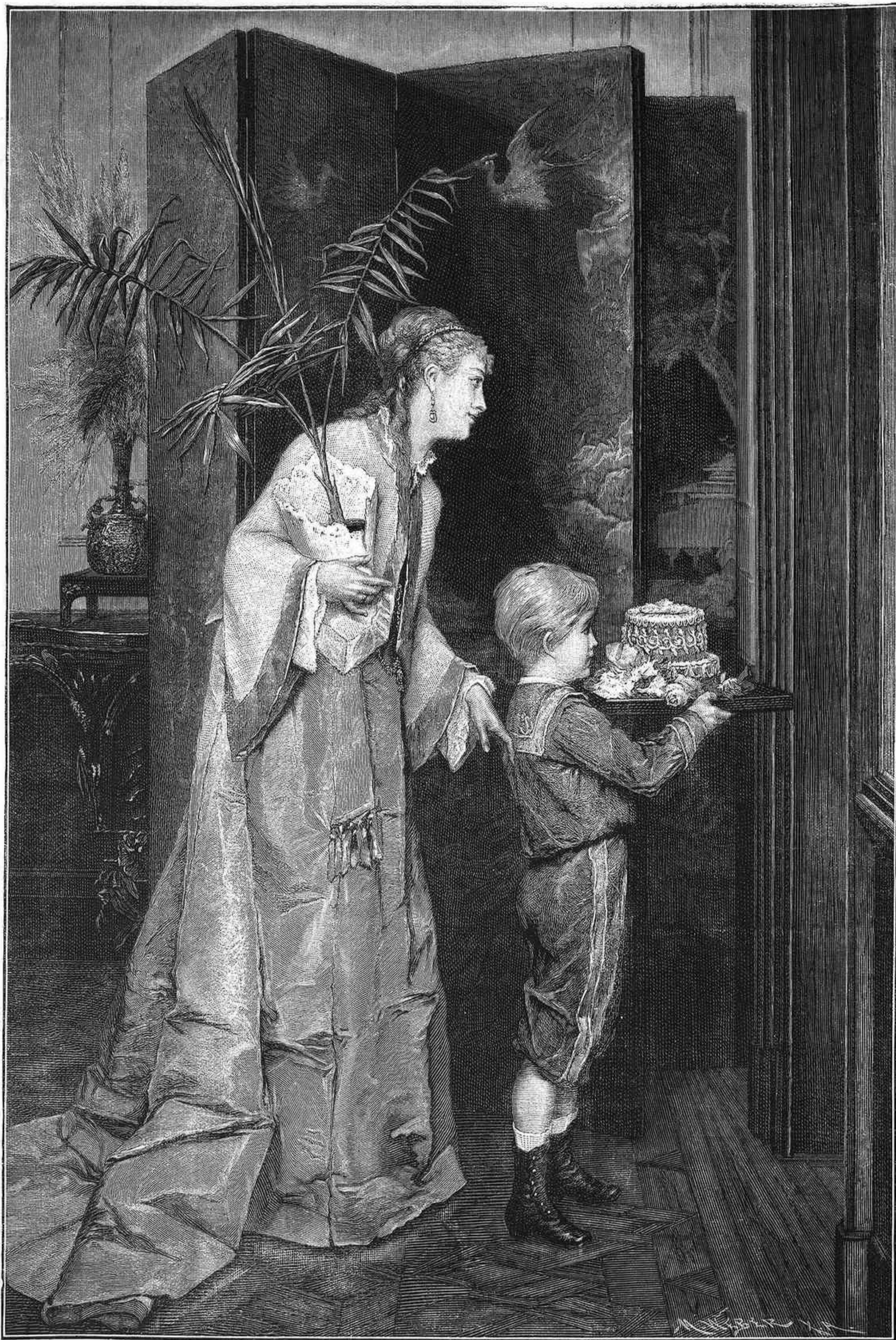
EL SANTO DE PAPÁ, cuadro de Francisco Verhas

—¿Qué importa eso? Ya lo sabrá V.—No cabe duda de que el beneficio es cierto, pues la letra de cuatro mil