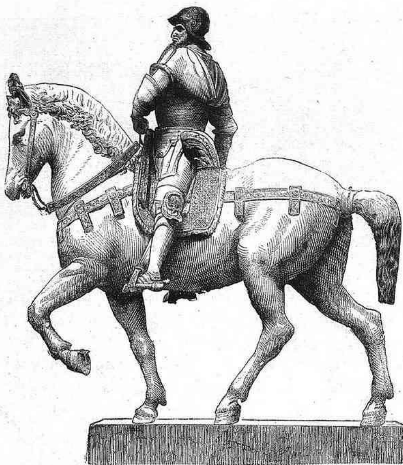
COLLEONI, estatua ecuestre en bronce por Verrocchio y Leopardi

17 diciembre. — Se ha convenido que iríamos á buscar á M. Schuck para dirigirnos después á Maibun; ayer fuimos, y al llegar á su casa no la reconocíamos ya, pues desde la víspera había sufrido una transformación completa; las galerías y las escaleras se han suprimido; la caseta está circuida de una sólida empalizada de estacas y de bambúes; y es que la noche anterior, á eso de las doce, la casa ha sido asaltada de improviso por una cuadrilla de merodeadores. M. Schuck, despertando sobresaltado, ha muerto á cuchilladas á uno de los agresores, que había penetrado ya en su habitación, y consiguiéndose con esto una tregua, se ha podido atrancar puertas y ventanas para sostener un sitio en regla, al estilo de Joló. El tejado de nipa se ha cubierto de flechas inflamadas, pero muy húmedo aun por una reciente lluvia, no se ha encendido. M. Schuck disparaba al acaso, y cuando al fin amaneció, dispersáronse los sitiadores, dejando tres muertos y un herido: era éste un hombre de formas atléticas, que una fractura del fémur le había dejado inmóvil, echado en un rincón, y allí esperaba flemáticamente su muerte de la cual decidirá-