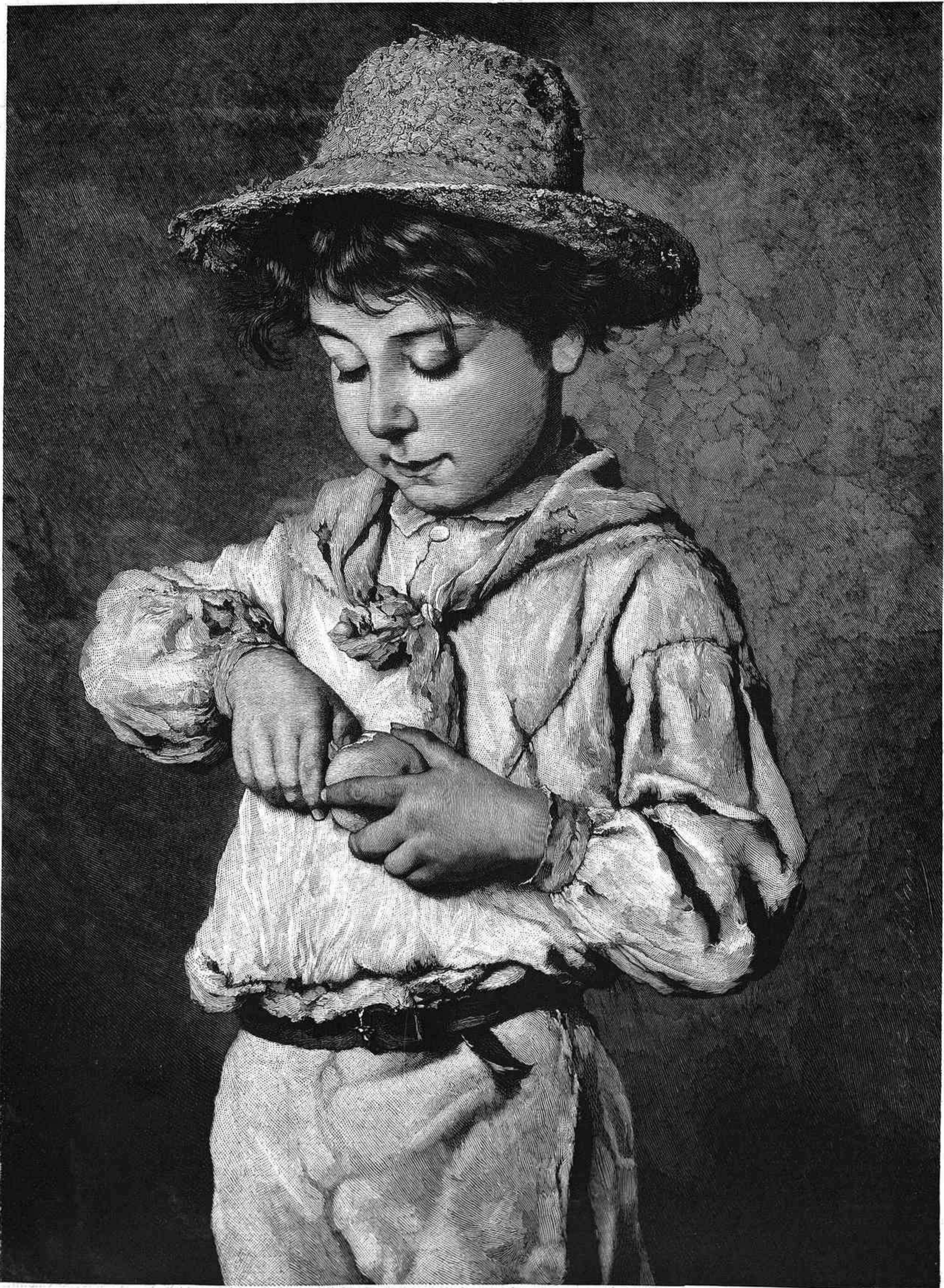
JOAQUINITO, cuadro de Eugenio Ritter de Blas

REGALO Á LOS SEÑORES SUSCRITORES DE LA BIBLIOTECA UNIVERSAL ILUSTRADA