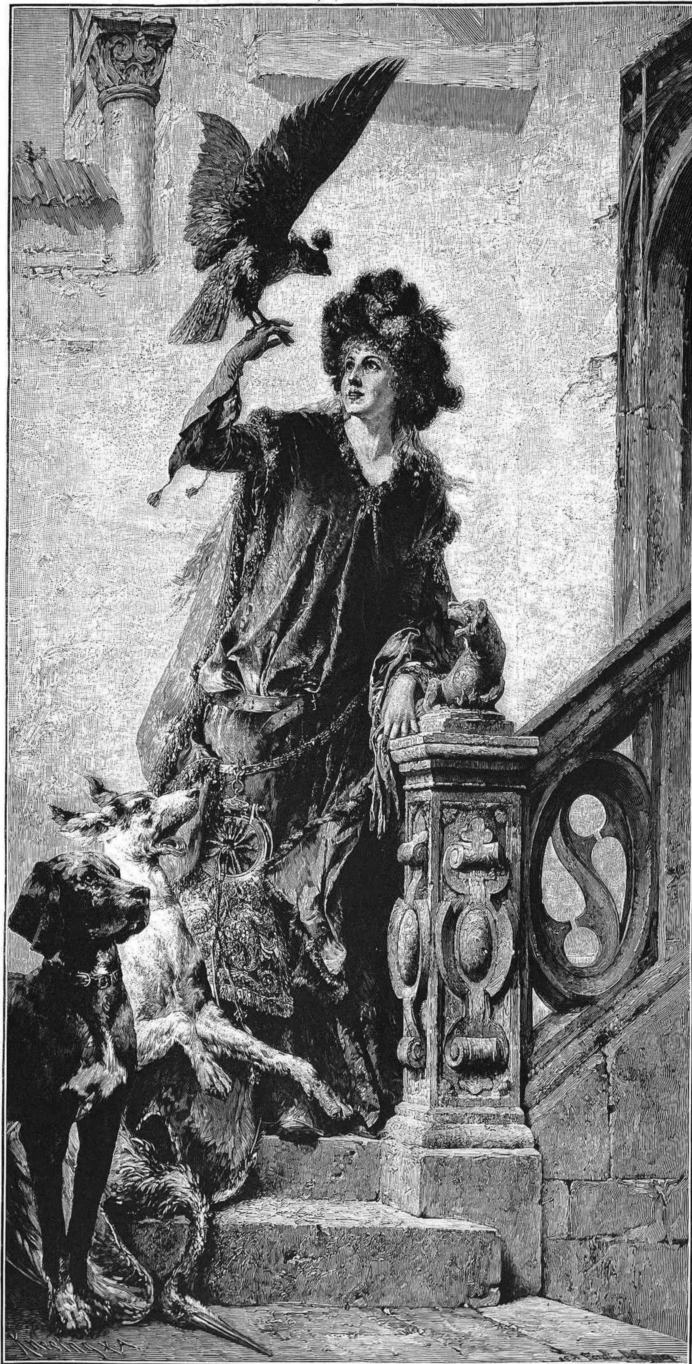
CAZADORA CON HALCÓN, cuadro de Fernando Wagner