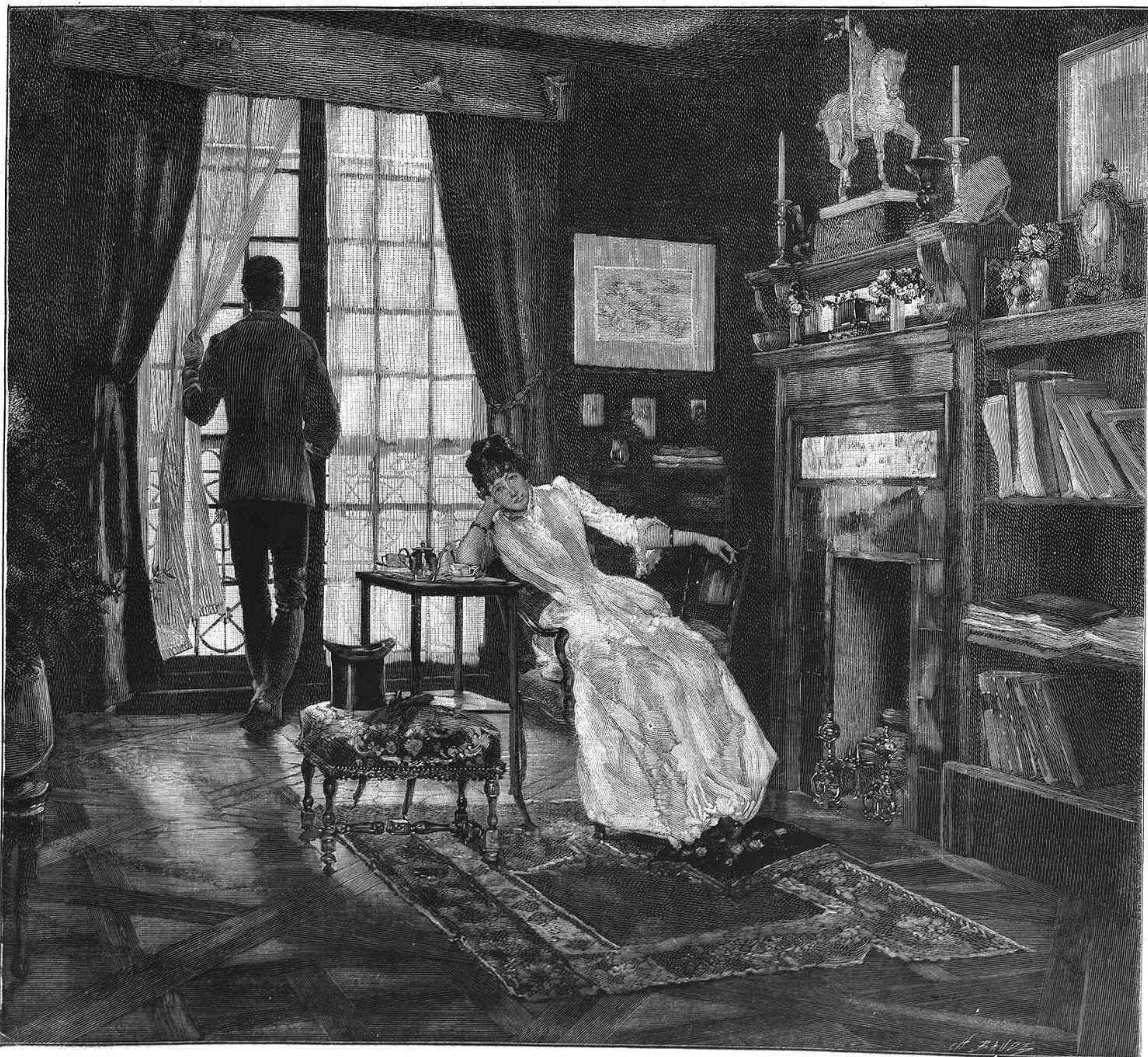
NUBLADO, cuadro de Roger-Jourdain

Después de franquear el último arroyo penetramos en una extensa pradera, donde resuenan detonaciones á intervalos iguales: estamos en el polígono del sultán, que siempre se entretiene en tirar al blanco por la tarde. Su palacio, inmensa construcción rústica de cañas y de nipa,