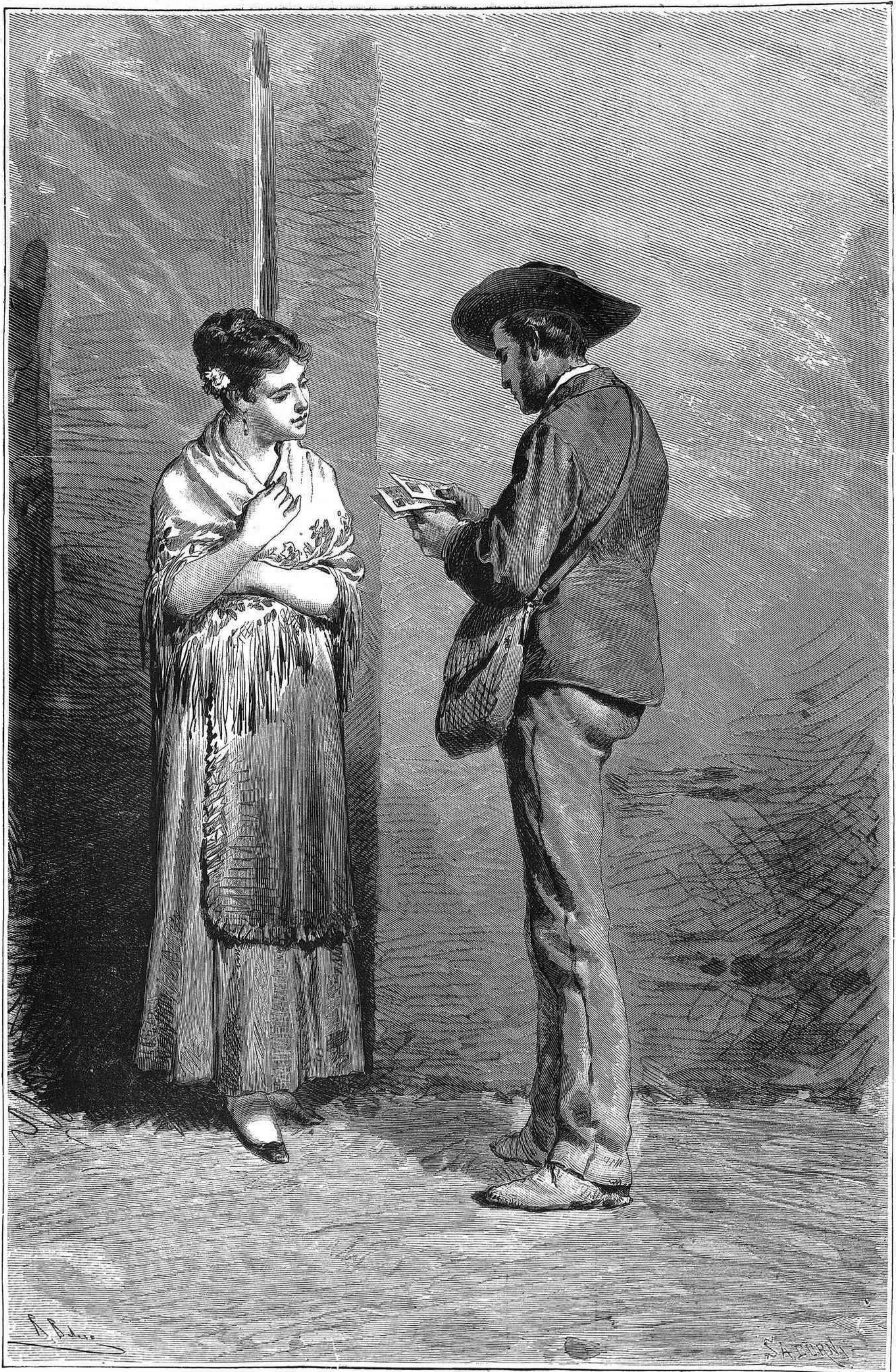
YA TIENES CARTA.... dibujo por Ricardo Balaca