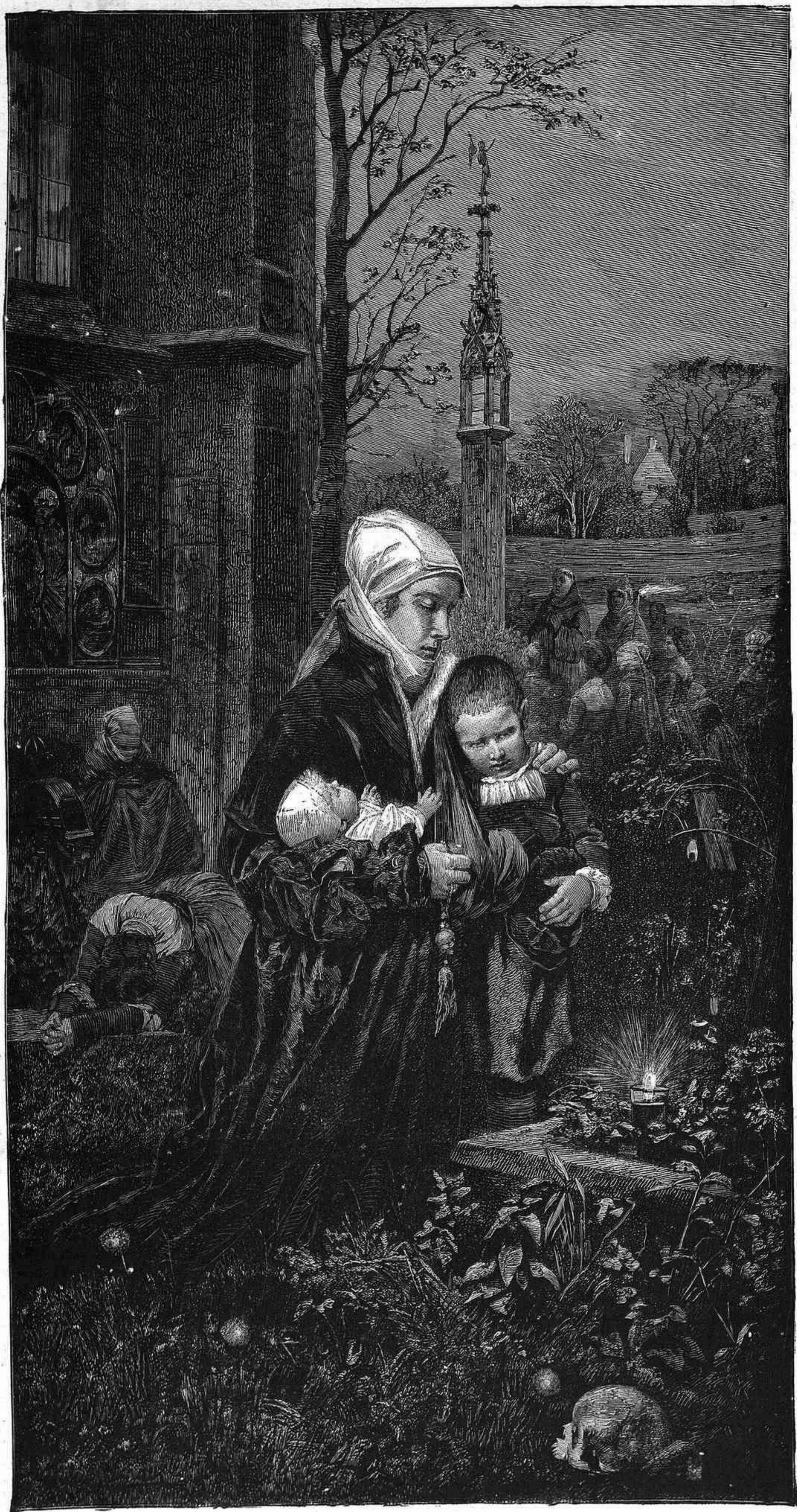
LA TUMBA DEL SÉR QUERIDO, cuadro por Julio Berger