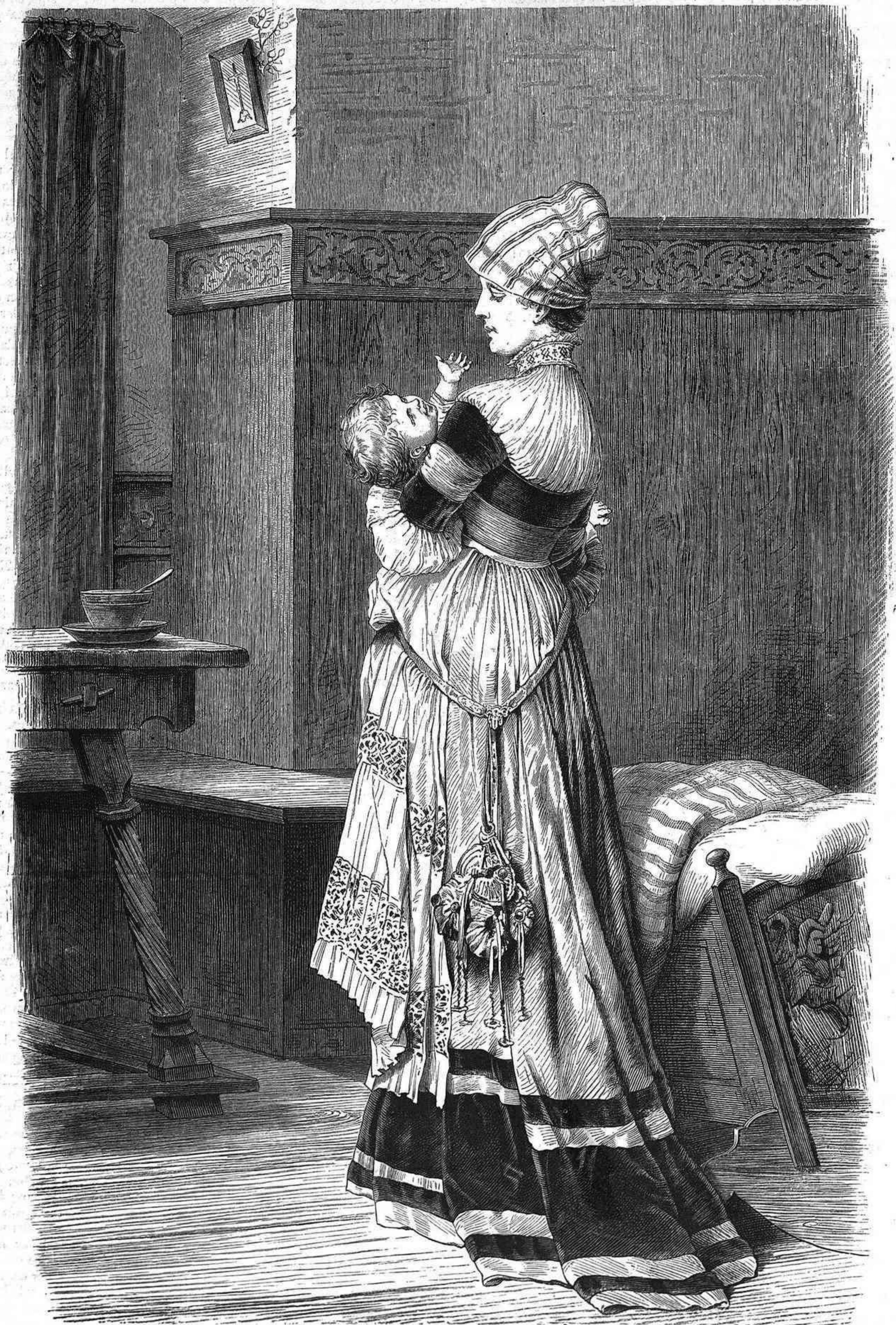
LA MATERNIDAD, cuadro por Roberto Begschlag