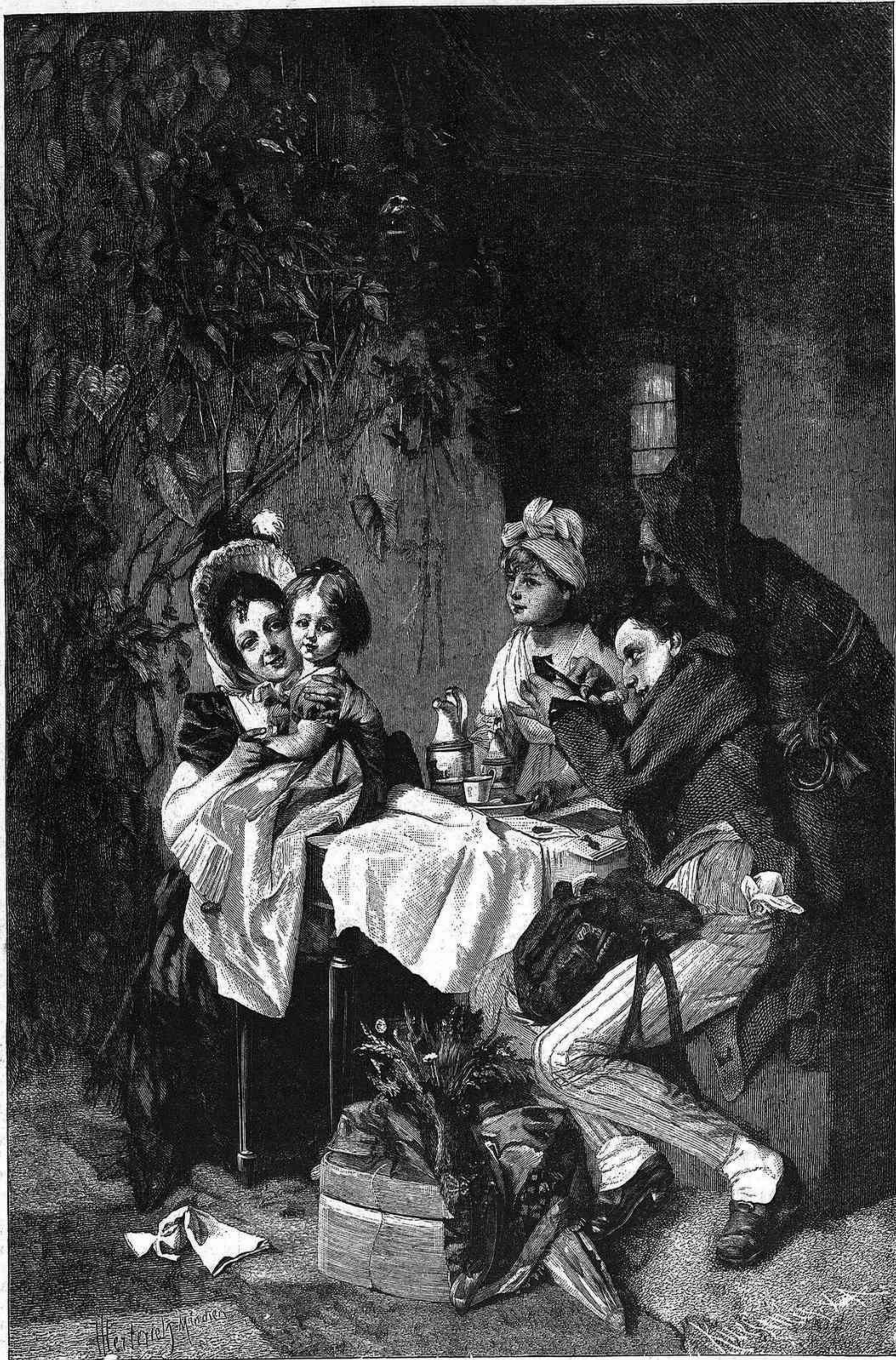
LA SILUETA, cuadro por J. Herterich

Pero ya está arriba á 3,000 ó 4,000 metros sobre el suelo: pues cesa la circulacion del vapor; á la caldera vuelve para que no se pierda; el gas que habia llegado, pongo por caso á 50°, comienza á enfriarse y á contraerse cediendo espacio á las vejigas, y todo el mecanismo comienza á caer; aprovechándose si se quiere esta caída para que circule el aire relativamente frio de la atmósfera por los tubos por donde ántes circulaba vapor y para que se pre-