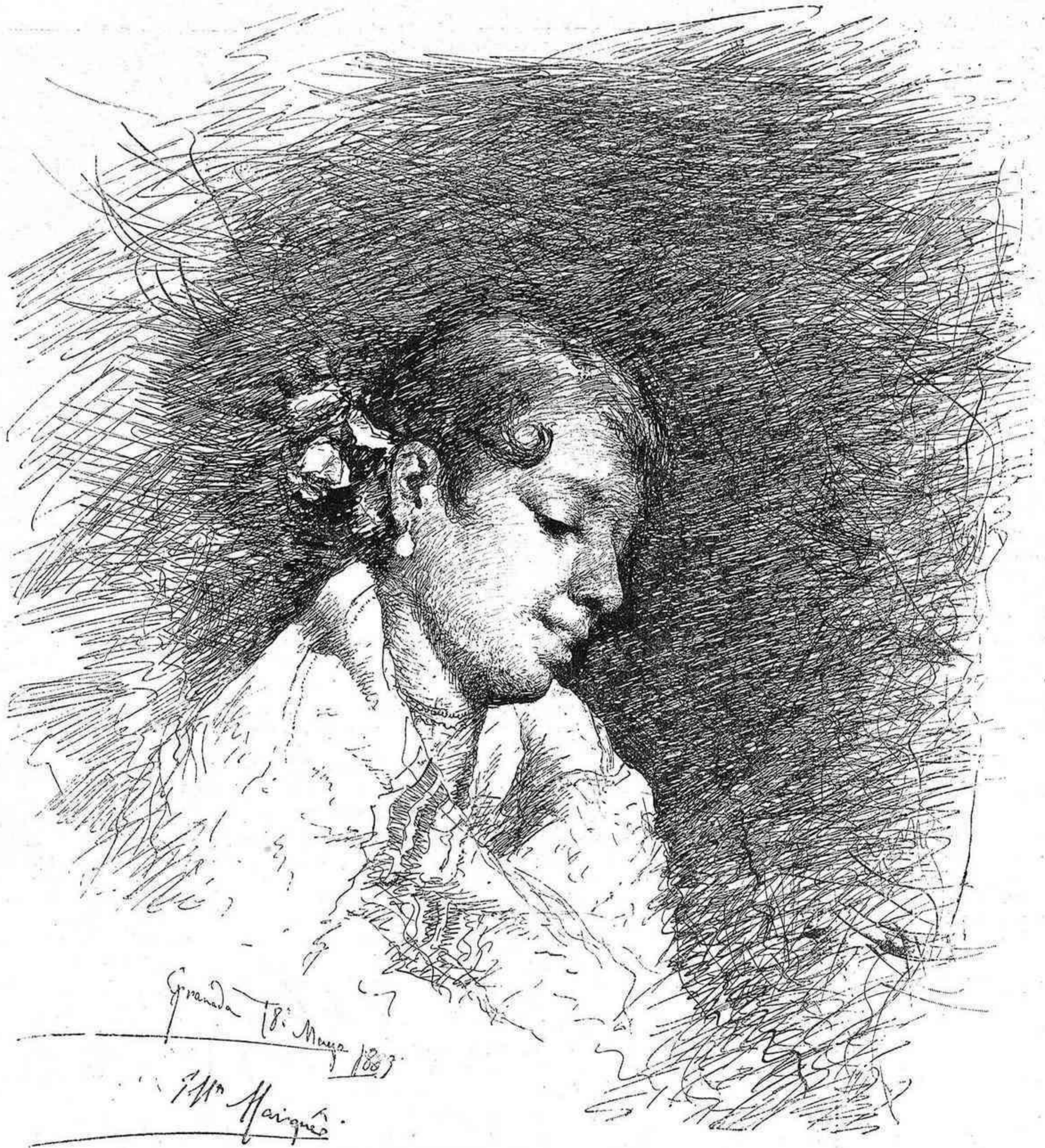
TIPO GRANADINO, dibujo por J. Marqués