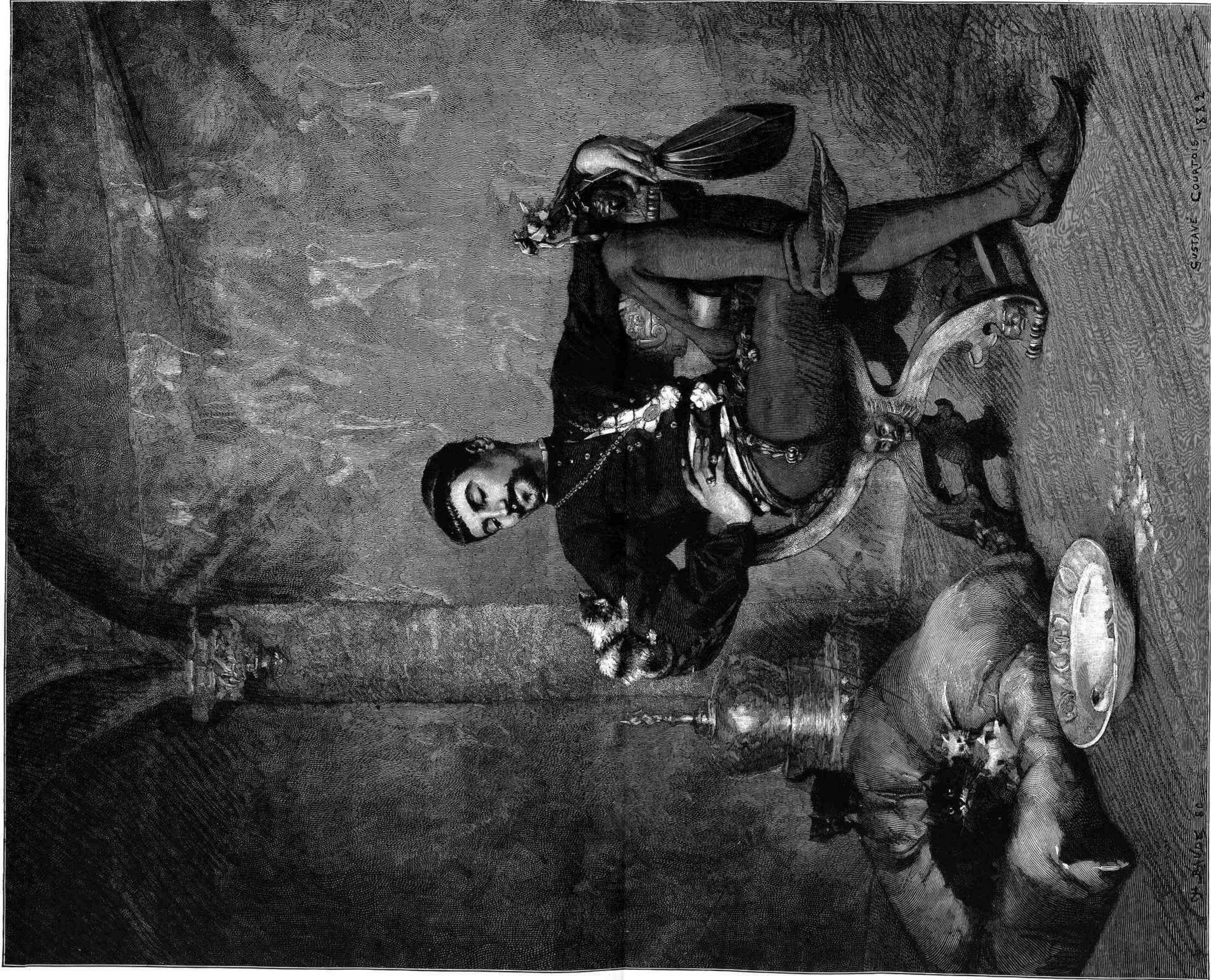
JOVEN FLORENTINO JUGANDO CON UNOS GATOS, CUADRO POR GUSTAVO COURTOIS