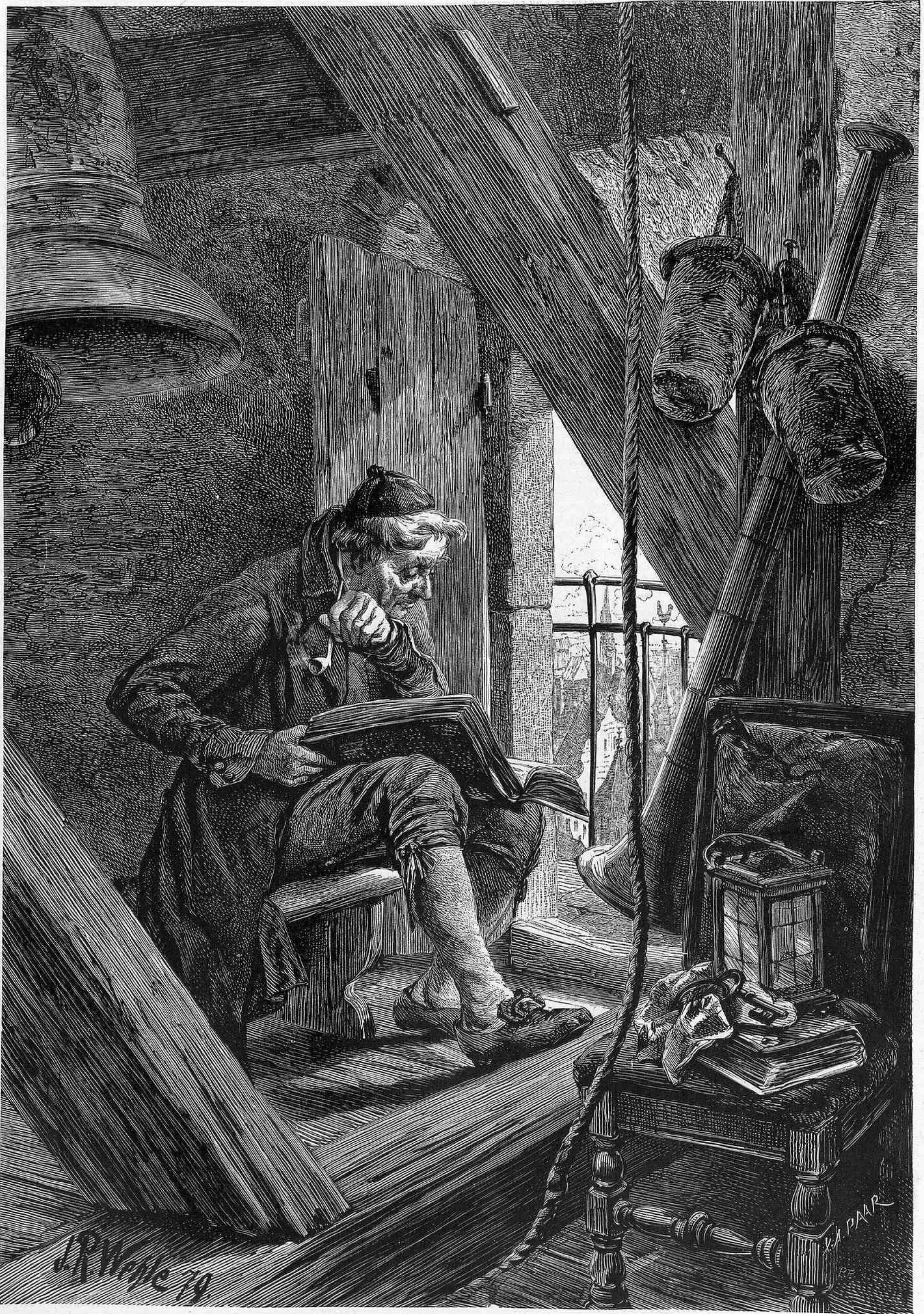
EL TORRERO, por J. R. Wehle