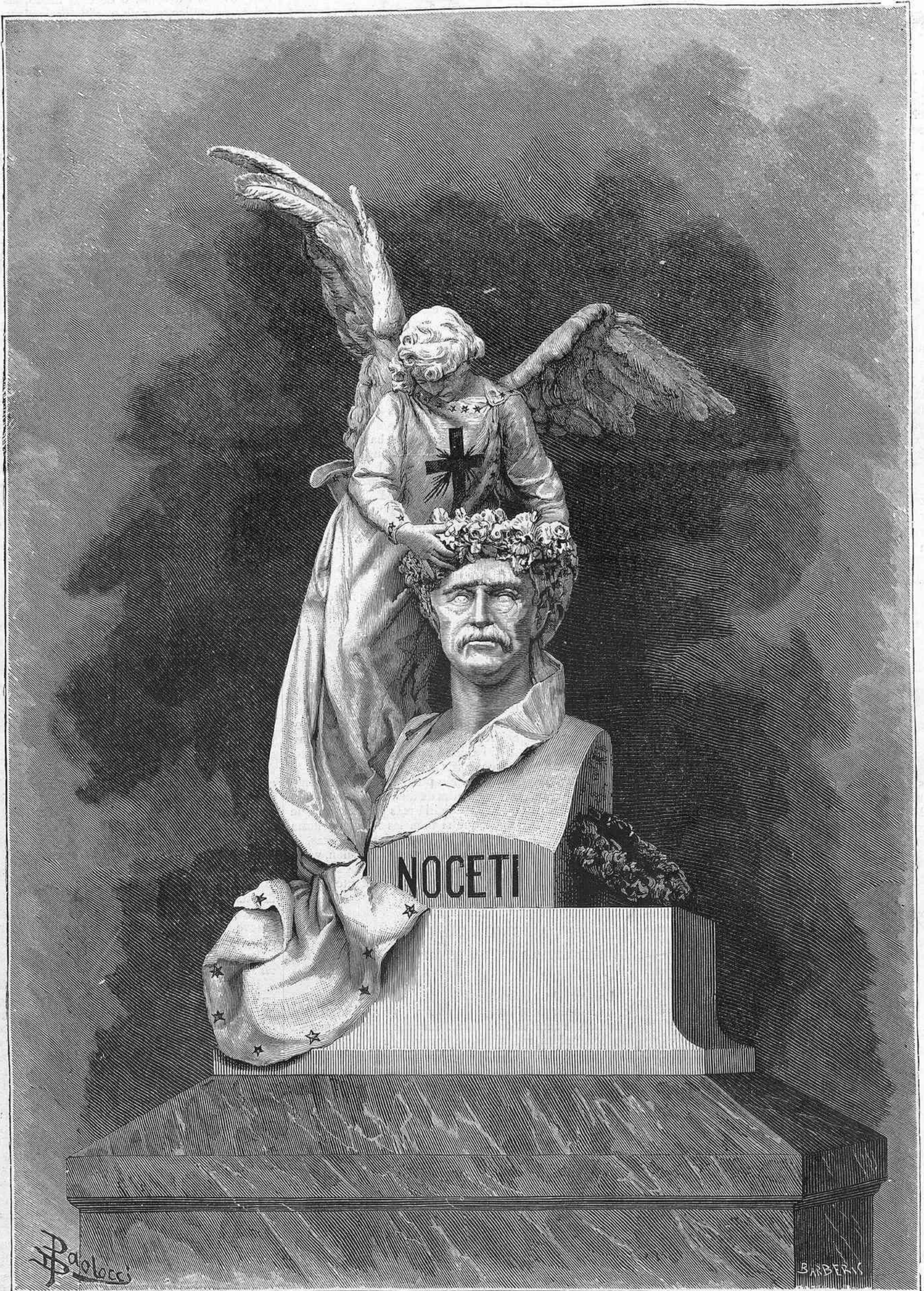
MONUMENTO A NOCETI, por Costa

riable de todo análisis, vamos á pasar de la complicacion inevitable de las invenciones á los conceptos puros, en cierto modo, de estas mismas invenciones.