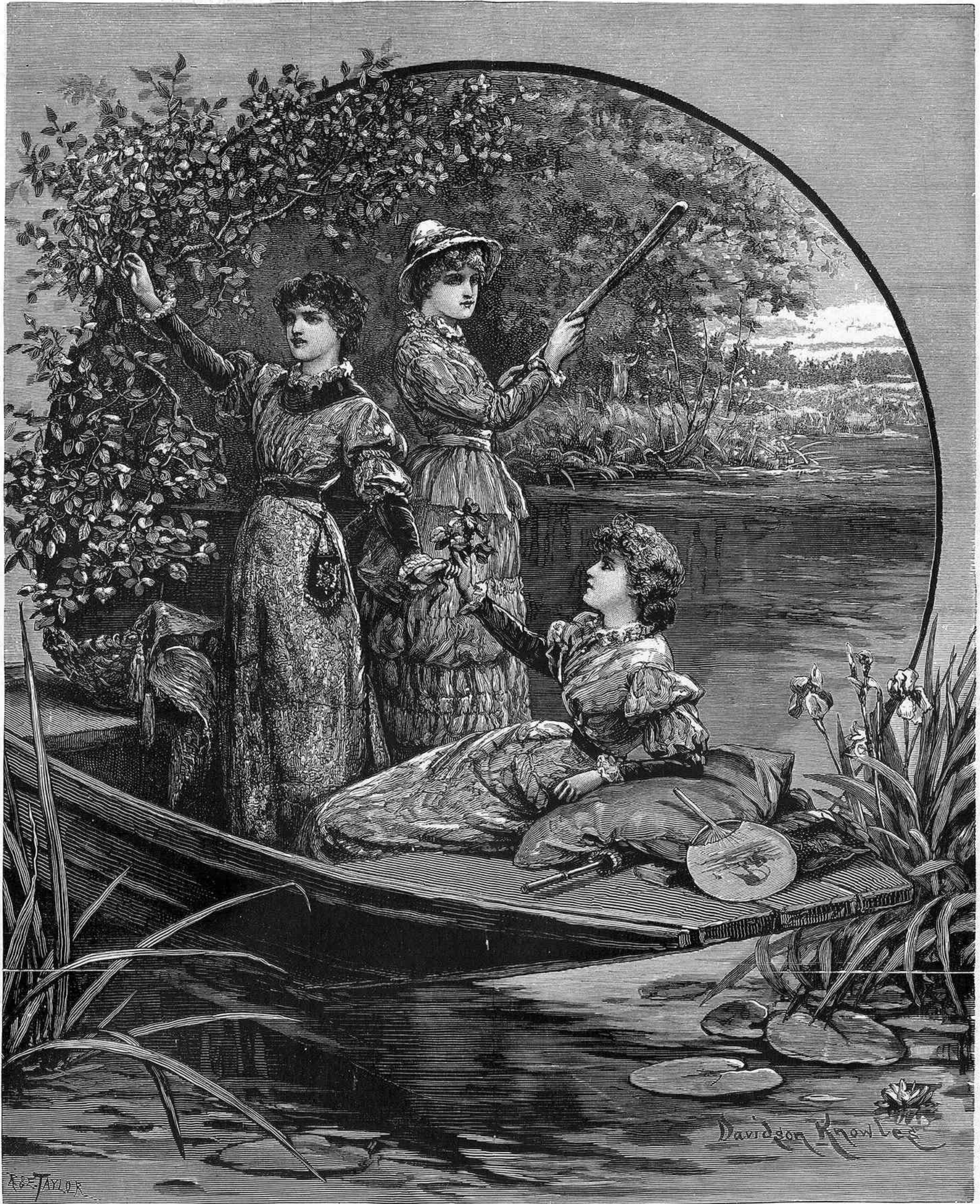
DIAS FELICES, por D. Knowles