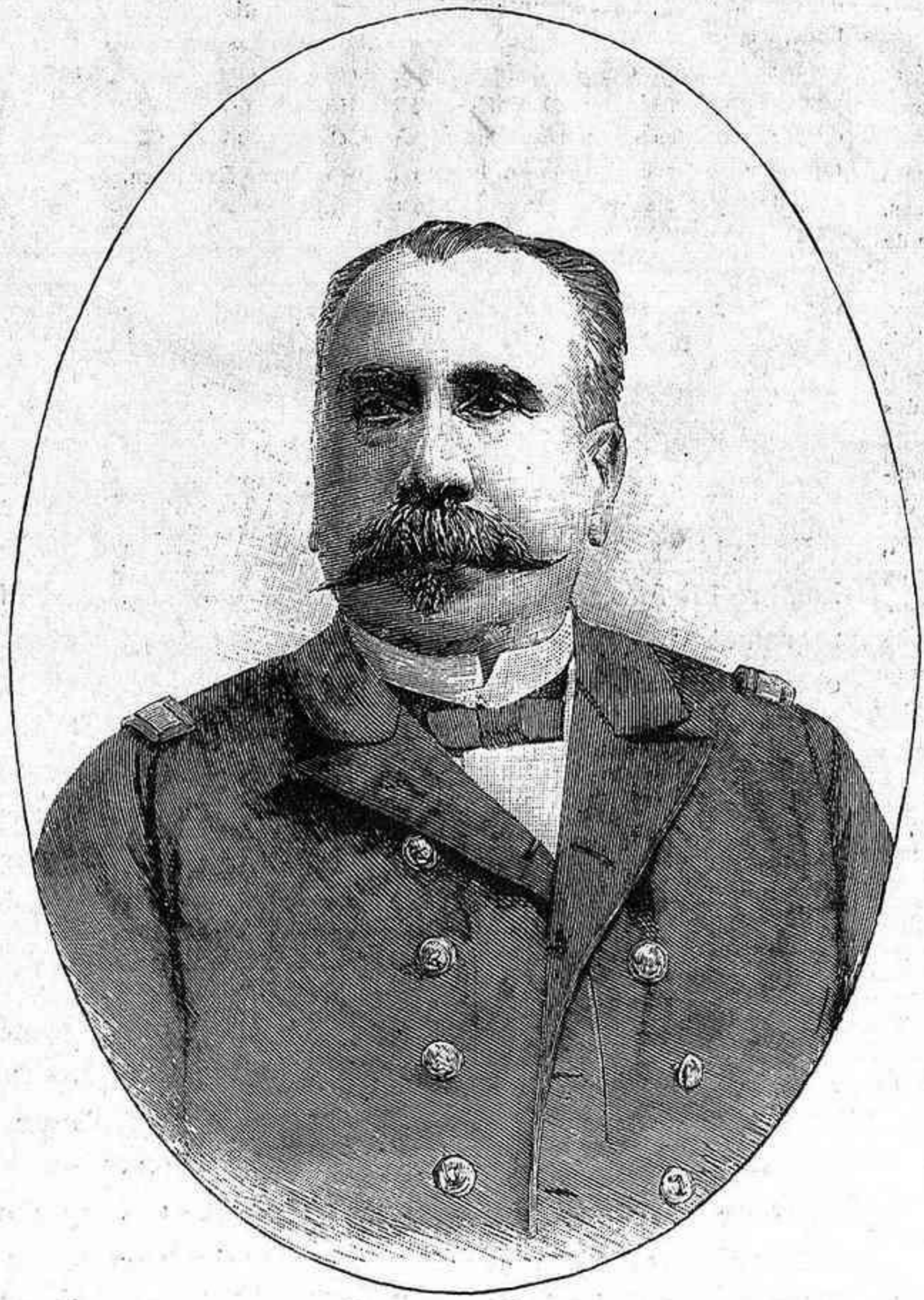
EL CAPITÁN DE FRAGATA DON VÍCTOR CONCAS, Autor de una conferencia sobre impresiones de un viaje por los Estados Unidos.