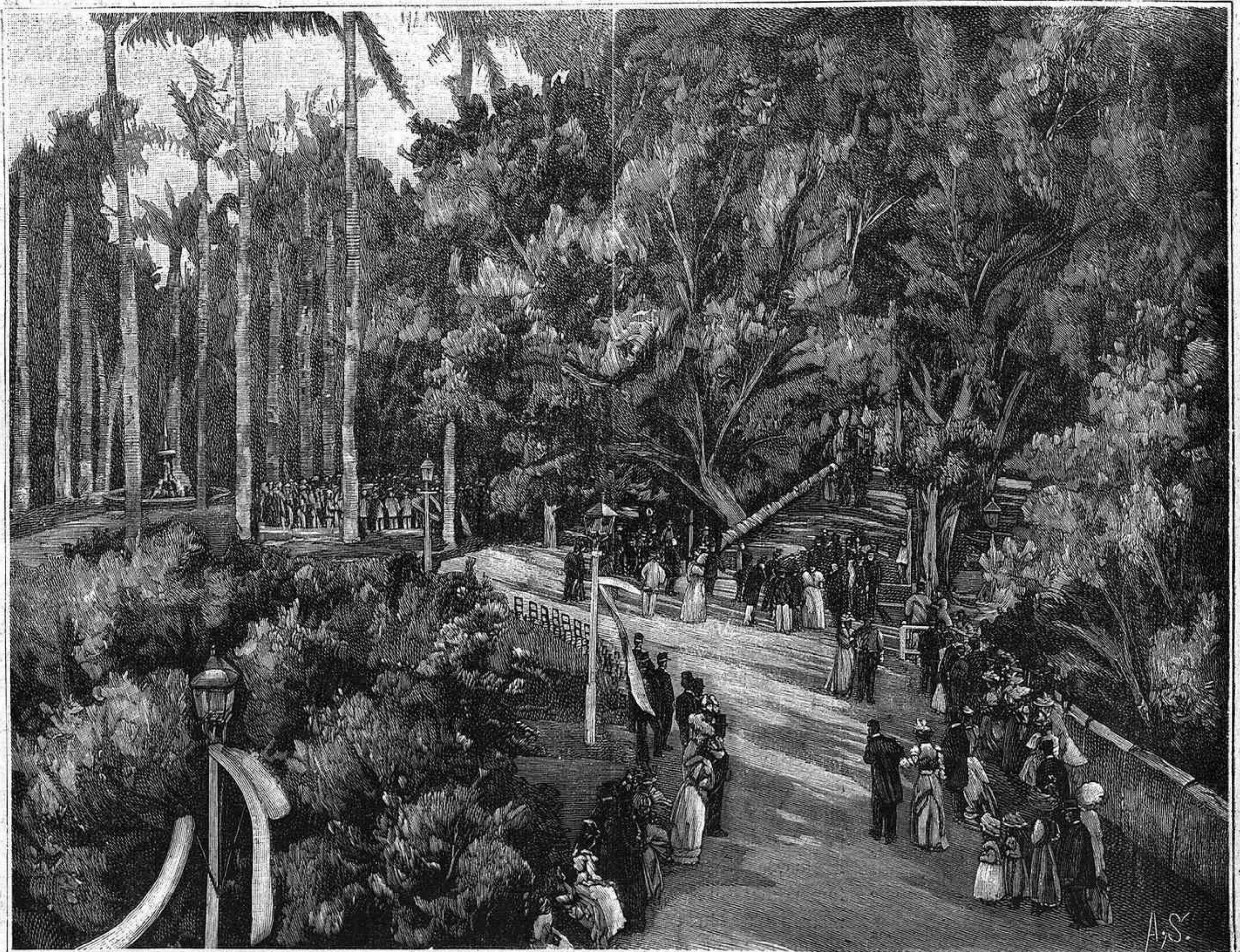
HABANA.—PARQUE DE LA QUINTA DE LOS MOLINOS