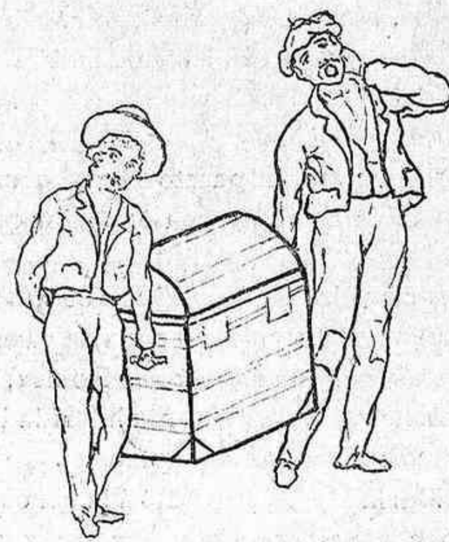
Los del mundo grande.

En el de la Comedia, temerosa, sin duda, de los estrenos, la dirección ha vuelto al repertorio, y