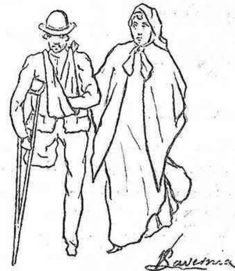
Los del humor malo.

Eslava continúa, como el anterior teatro, con El cortejo de la Irene y otras obras de menor valía.