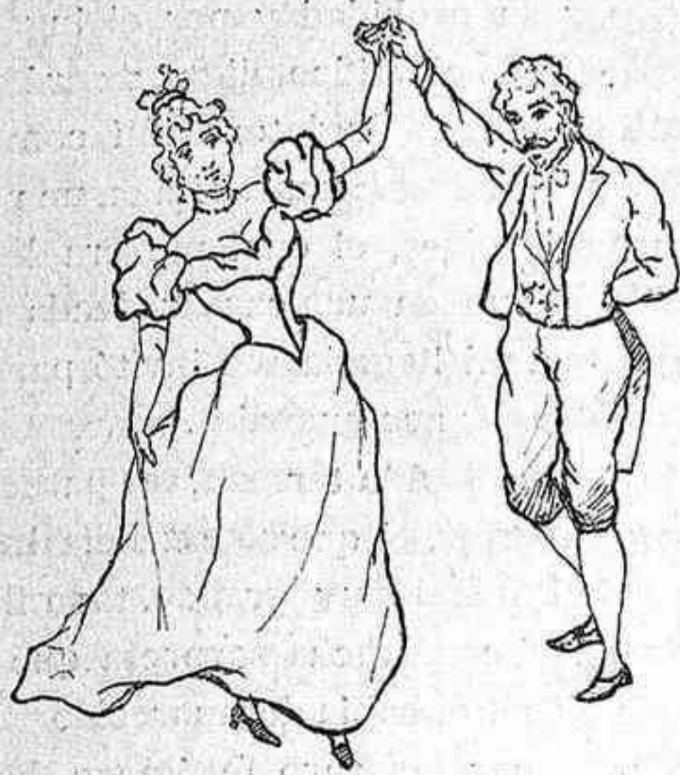
Los del gran mundo.

¿Son ó no son terribles los efectos de ese infer-