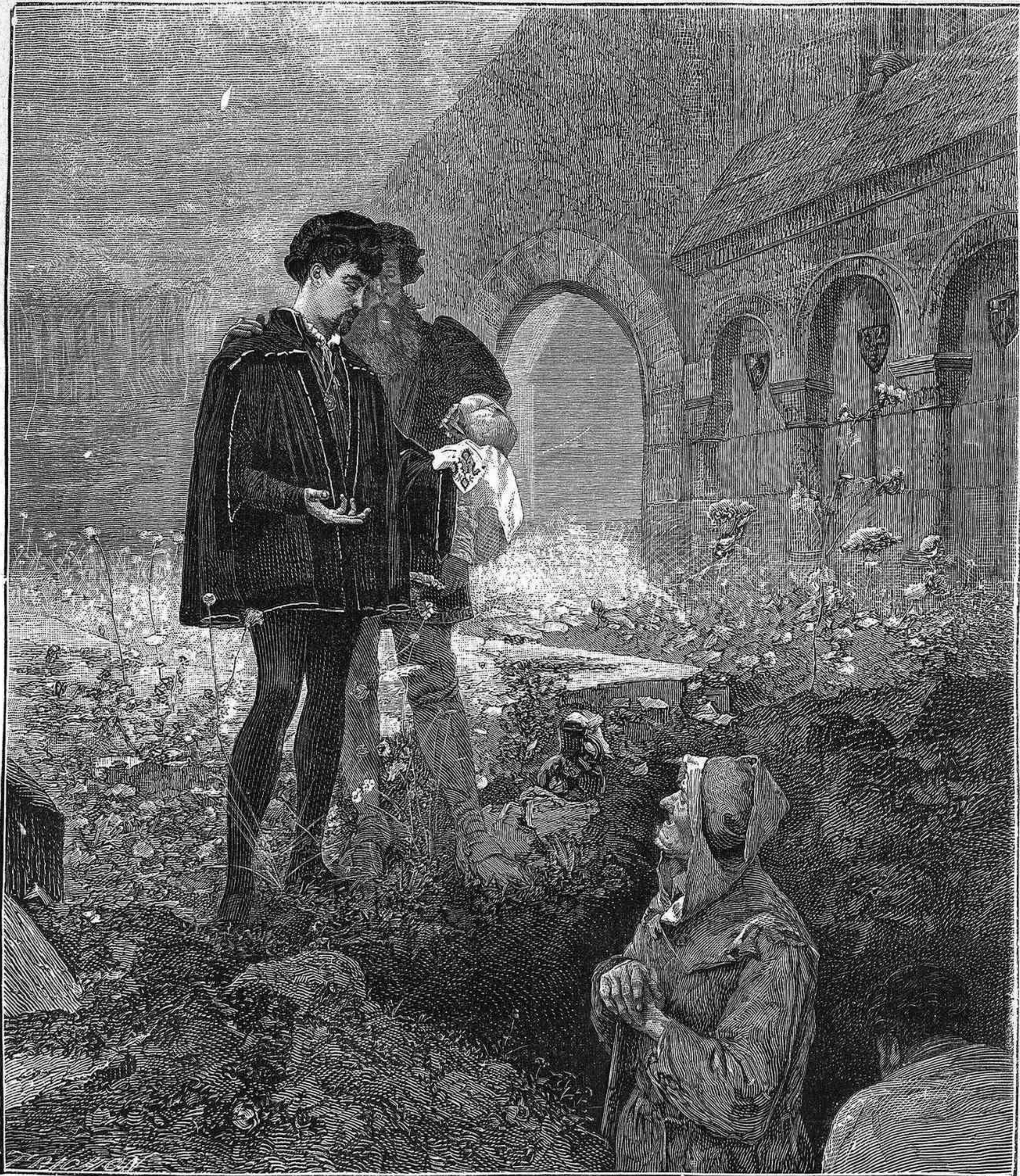
HAMLET Y LOS SEPULTEROS (cuadro de Bouvret).