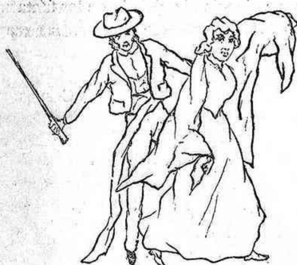
Los del mal humor.

Contra las chispas eléctricas está el pararrayos. Contra las que no son eléctricas, el amoniaco. Contra el veneno, los antidotos.