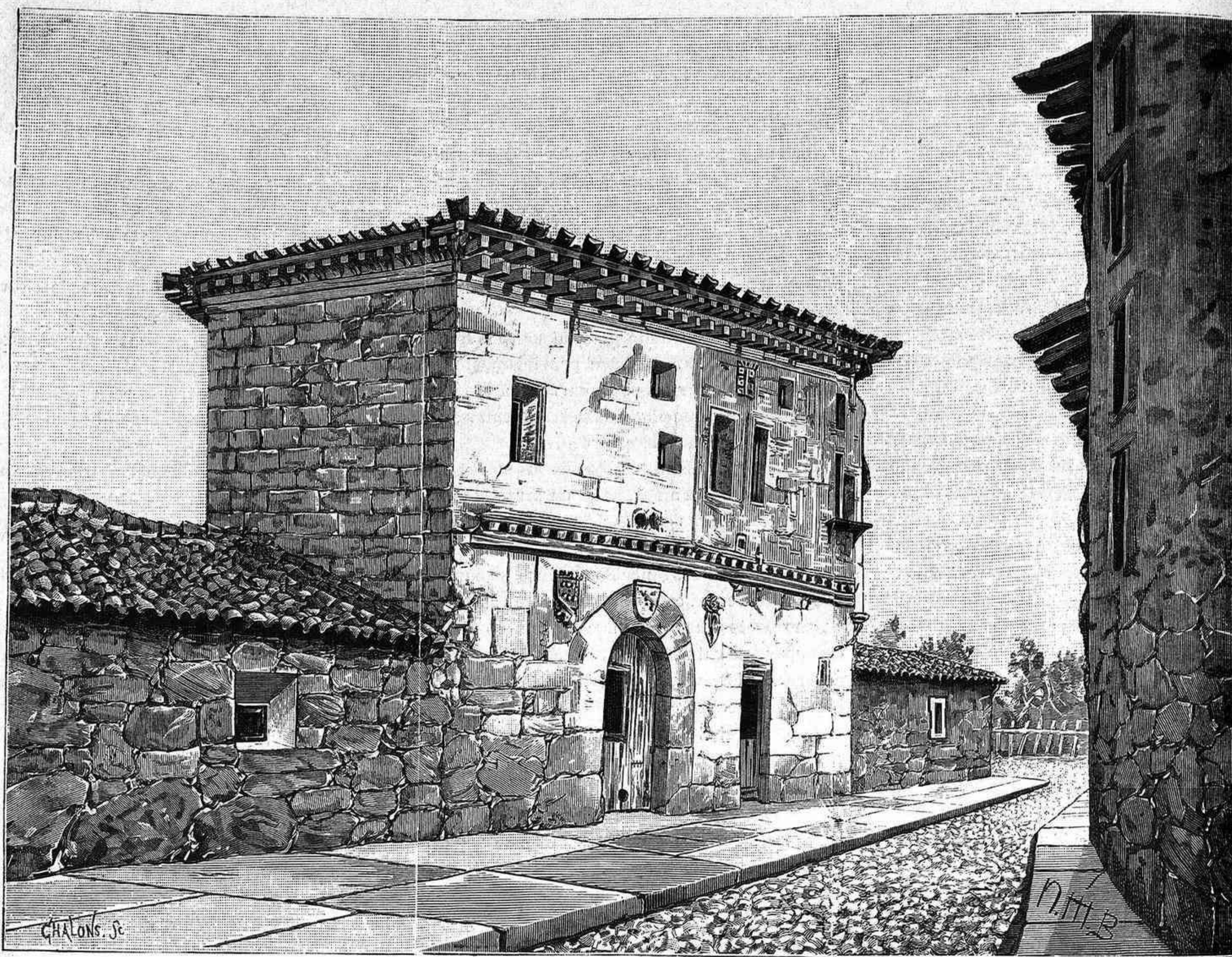
LA CASA DE LAS CORTES EN BRIVIESCA.