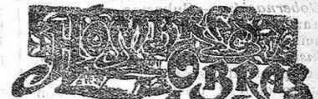
JACINTO JERÓNIMO DE ESPINOSA

En aquella gloriosa época de la pintura española en que maestros inimitables como Velázquez, Ribera, Murillo y Alonso Cano se sobrepusieron á las escuelas italiana, flamenca y francesa, descolló también el pintor allicantino Jacinto Jerónimo de Espinosa, nacido en Cocentaina el 2 de Junio de 1600.