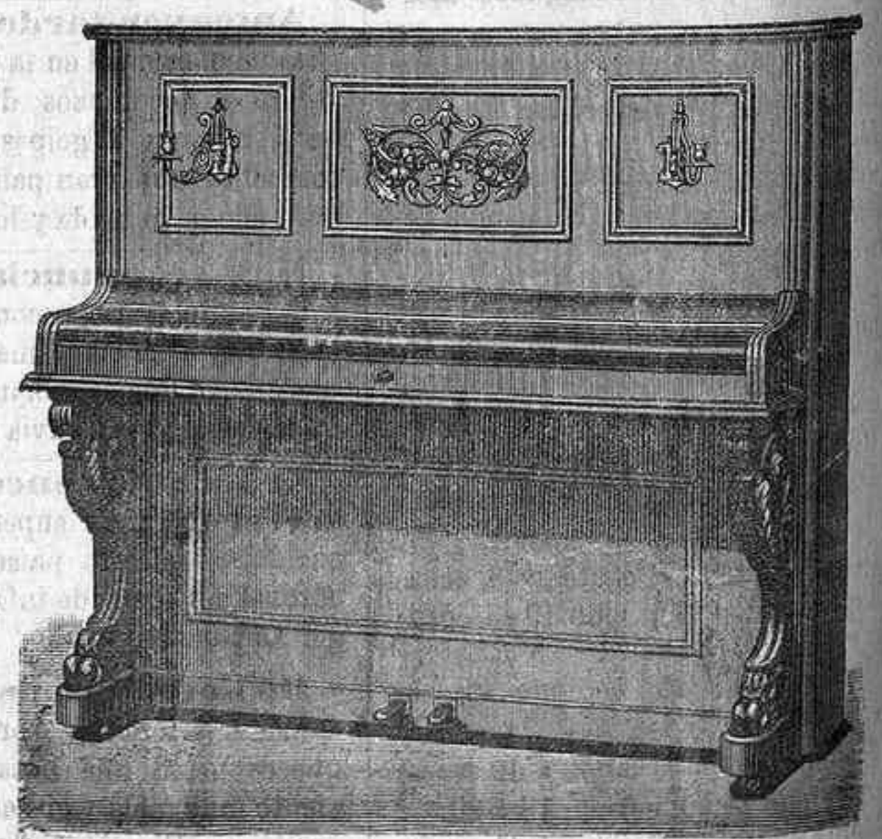
PIANO RESONADOR DE CONCIERTO, cuerdas cruzadas, armadura de hierro, altura metro 31 centímetros.

SURTIDO DE MÚSICA Y ACCESORIOS DE TODAS CLASES