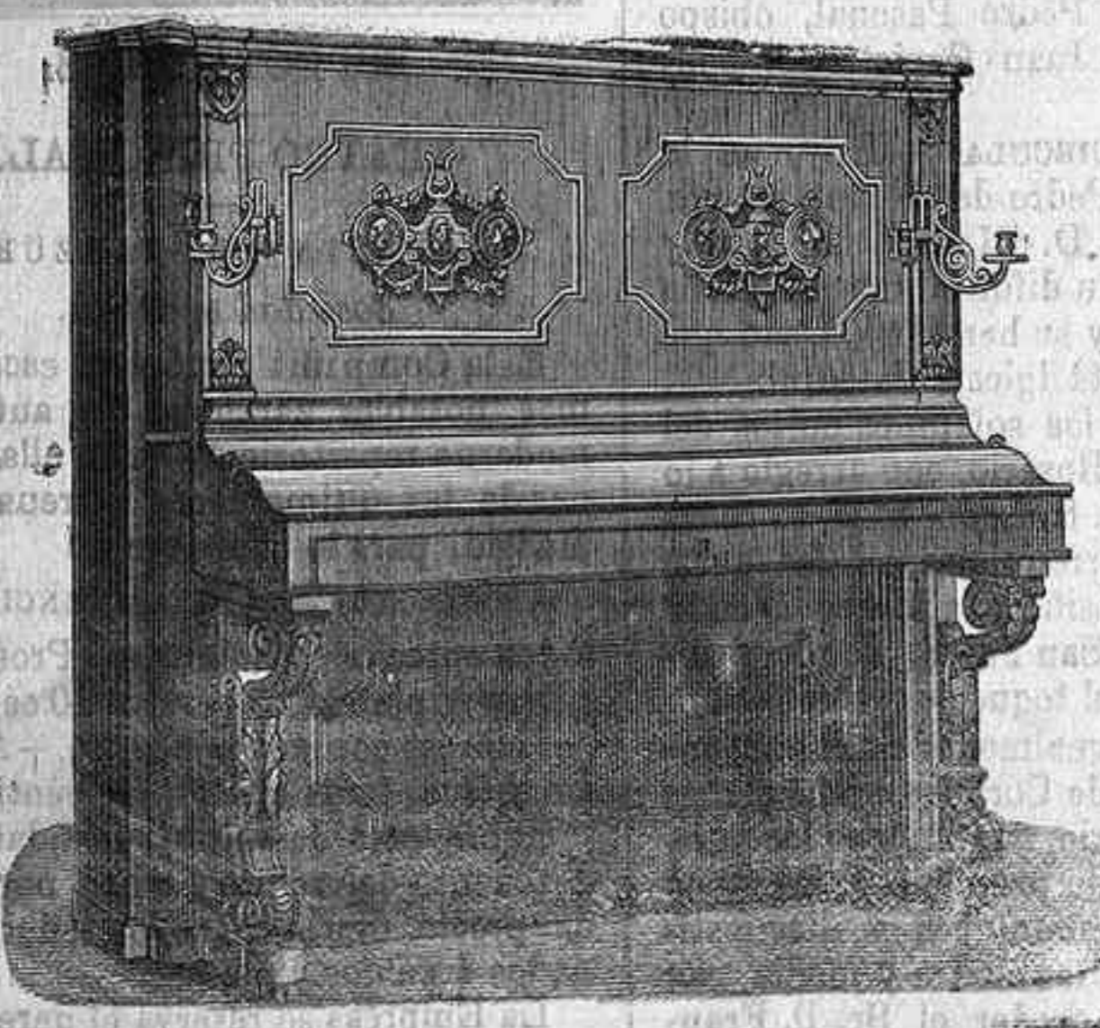
GRAN PIANO DE CONCIERTO con resonador, cuerdas cruzadas, marco de hierro y clavijero metálico, altura 1 metro 37 centímetros