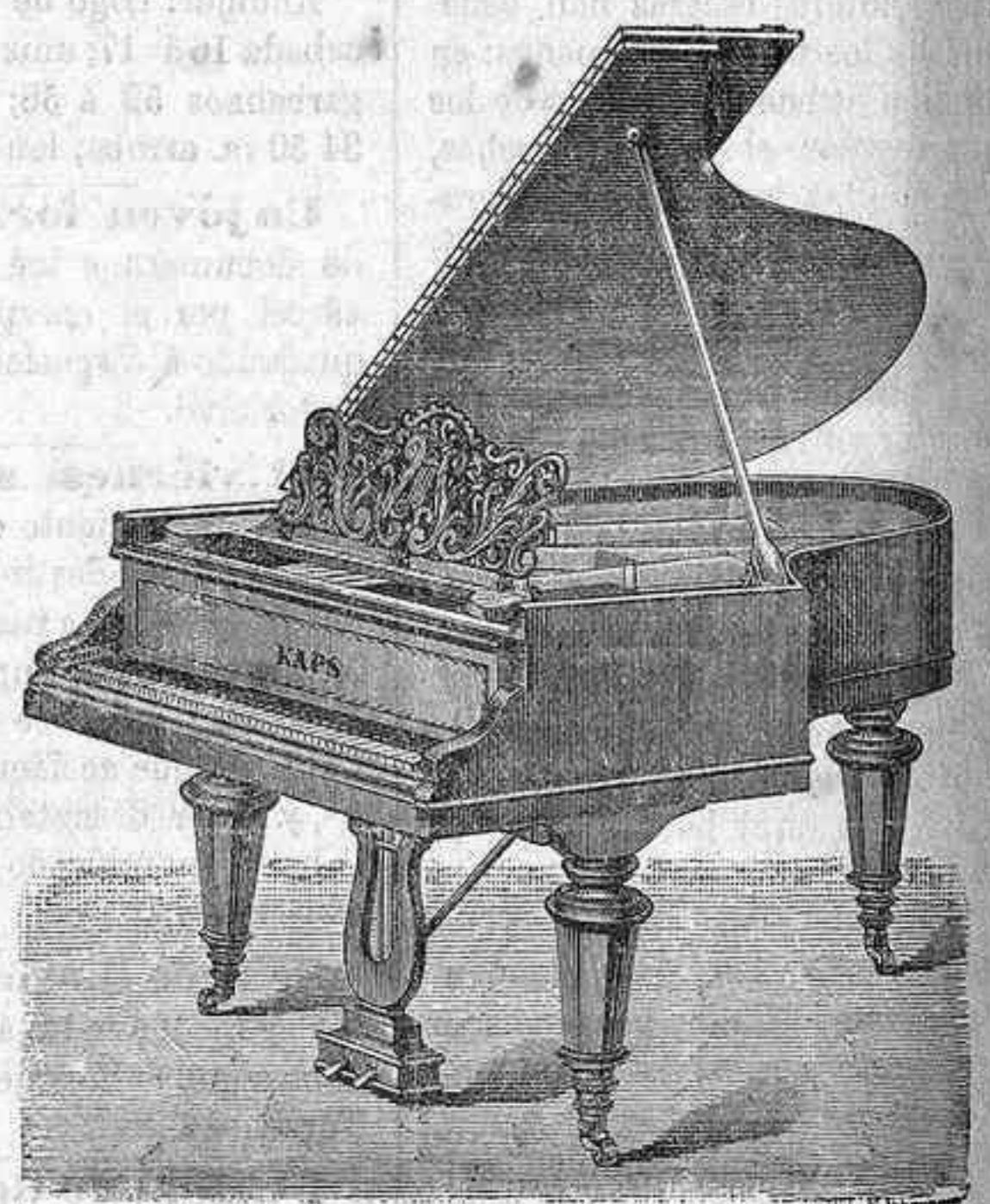
PIANO DE CONCIERTO con resonador.