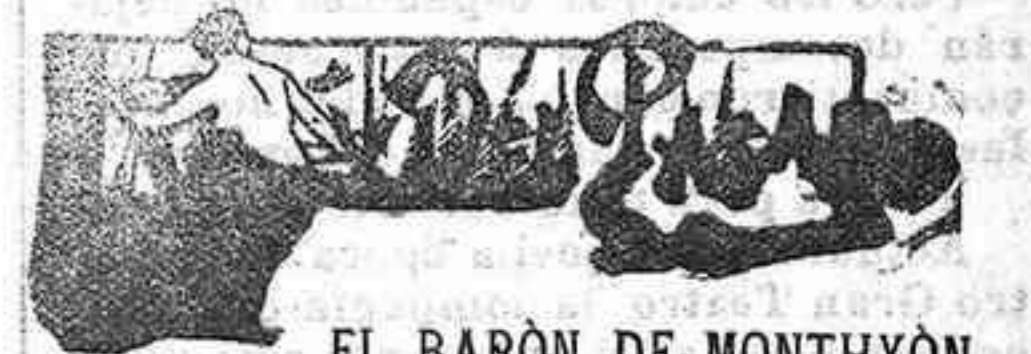
EL BARÓN DE MONTHYON

Paris 26.— Le Matin , en un despacho de Tánger, dice que el buque de guerra Kleber ha regresado á Tolón para sufrir reparaciones, siendo sustituido en las aguas marroquíes por el Duchayla .