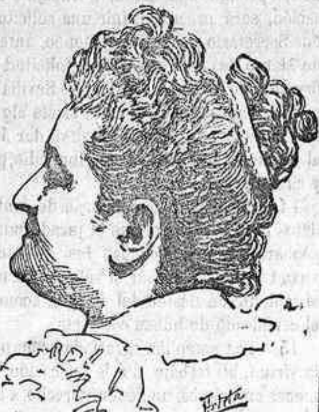
Doña Emilia Pardo Bazán

Lleva este por título Retratos y apuntes literarios y en él se confirma la natural aptitud que siempre demostró para la crítica la fecunda escritora y lo bien fundamentados que en el estudio están sus juicios, como así mismo su talento.