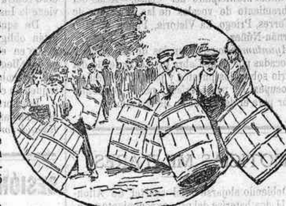
Match de rodadores de toneles

Después tuvo efecto la carrera con dos toneles, cuyas dificultades inútil es decir que eran mucho mayores, algo más que dobles.