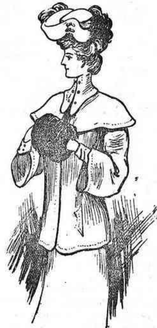
Abrijo para señoras jóvenes

Es de paño negro con motitas blancas. Tanto la espalda como los delanteros van sin entallar. Los bolsillos de esta prenda son en forma de cartera colocada á lo largo. Escavina del mismo paño; cuello vuelto, muy largo por delante y adornado con botoncitos dorados; manga ancha y suelta y respuntes alrededor de toda la prenda.