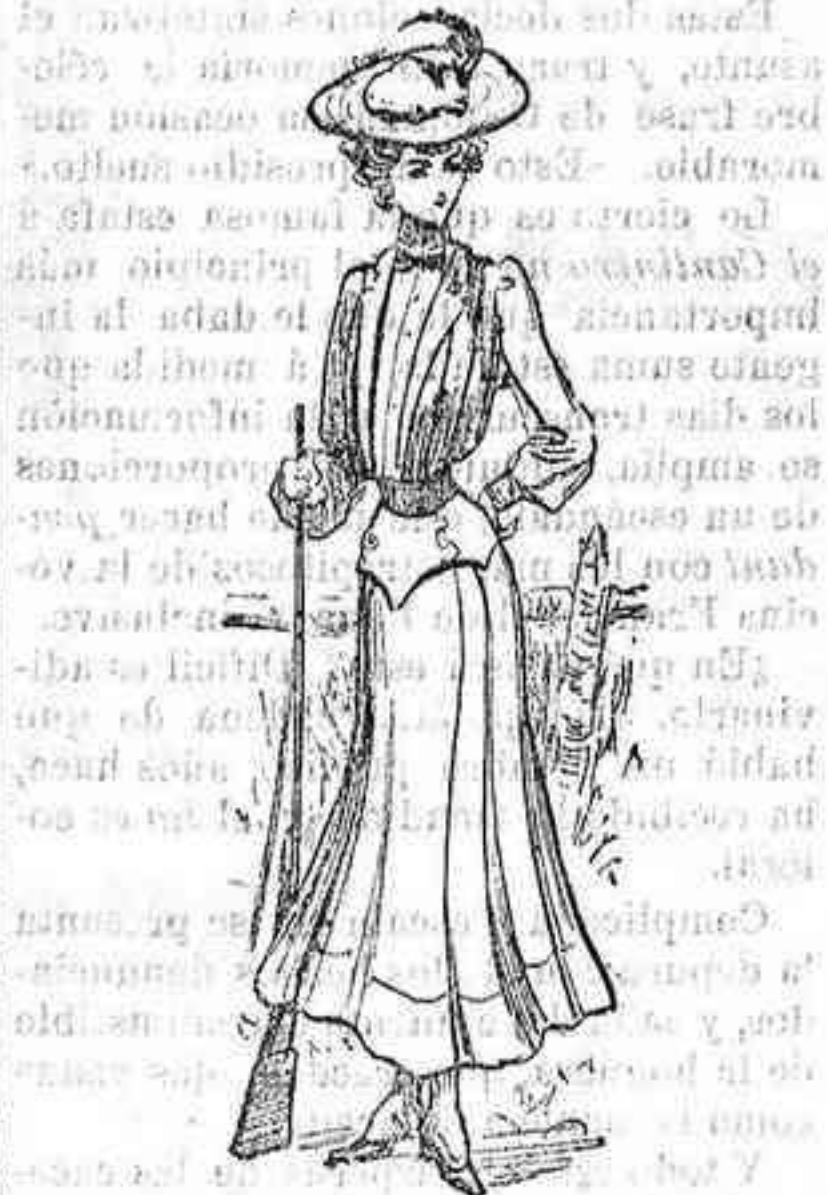
Traje de caza.

De lanilla azul marino. Se compone de blusa á pliegues huecos y abierta á lo largo del delantero, con cuello y solapas de seda del mismo color. Camisón blanco con cuello alto y corbata de seda negra, con lazo. Mangas holgadas con puño alto. Cinturón de piel, color obscuro. Falda corta con canesú cerrado á los lados y botín claro sobre bota de color.