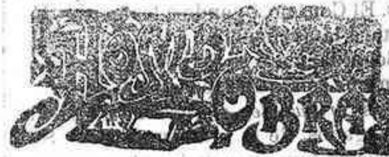
JOSÉ CELESTINO MUTIS