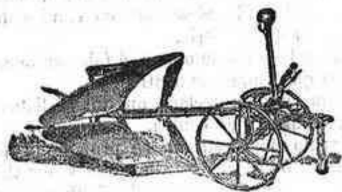
Arado Brabant doble Meteor