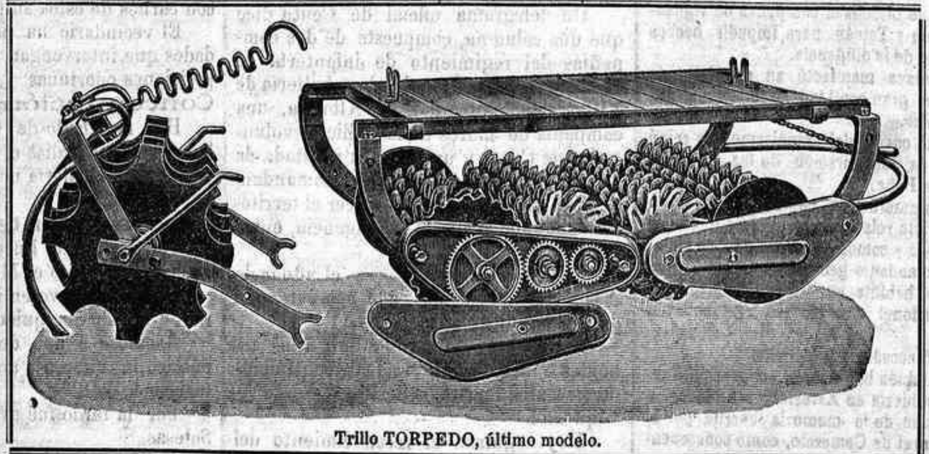
Trillo TORPEDO, último modelo.

Arados y Sembradoras Rud-Sack .—Distribuidoras de abonos Westfalia . —Segadoras y guadañadoras Deering Ideal .—Trillos rotativos reformados Torpedo .—Arados Melotte y Plutón .—Cultivadores Planet .—Gradas de Estrella Bajac .—Gradas de flejes Hércules .